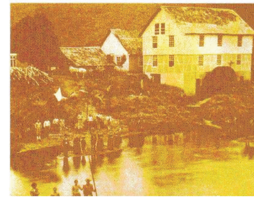
Primeira Sede da Indústria Karsten - 1886

A necessidade de acesso ao rio para a locomoção e para a agricultura, fez com que os lotes fossem demarcados, perpendiculares ao rio e aos ribeirões.