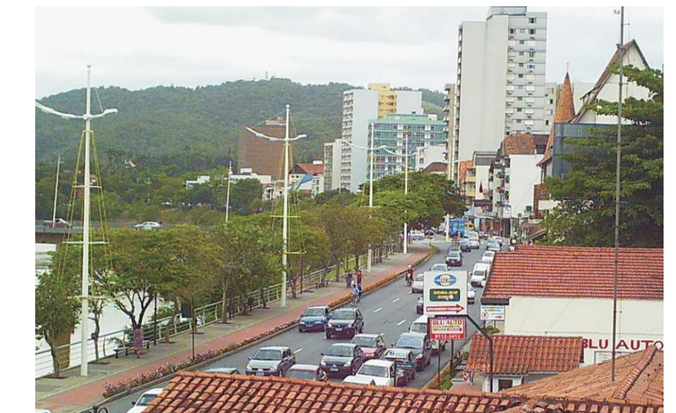
Margem Direita

A ocupação da cidade ocorreu de forma mais intensa na margem direita do rio, o que continua a ocorrer até os dias de hoje. A localização da sede e o surgimento de novos núcleos na margem direita geraram as primeiras centralidades e a formação de bairros.