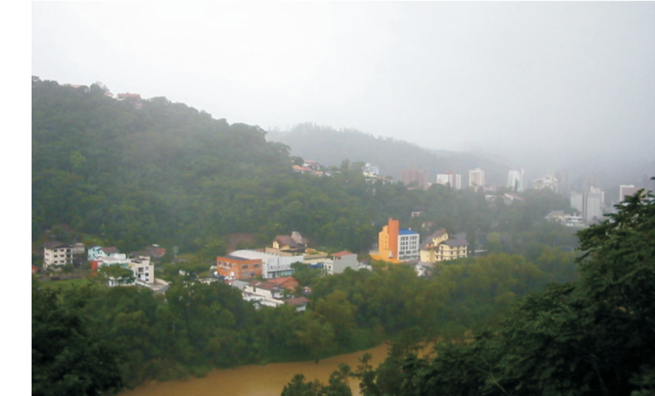
Margem Esquerda

O plano diretor de 1989 possibilitou a verticalização dos bairros próximos ao centro, gerando um forte adensamento dessas áreas servidas de infra-estrutura e grande concentração de serviços.