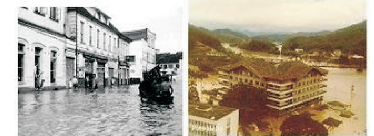
Enchente em 1957