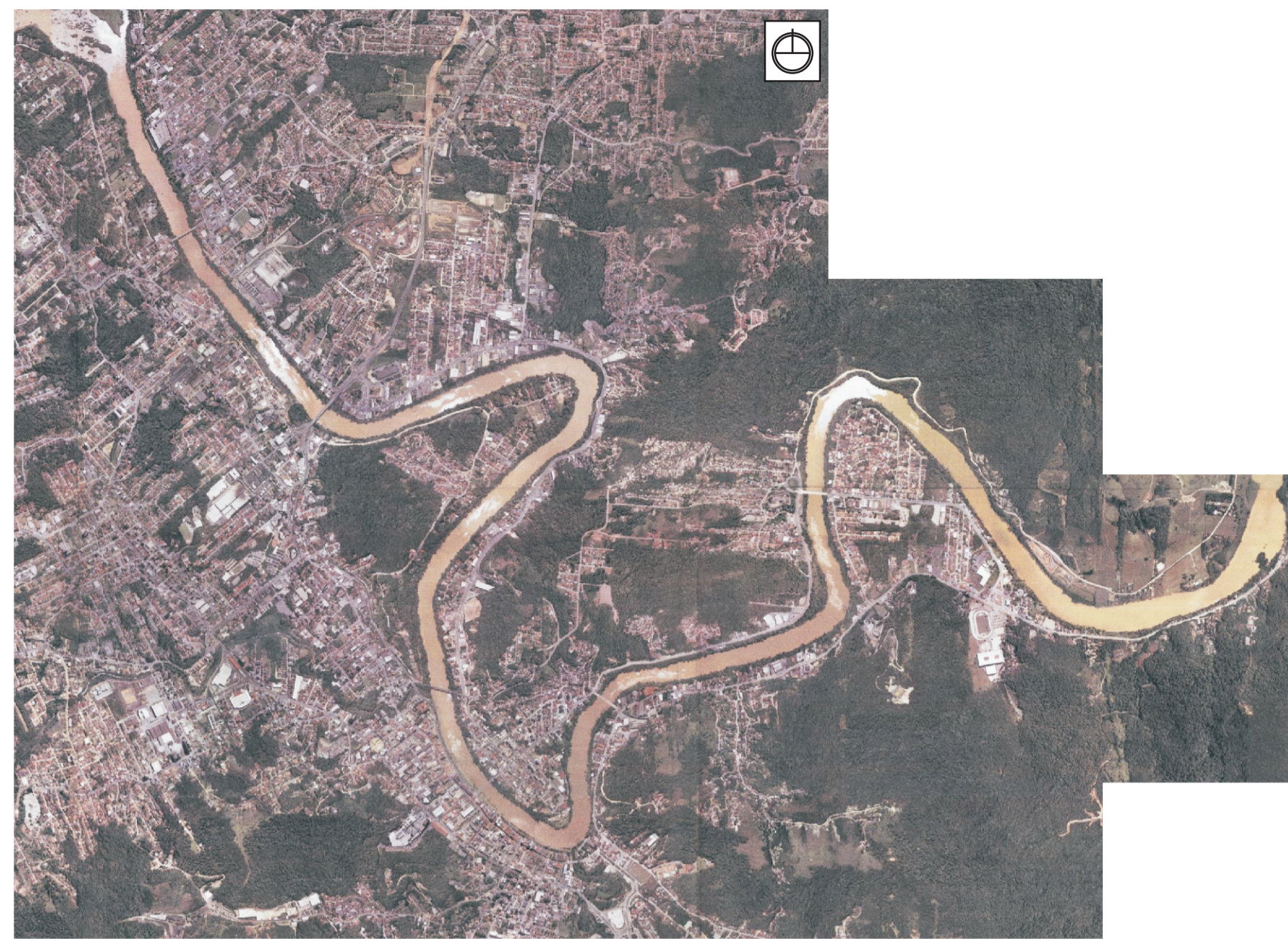
Imagem Aérea do Trecho Navegável do Rio Itajaí-Açu na cidade de Blumenau.