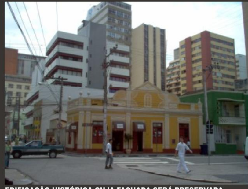
EDIFICAÇÃO HISTÓRICA CUJA FACHADA SERÁ PRESERVADA.