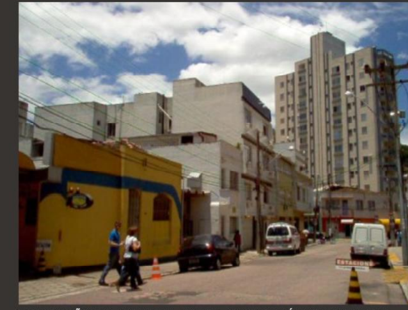
EDIFICAÇÃO EM AMARELO, LOCAL ONDE SERÁ IMPLANTADO O EDIFÍCIO MULTIFUNCIONAL.