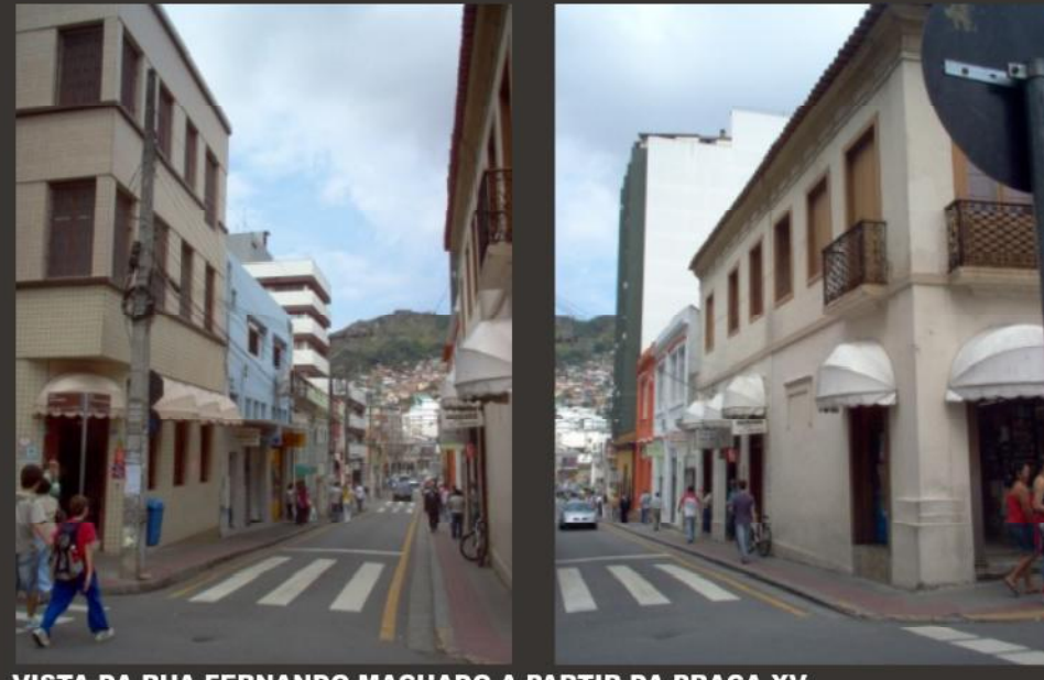
VISTA DA RUA FERNANDO MACHADO A PARTIR DA PRAÇA XV. PRESENÇA DE EDIFICAÇÕES COLONIAIS.