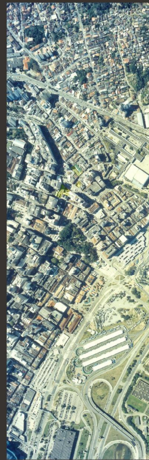
ÁREA DE INTERVENÇÃO FOTO AÉREA DO CENTRO

ZONEAMENTO