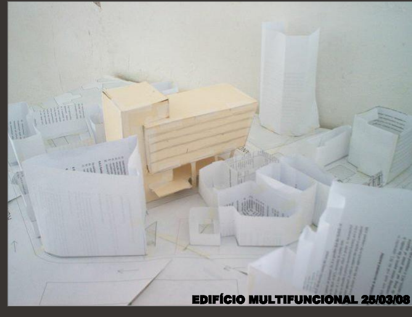
EDIFÍCIO MULTIFUNCIONAL 25/03/06