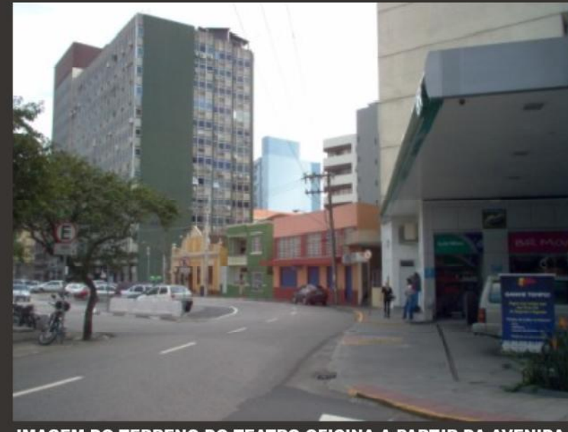
IMAGEM DO TERRENO DO TEATRO-OFFICINA A PARTIR DA AVENIDA HERCÍLIO LUZ.