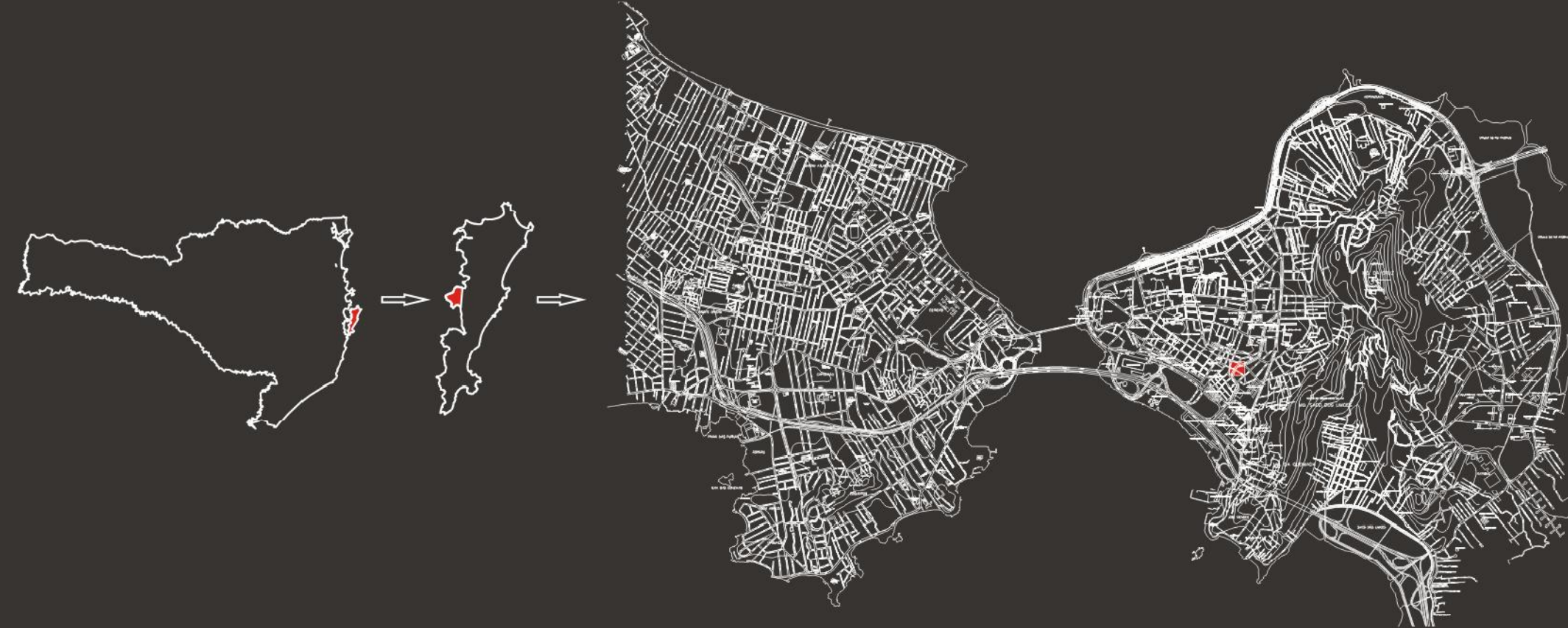
LOCALIZAÇÃO DA ÁREA DE ESTUDO. ESTADO DE SANTA CATARINA, ILHA DE SANTA CATARINA, CENTRO HISTÓRICO DA CIDADE DE FLORIANÓPOLIS.