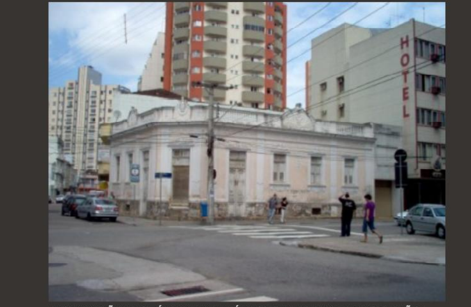
EDIFICAÇÃO HISTÓRICA EM RUÍNAS, CUJAS FACHADAS SERÃO PRESERVADAS. EM SEU INTERIOR SERÁ IMPLANTADO O ALBERGUE.