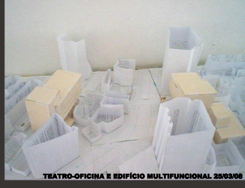
TEATRO-OFFICINA E EDIFÍCIO MULTIFUNCIONAL 25/03/06