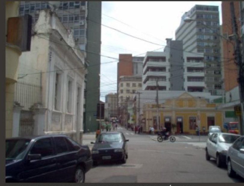
RUA FERNANDO MACHADO E FACHADAS HISTÓRICAS PERTENCENTES AO PROJETO.