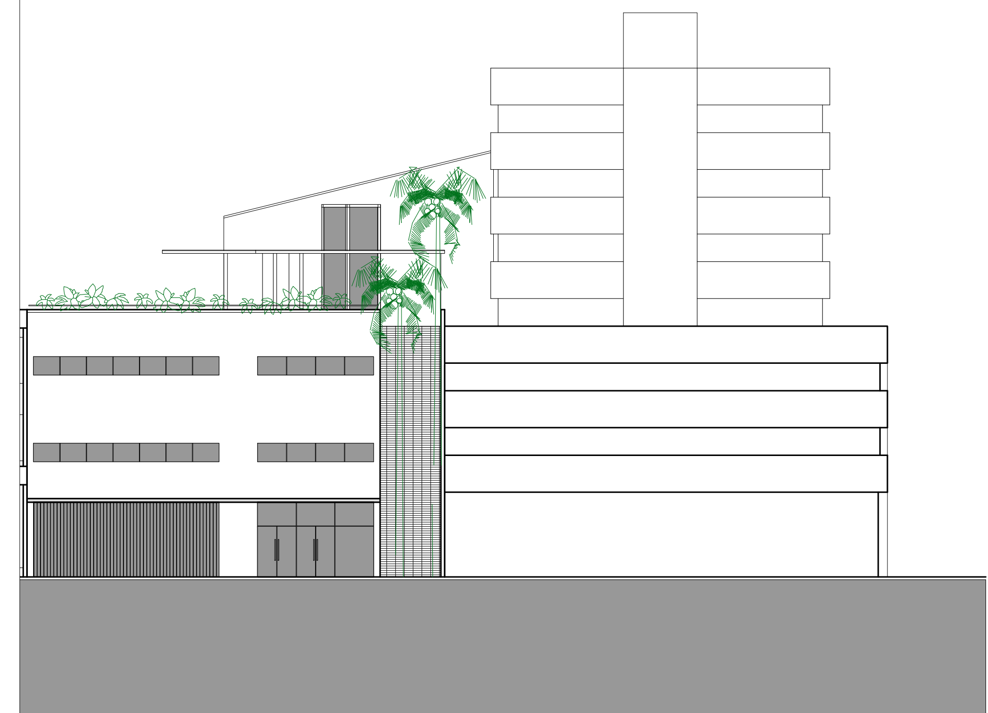
FACHADA DA RUA SALDANHA MARINHO ESCALA: 1/200