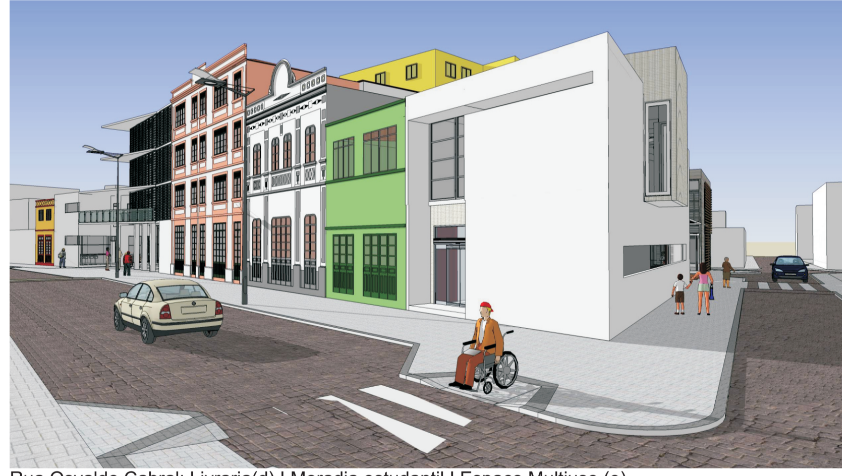
Rua Osvaldo Cabral: Livraria(d) | Moradia estudantil | Espaço Multiuso (e)