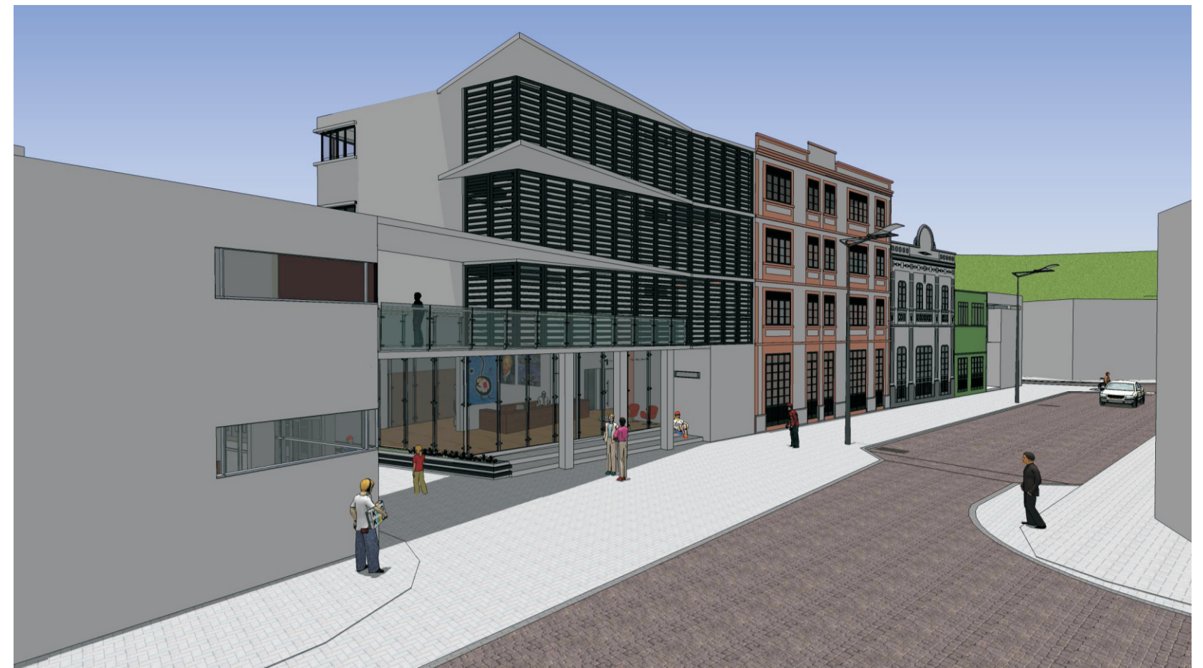
Rua Osvaldo Cabral : Café(e) | Moradia estudantil | Livraria(d)