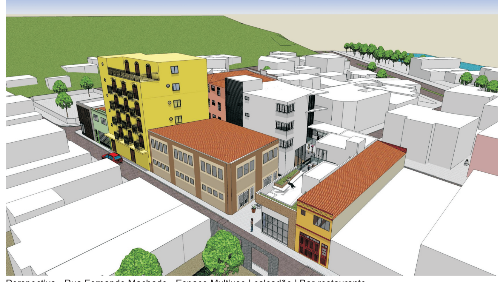
Perspectiva - Rua Fernando Machado - Espaço Multiuso | calçada | Bar-restaurante