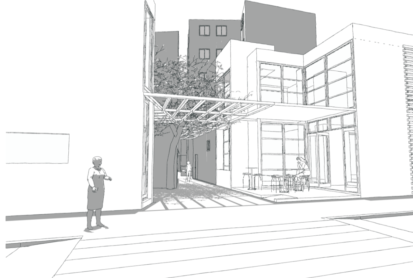
Entrada da rua interna entre livraria (e) e restaurante (d)