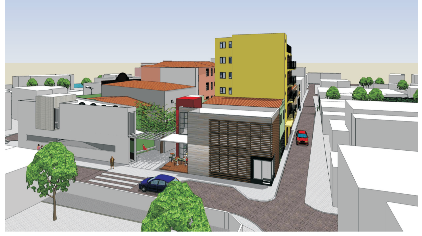
Rua Voluntário Benevides: Livraria | restaurante