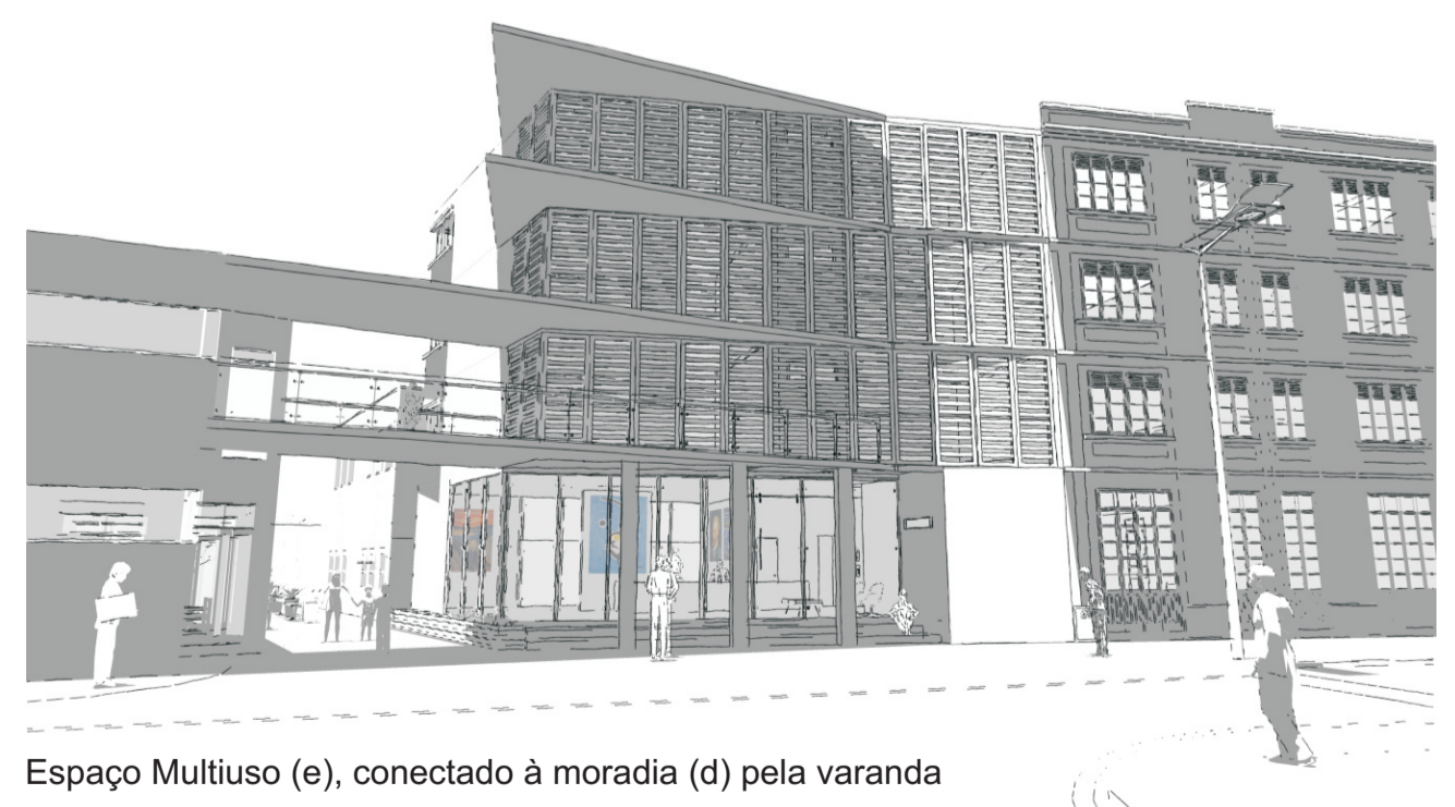
Espaço Multiuso (e), conectado à moradia (d) pela varanda