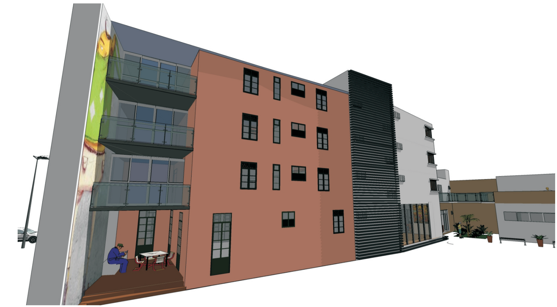
A fachada do Grande Hotel voltada para o interior da quadra, sofreu alterações com a eliminação de um espaço ocioso que impedia a circulação dos pedestres e a criação de cozinhas coletivas e varandas em cada pavimento. Estas, são em estruturas metálicas e fechamento em vidro, deixando clara a inserção do novo no antigo.