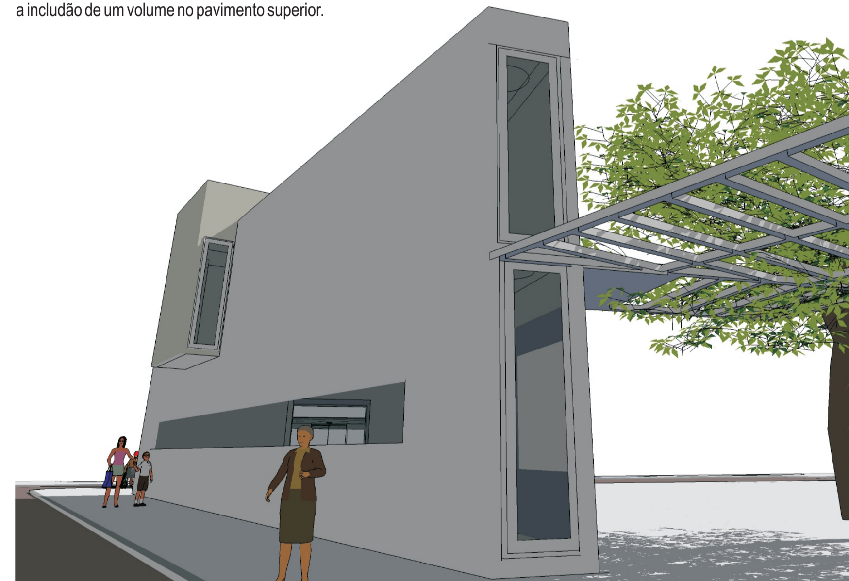
A livraria está situada em um terreno estreito com orientação sul em sua maior fachada. Assim, 4 domus transparentes foram colocados na fachada para melhor aproveitamento da luz natural. Este edifício, aliado ao pergolado e ao restaurante, configura a entrada na rua interna.