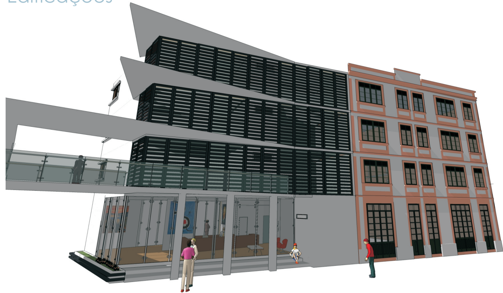
O antigo e um novo como um só. A horizontalidade da fachada é mantida com a inclusão de elementos metálicos que ainda protegem os dormitórios da incidência de luz solar. Os pilares do térreo mantem o ritmo da fachada.