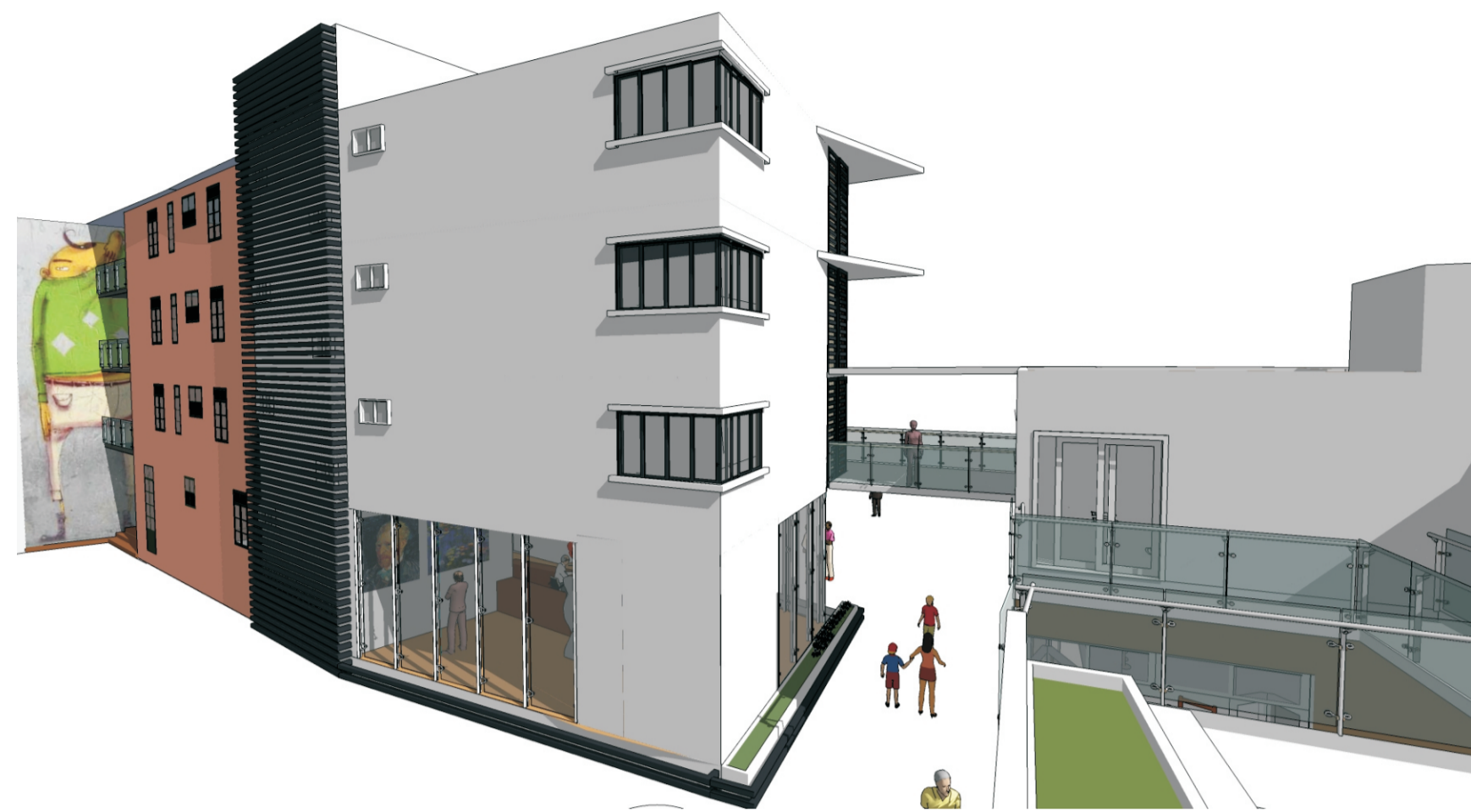
Os dormitórios possuem janelas voltadas para o calçadão e o interior da quadra. Este, se integra à moradia através de um pano de vidro, de onde se avista as obras expostas. À esquerda, a antiga parede remanescente foi pintada pelos moradores com um grande painel, como forma de apropriação do espaço.