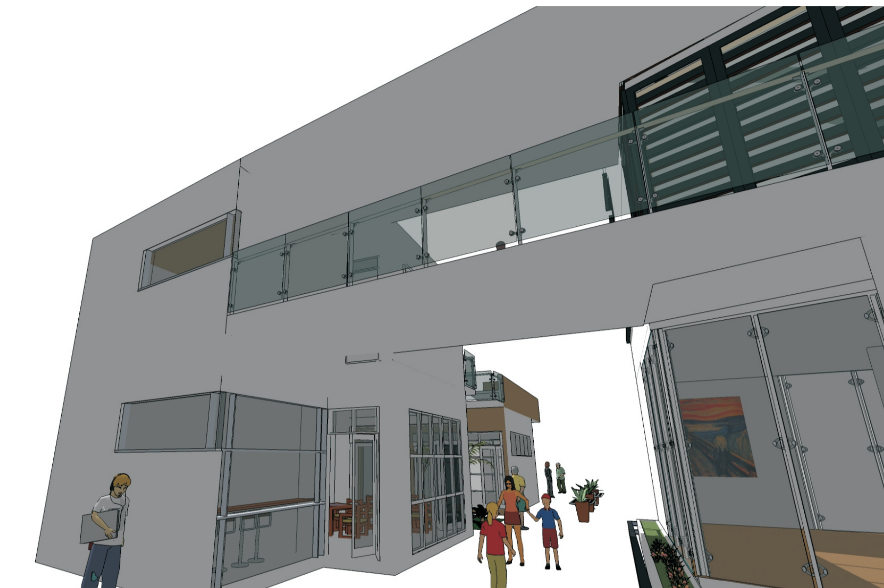
Os dois edifícios, antes em quadras separadas, são conectados pela varanda, que funciona como um "pórtico" para entrada dos pedestres no calçadão. O uso do branco e do vidro conferem unidade ao conjunto.