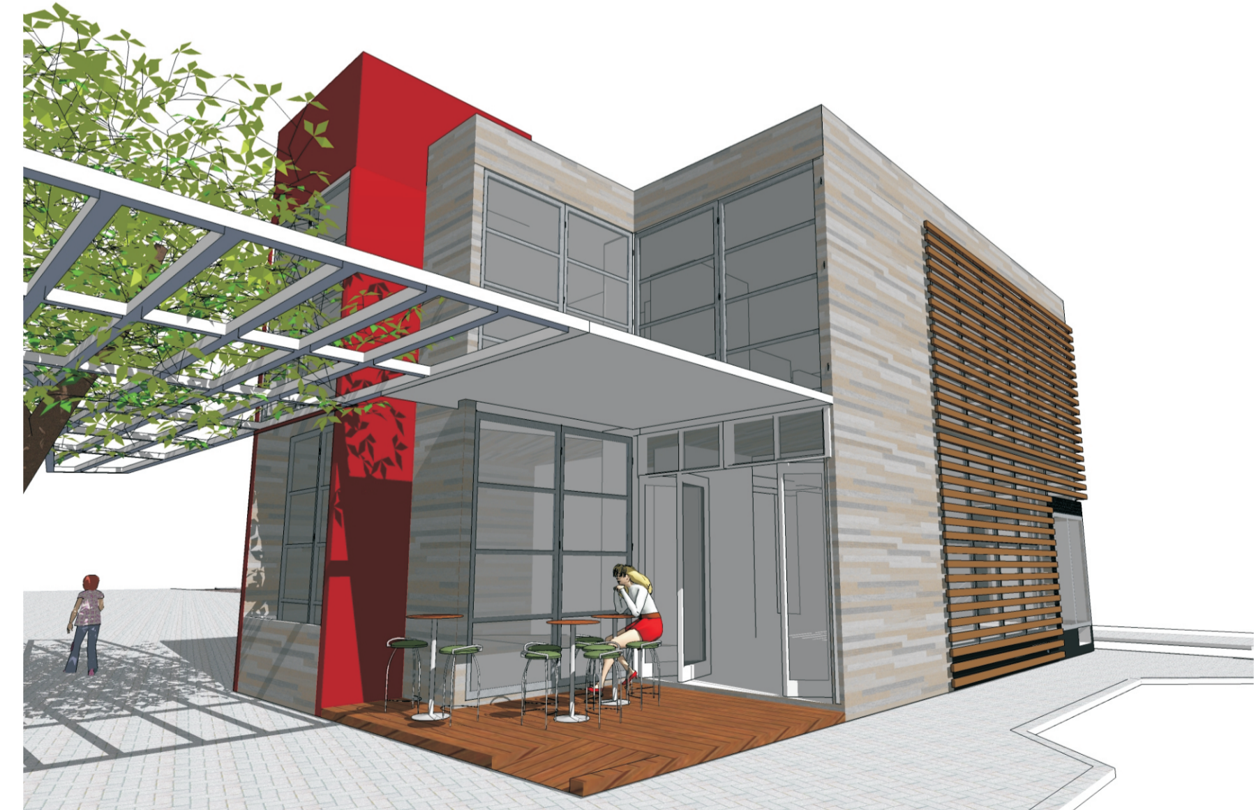
O deck do bar-restaurante é uma das áreas de estar ao longo da rua interna. Ele possui uma cobertura que se integra ao pergolado e à livraria, fazendo uma releitura da configuração da quadra.