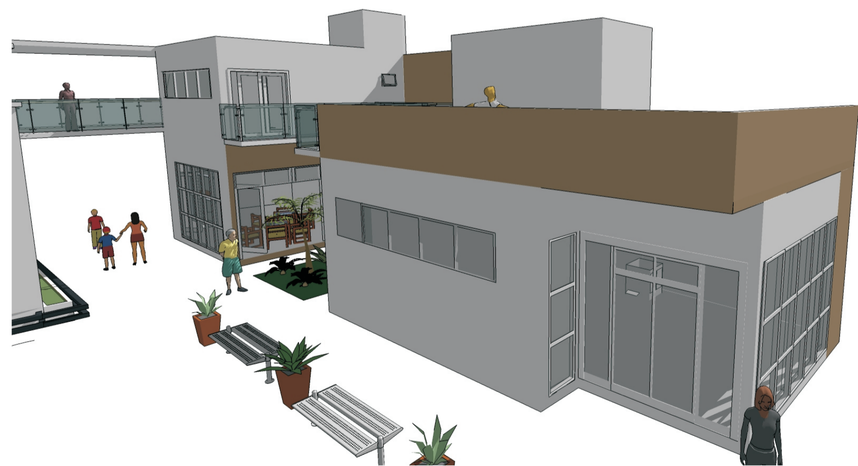
O edifício multifuncional possui áreas de uso público - café, espaço virtual e jardins - e privado - apartamento para professores visitantes, que se conecta à moradia estudantil pela varanda.