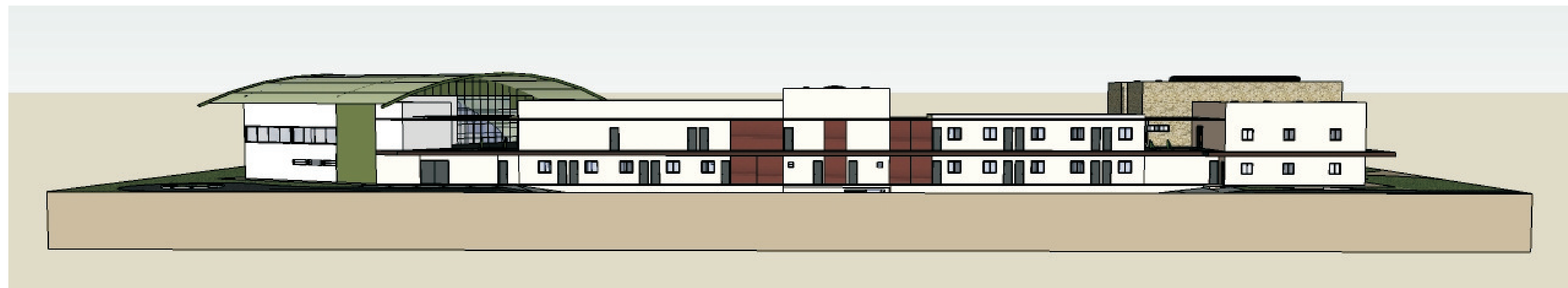
FACHADA LATERAL ESQUERDA ESC: SEM ESCALA