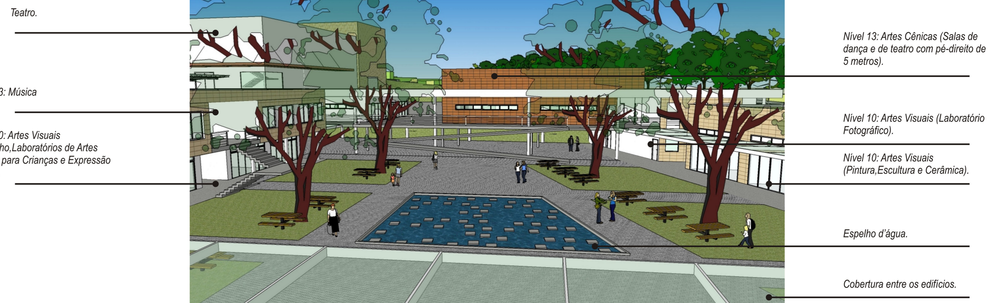
Perspectiva Geral do Pátio Interno.