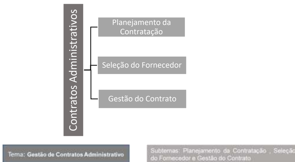
Figura 3 – Árvore temática sobre contratos administrativos