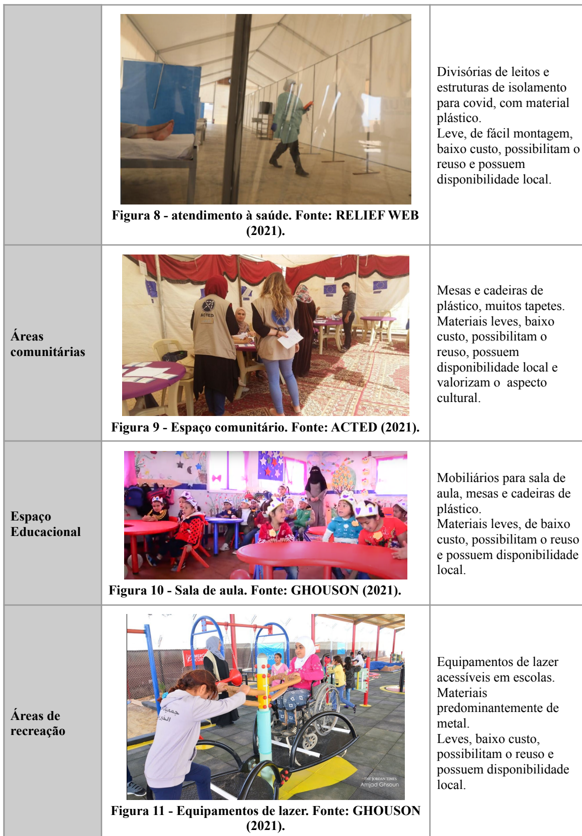
Quadro 3 - Análise dos mobiliários e equipamentos.