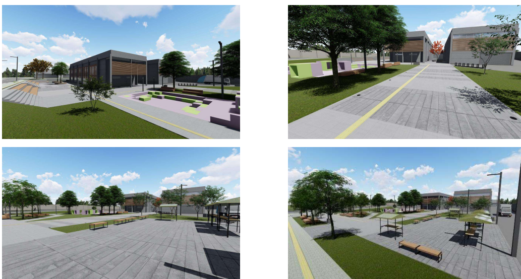
Figura 3 - Imagens do projeto: playground, acesso principal e espaço multiuso. Fonte: DAUDT, 2019.

Já no espaço aberto (Figura 3), é proposta uma ampla área arborizada que abrigará uma praça infantil, espaços de permanência e atividades de lazer. Outro espaço proposto é o multiuso, que poderá receber feiras para a venda de produtos alimentares cultivados pelas famílias, artesanato, brechós, food trucks , entre outras, que estimulem a economia local, exposição e venda dos trabalhos realizados nos workshops, eventos e apresentações. Esta proposta atende a carência do bairro em relação a espaços abertos para lazer e convivência social. Nesse sentido, Lynch (1980) argumenta que a adequada concepção e correta implantação de espaços públicos abertos influencia na qualidade das relações de vizinhança e da interação social, pois é nesses espaços que os processos cotidianos se desenvolvem. Ainda, autores (GEHL, 2015; GEHL, 2017; JACOBS, 2000) argumentam que a integração e interação social desenvolvida no espaço público pelos diferentes agentes fortalece as relações sociais e o sentimento de pertencimento ao local, o que pode ter implicações positivas para a apropriação e manutenção dos espaços públicos abertos, afetando positivamente a percepção de segurança e, conseqüentemente, a vitalidade urbana.