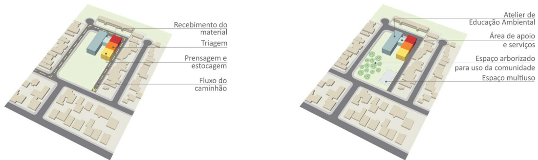
Figura 2 - Diagrama de funcionamento da Unidade e dos usos complementares.

Já no espaço aberto (Figura 3), é proposta uma ampla área arborizada que abrigará uma praça infantil, espaços de permanência e atividades de lazer. Outro espaço proposto é o multiuso, que poderá receber feiras para a venda de produtos alimentares cultivados pelas famílias, artesanato, brechós, food trucks , entre outras, que estimulem a economia local, exposição e venda dos trabalhos realizados nos workshops, eventos e apresentações. Esta proposta atende a carência do bairro em relação a espaços abertos para lazer e convivência social. Nesse sentido, Lynch (1980) argumenta que a adequada concepção e correta implantação de espaços públicos abertos influencia na qualidade das relações de vizinhança e da interação social, pois é nesses espaços que os processos cotidianos se desenvolvem. Ainda, autores (GEHL, 2015; GEHL, 2017; JACOBS, 2000) argumentam que a integração e interação social desenvolvida no espaço público pelos diferentes agentes fortalece as relações sociais e o sentimento de pertencimento ao local, o que pode ter implicações positivas para a apropriação e manutenção dos espaços públicos abertos, afetando positivamente a percepção de segurança e, conseqüentemente, a vitalidade urbana.