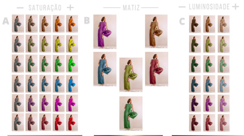
Figura 1: Objetos utilizados no survey.

A variável dessa pesquisa se encontra em testar somente a influência dos atributos da cor a partir do artefato selecionado na sua semântica de sustentabilidade, visto que o fundo, a forma, a textura e os demais elementos da linguagem visual dos produtos de moda permaneceram os mesmos. Enquanto objeto de estudo, selecionou-se um produto de vestuário do website de uma marca brasileira de slow fashion , a Brisa Slow fashion , alterando no photoshop suas propriedades referentes à cor (Figura 1).