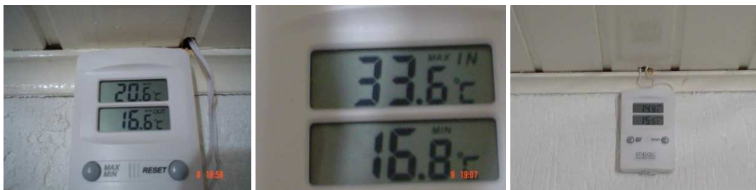
Figura 6 – Termômetro digital fixado na parede com medidas de água quente e fria.

A temperatura foi registrada através de um termômetro digital, representado pela figura 6, foram medidos todos os dias no final da tarde, no horário das 18h30min de setembro a outubro de 2008. Registrar-se-á cada dia que não se utilizou a energia elétrica durante o banho.