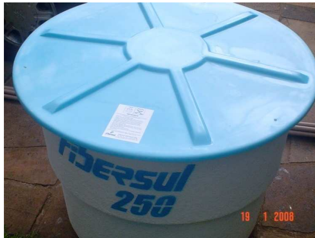
Figura 2 – Reservatório de 250 litros.

A tubulação hidráulica utilizada na construção do sistema de aquecimento de água por energia solar consiste-se de 20 mm, o qual é representado na figura 3.