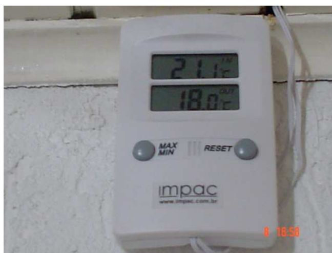
Figura 4 – Termômetro digital.

A instalação do registro de água quente ficará por fora da parede, ligada diretamente na ducha que já se encontra instalada com a água fria, será feito um furo no teto por onde passará a tubulação hidráulica, representado pela figura 6.