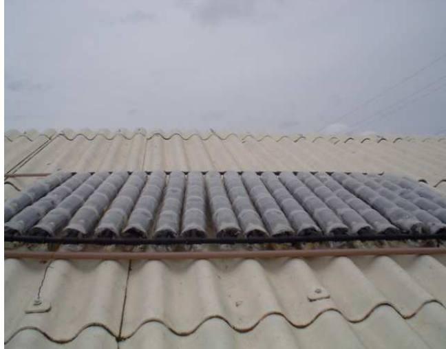
Figura 1 - Coletor solar instalado no telhado da casa.

Na instalação do reservatório de água se usou uma caixa de fibra de 250 litros, colocada no forro da casa, conforme a figura 2.