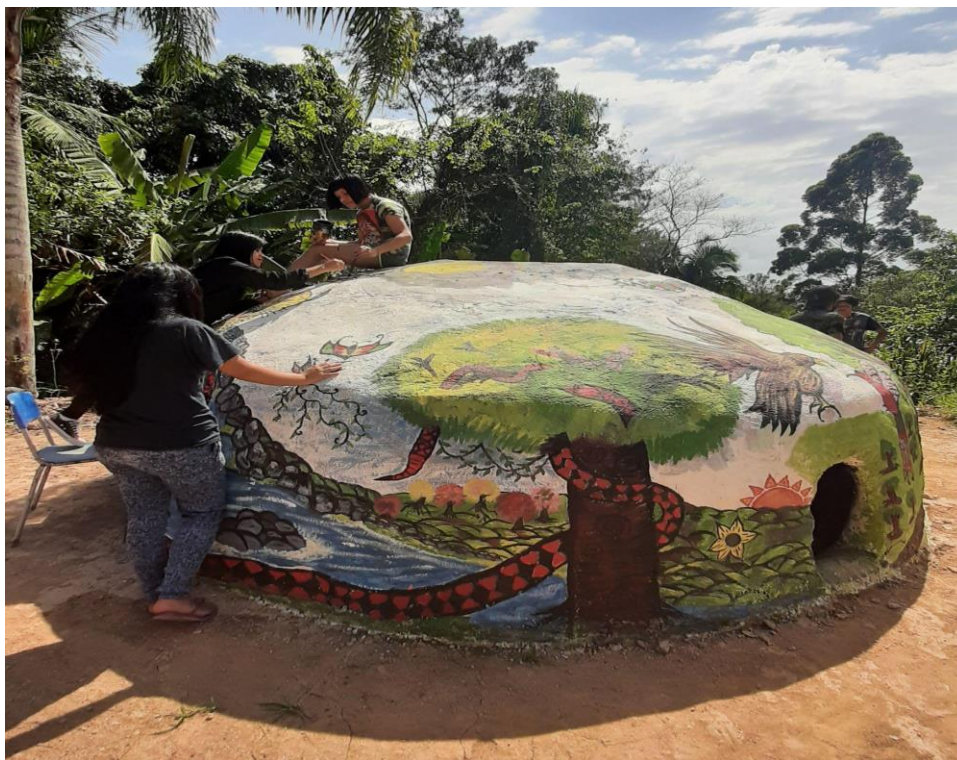
Figura 13. Pintura da Opy Djere