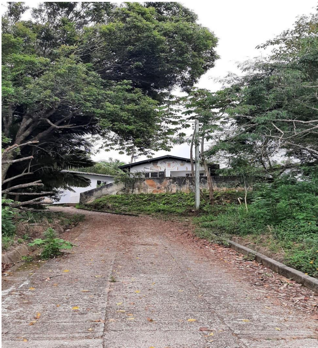
Figura 10. Fachada da escola de Educação Básica Wherá Tupã Poty Djá