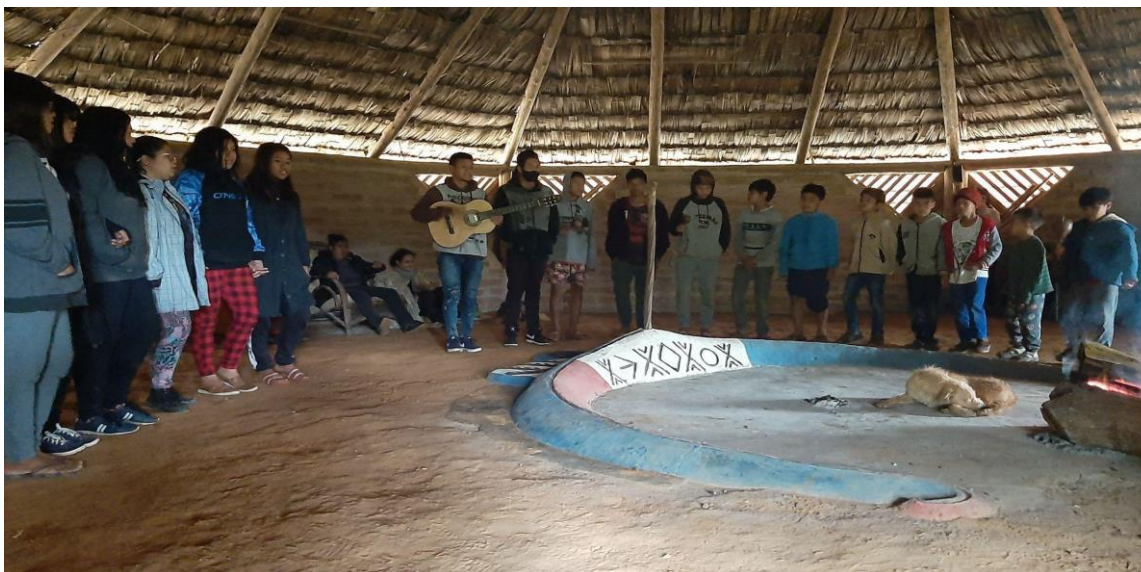
Figura 9. Apresentação do Coral Guarani após a contação de histórias na Opy