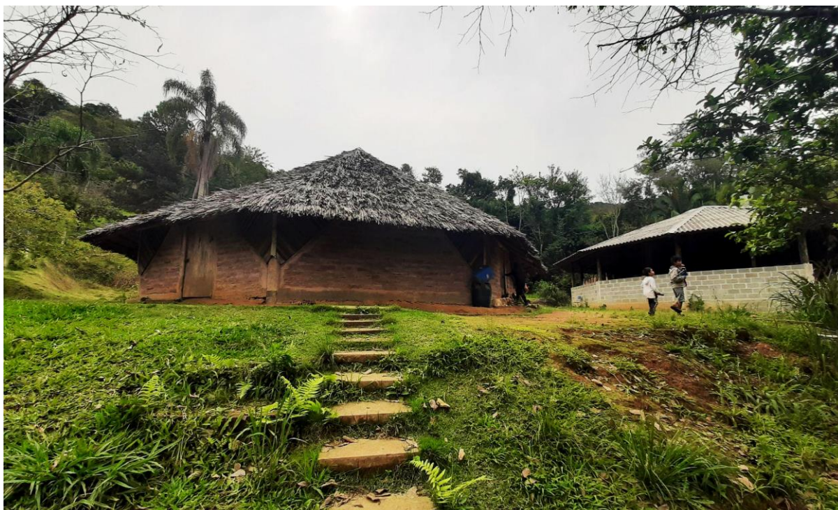
Figura 5: Opy (Casa de Reza)