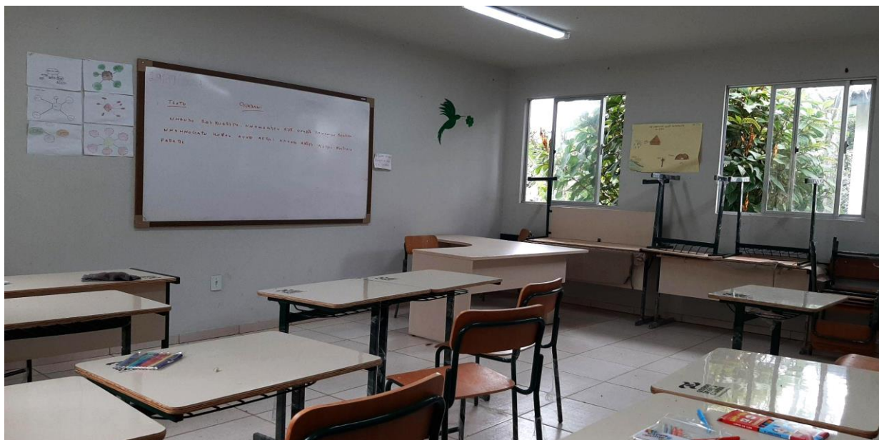
Figura 4: Sala de aula da escola Educação Básica Wherá Tupã Poty Djá