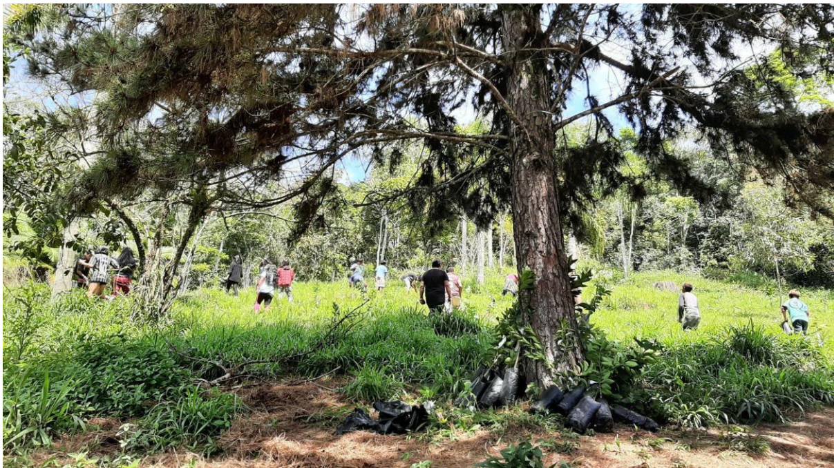
Figura 11. Atividade de plantio de árvores frutíferas