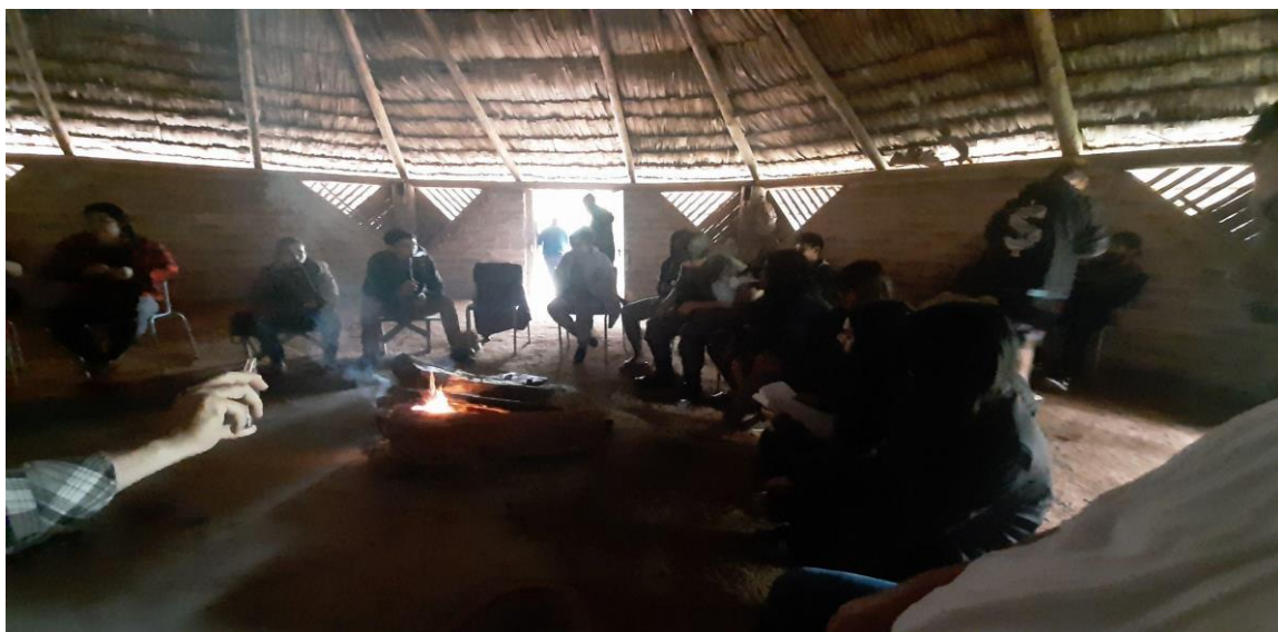
Figura 8. Lançamento do Livro de Contos Guarani dentro da Opy