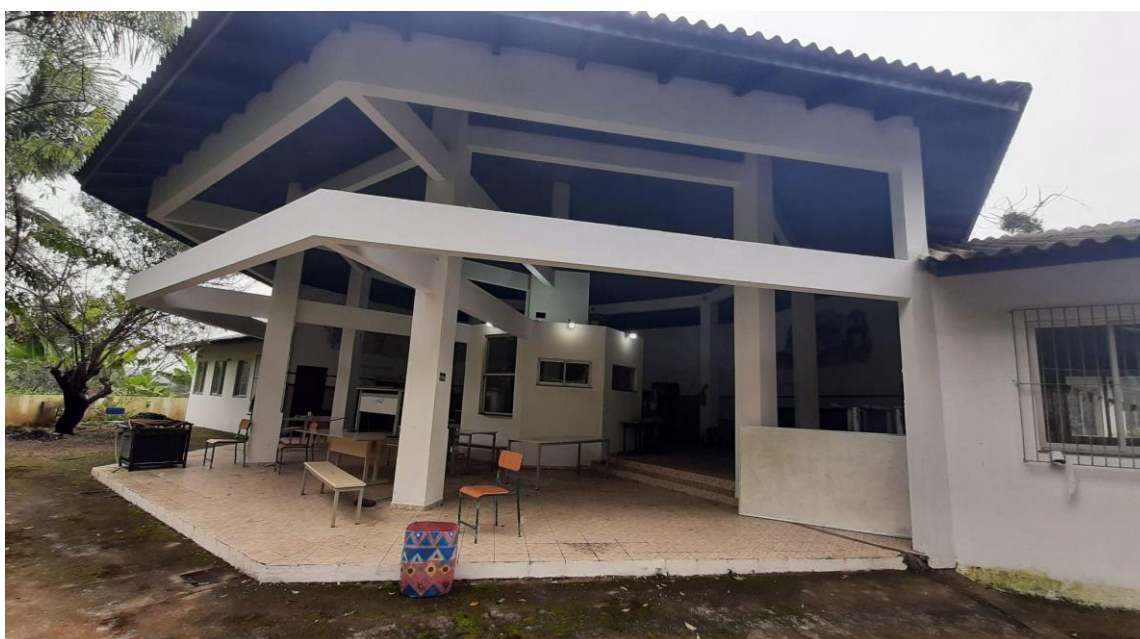
Figura 2: Escola Indígena de Educação Básica Wherá Tupã Poty Djá