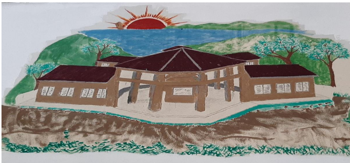
Figura 3: Ilustração da Escola Indígena de Educação Básica Wherá Tupã Poty Djá

Fonte: Desenho feito nas paredes na escola de autoria do senhor Milton Moreira, primeiro professor da escola. Foto registrada por Marcela de Liz.