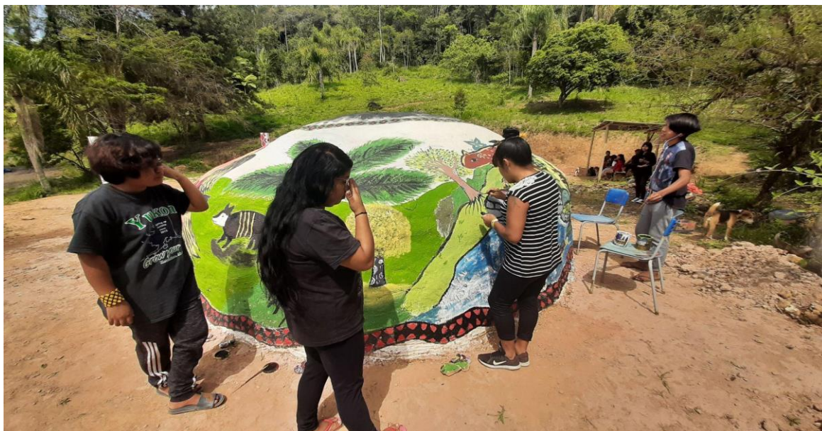
Figura 12. Pintura da Opy Djere