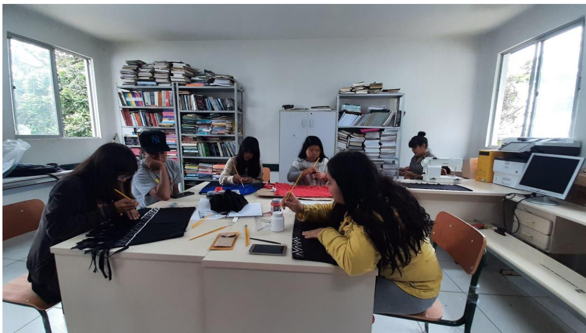
Figura 14. Confeção dos vestidos de formatura com pinturas tradicionais da Cosmovisão Guarani.