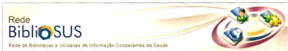
FIGURA 3 – BIBLIOSUS

o espaço físico, com a instalação de piso tátil e balcão de atendimento voltados às necessidades das pessoas com deficiência. Também se trabalha na adequação da BVS MS aos critérios de acessibilidade definidos pela legislação brasileira e na instalação de equipamentos específicos para auxiliar os deficientes visuais na leitura de documentos.