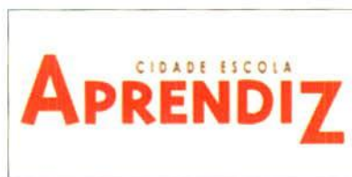
FIGURA 1 - ASSOCIAÇÃO APRENDIZ

é mostrar que é possível transformar o bairro em uma comunidade de aprendizagem quando viabilizamos os saberes das pessoas e os conectamos. Isso é o bairro-escola.