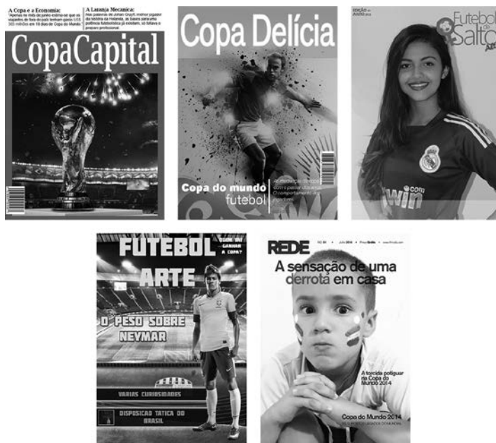
Figura 5 – Capas das revistas digitais IFRN – Campus Parnamirim