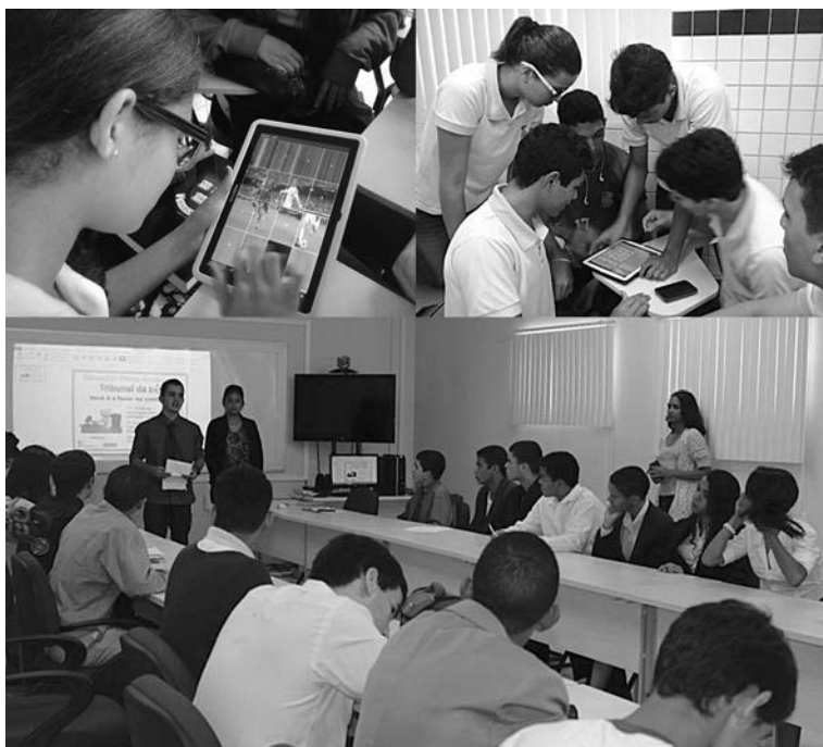
Figura 1 – Experimentando mídias nas aulas de Educação Física – Consumo e circulação