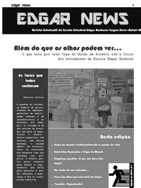
Figura 4 – Capa do jornal impresso

O segundo campo empírico de pesquisa situou-se no IFRN – Campus Parnamirim, em que o período de intervenção também aconteceu na primeira metade de 2014, acompanhando, em paralelo, os efeitos da aproximação dos jogos da Copa do Mundo de Futebol 2014 na cidade-sede Natal/RN.