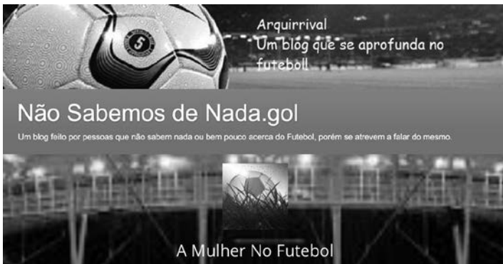
Figura 6 – Blogs do IFRN – Campus Parnamirim

No intuito de ratificar o processo ensino-aprendizagem, esclarecemos que os produtos resultantes das intervenções revelam o rigor metodológico e a coerência com que os sujeitos pesquisadores, envolvidos no processo, executaram seu plano de trabalho e envolveram os alunos na organização que se estabeleceu. Nesta perspectiva, edificaram os primeiros relatos da utilização da Mídia-Educação com as adaptações sugeridas pela nossa investigação.