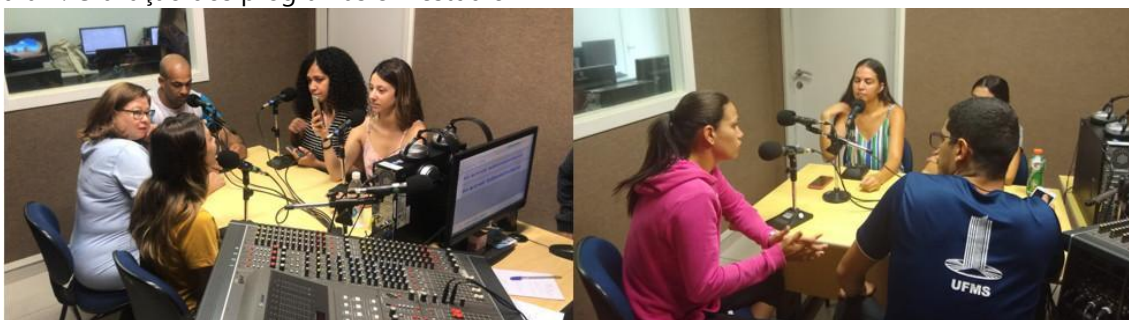
Figura 2: Gravação dos programas em estúdio

Após as tarefas de apuração e de contato com as fontes, os estudantes passaram para a construção dos roteiros, também sob supervisão dirigida dos professores de Jornalismo e de Educação Física. A aprovação dos roteiros foi a última etapa antes dos exercícios laboratoriais de gravação e edição dos podcasts.