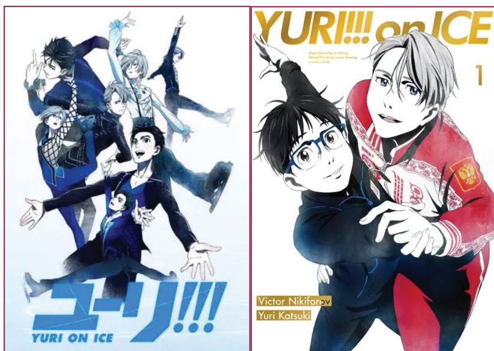
Figura 3 – Yuri!!! On Ice