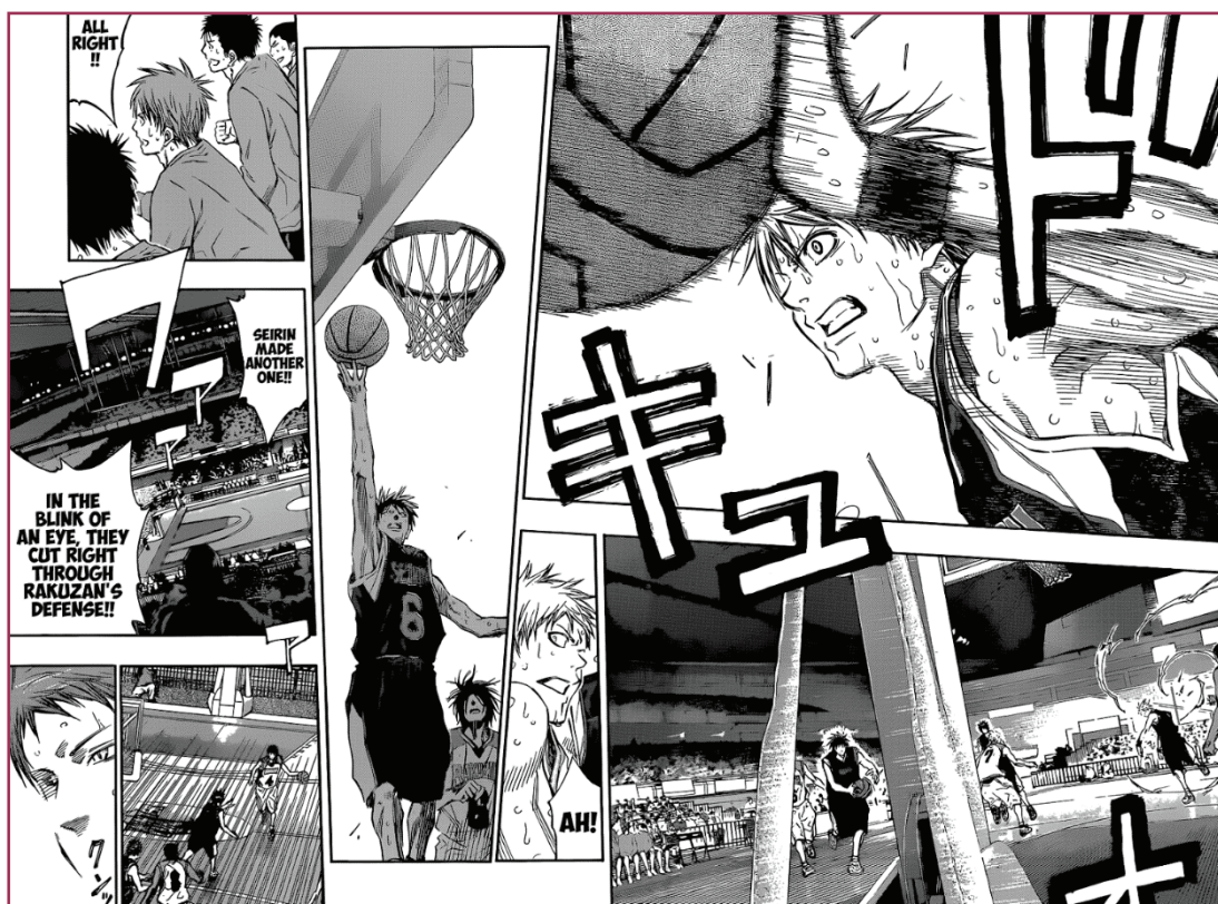
Figura 2 – Kuroko no Basket 16

e a plena manifestação das destrezas de cada um, seja através de assistências precisas, seja mediante falas eloquentes e insights motivacionais (FIGURA 2). Vale lembrar que, mesmo diante do destaque dado à figura de Kagami, Kuroko é quem ocupa (discretamente) o centro da história, podendo ser considerado como uma personificação da visão de mundo holística presente em boa parte das culturas orientais: as partes em plena e perpétua harmonia com o sistema (o todo). Em muitas situações, isso se reflete num entendimento comunitário acerca da subjetividade: “Mais do que focar em jogadores e heróis individuais, a escola que cada time representa assume o status de personagem” (INGULSRUD; ALLEN, 2009, p. 10, tradução minha). Nesse raciocínio, o verdadeiro protagonista de Kuroko no Basket seria, portanto, a equipe de Seirin High e não Kuroko ou Kagami.