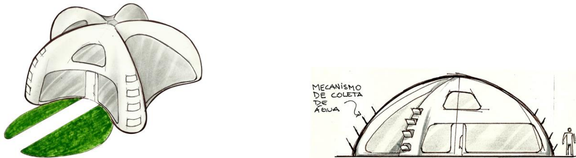
Figura 1: Conceito de residência. Fonte: AGUIAR (2013)

Assim, verifica-se que a configuração estrutural proveniente das relações geométricas, o permite ter: uma estrutura resistente, no parâmetro de altura, favorecendo-o a combater as intempéries naturais e o aquecimento provocado pela incidência solar direta, dando margem a uma propriedade da Biônica, a termorregulação; a captação de água, também favorecida pelos espinhos e angulação de aproximadamente 72° entre nervuras formando verdadeiras calhas; bem como, sua ponta em forma de abóboda, considerada como uma das estruturas mais resistentes. Desta forma, pode-se atribuir que o mandacaru apresenta uma relação estrutural ao qual um projeto de uma residência não aqueça da mesma forma que as residências tradicionais (bases quadriláteras), e isto se dá por manter várias paredes sombreadas e poucas paredes que sofram incidência solar durante longo tempo, devido ao desenho baseado no mandacaru (estrela). Desta forma, pode ser associado também a, por exemplo, projetos de edificações urbanas, monumentais, assim como, produtos dos mais variados gêneros, como demonstra a Figura 1.