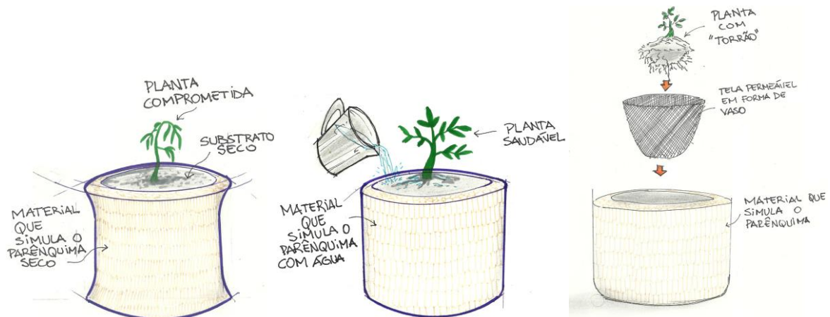
Figura 3: Conceito de vaso.

O conceito apresentado na Figura 3 se trata de um vaso de planta que tem a capacidade de indicar ao usuário que ele está necessitando de água. Haja vista que o parênquima tem a capacidade de flexibilidade de acordo com a quantidade de água que o mesmo apresenta (retenção), o vaso hidrófilo também carrega em si esta função.