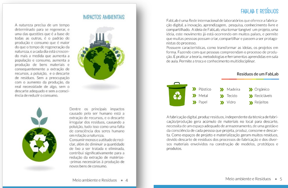
Figura 6: Fablab resíduos e impactos ambientais.

A cartilha começa introduzindo ao público-leitor do que será tratado ao longo das páginas. Na sessão do meio ambiente e resíduos são discutidos: os impactos ambientais, descrição do FabLab e os resíduos, além de, tópicos sobre a legislação de resíduos sólidos.