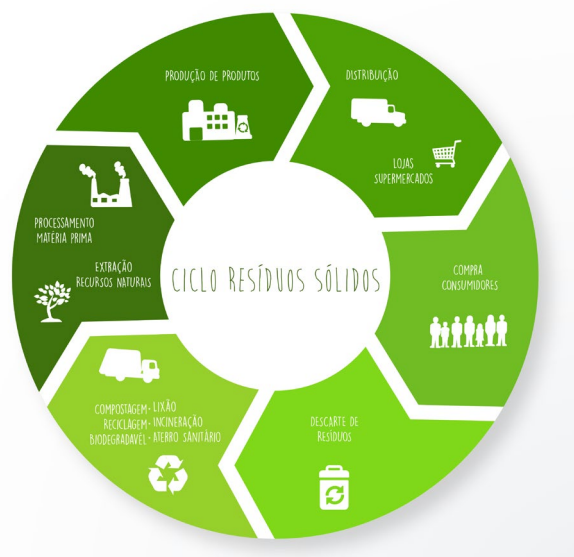
Figura 1: Ciclo de vida de um produto e geração de resíduos.

Considerando que em um FabLab se criam produtos, eles entram no ciclo de vida, onde temos as fases de: Produção, distribuição; o uso e o descarte. E cabe considerar nestes espaços os conhecimentos das fases de matéria prima utilizada e de processamento dos resíduos para que se busquem formas de redução na geração de resíduos sólidos e destinação adequada para reuso e reciclagem. Na figura 1, apresenta-se o ciclo de vida de produtos e a geração dos resíduos em cada fase.