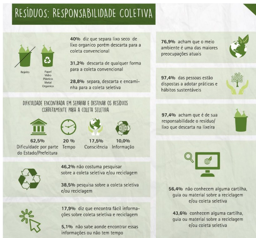
Figura 4: infográfico de pesquisa.

Para entender o comportamento dos usuários do laboratório foi feita uma pesquisa por meio de questionário online com alunos, bolsistas, professores, pessoas que frequentam o laboratório e público no geral, contendo 120 respostas, foi sintetizado em infográficos e na Figura 4 é apresentado um infográfico que foi realizado com base na pesquisa.