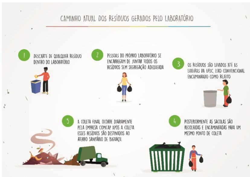
Figura 2: caminho atual dos resíduos gerados pelo laboratório.

Por exemplo para o PVC, teríamos que calcular o petróleo extraído e processado, o cloro acrescentado para a produção do polivinil clorado – rico em carcinógenos. Por outro lado, a ideia de sustentabilidade não se limita aos materiais, pelo contrário, começa com eles. O material reciclado exige uma tarefa de recuperação e outra de transformação que implica em consumo de energia e geração de resíduos. Apenas o “reciclado” da biosfera pode devolver o material consumido a seu estado inicial de recurso natural. A figura 2 mostra o caminho dos resíduos do laboratório.