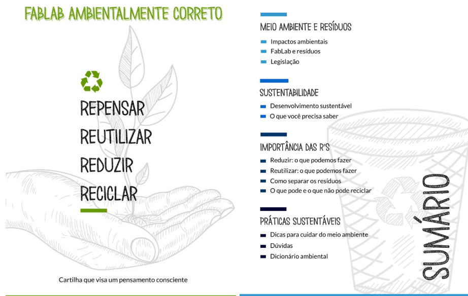
Figura 5: Capa da cartilha e sumário.

Foram definidos os requisitos de projeto em que foi decidido o tamanho A5, papel reciclado caso seja impresso, fonte ecofont e o número de pág. 18. As imagens da figura 5 mostram a capa com o nome que foi escolhido pela importância de ressaltar o tema, e as palavras das Rs que tem relação com o que será tratado na cartilha e o sumário. E as imagens da Figura 6 mostram o conteúdo das páginas 4 e 5.