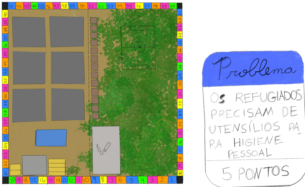
Figura 2: Demonstração de um protótipo do tabuleiro e carta respectivamente.

construção do tabuleiro e outros pontos importantes (figura 2).