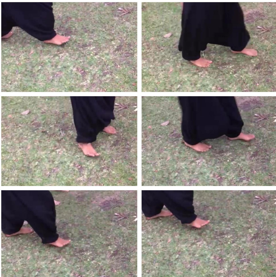
Figura 4: Pisada da Jade.

Integrante do coletivo Saia do Mar. Praça Central da UFSC, 04 de março de 2020, poucas semanas antes da pandemia da COVID-19 começar no Brasil. As imagens são frames sequenciais, marcando cada passo da pisada.