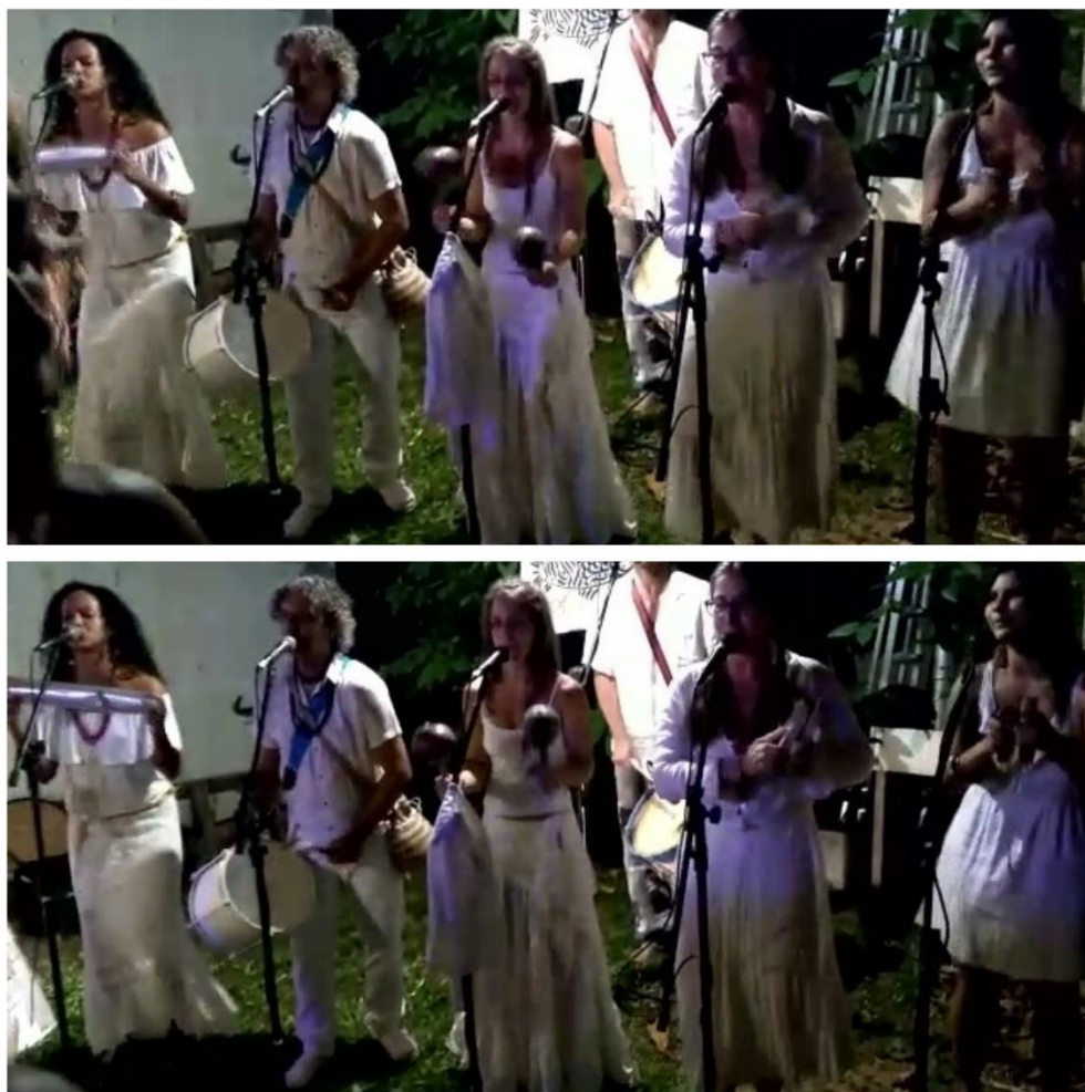
Figura 3: Coco de Toré Pandeiro do Mestre e colaboradoras (2).

Campeche, sul de Florianópolis. 2019. A sequência é composta de frames seguidos de um vídeo. Podemos notar as movimentações dos instrumentos nas duas imagens. Autoria do autor.