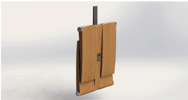
Figura 04: Projeto final - fechado

A figura 4 mostra como o produto fica fechado. Para mantê-lo fechado foi incluído um ímã de aço inoxidável.