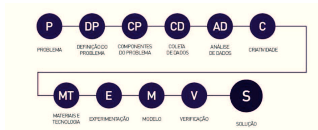
Figura 01: Método de Projeto utilizado

O objetivo principal deste trabalho foi desenvolver um banco com enfoque na sustentabilidade e versatilidade. O projeto previa que o banco tivesse um mecanismo de sustentação por faixas flexíveis tensionadas que lhe permitissem ser dobrável. O método de projeto escolhido foi de Munari (1998) e cumpriram-se todas as etapas mostradas na figura 1. O detalhamento de cada etapa pode ser observado em Coelho (2017).