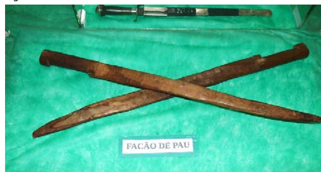
Figura 04: Facão de Pau – Artefato da cultura cabocla

Na figura 04 pode ser visualizado o facão de pau, artefato pertencente ao acervo do museu do Contestado em Caçador – SC.