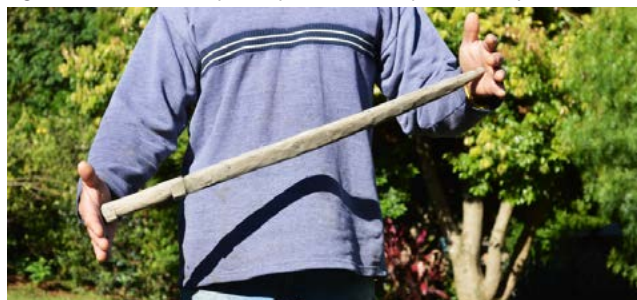
Figura 16: Dimensão do protótipo de facão de pau em relação ao usuário