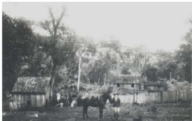
Figura 03: Casa em Faxinal dos Guedes-SC, na década de 1940.