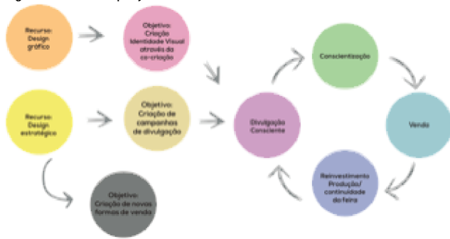
Figura 6: Ciclo do projeto e seus efeitos.