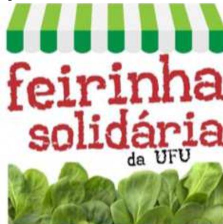
Figura 3: Logo atual da Feirinha Solidária da UFU