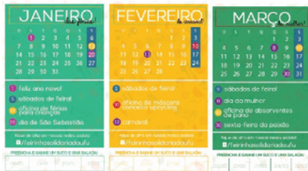
Figura 11: Calendário promocional de janeiro a março

Foram ainda esboçadas propostas de divulgação para as atividades a serem desenvolvidas dentro do calendário promocional, com o objetivo de dinamizar a Feirinha Solidária (fig. 12).