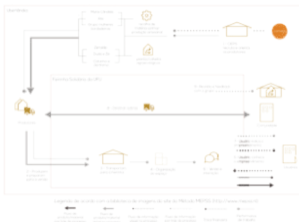
Figura 4: Identidade visual do empreendimento solidário

Segundo Brown (2010), o Design Thinking é uma abordagem que se posiciona entre a criatividade e o