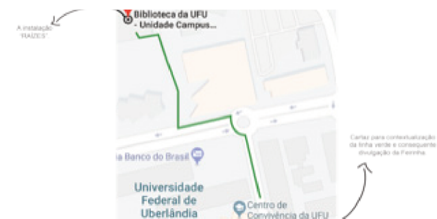
Figura 8: Relação entre Divulgação e Divulgado

A CrieCru (fig. 10) foi outra campanha proposta no âmbito da pesquisa para estimular novas formas de venda,