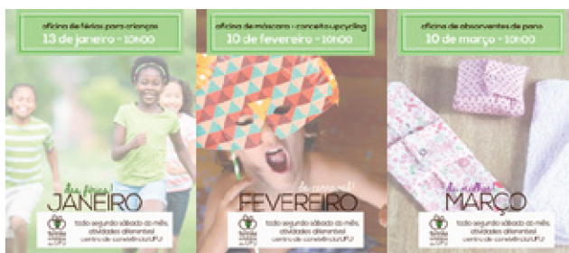
Figura 12: Proposta de divulgação das atividades