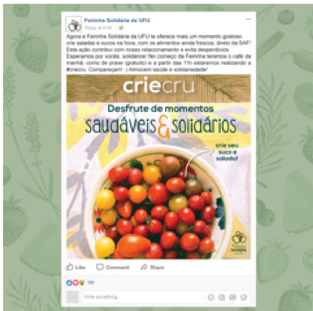
Figura 10: Proposta de divulgação da campanha “CRIECRU”