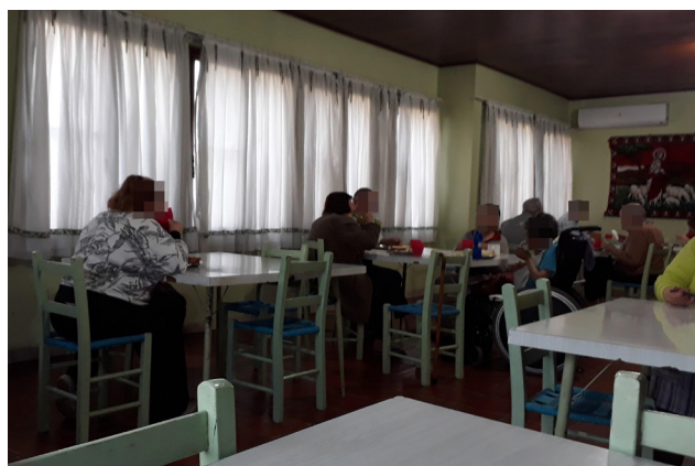
Figura 1: Foto tirada durante o almoço no refeitório dos idosos

das mesas destinadas às refeições está culminando em problemas de postura, bem como a logística entre o refeitório e a copa que tende a causar uma sobrecarga aos funcionários (Figura 1).