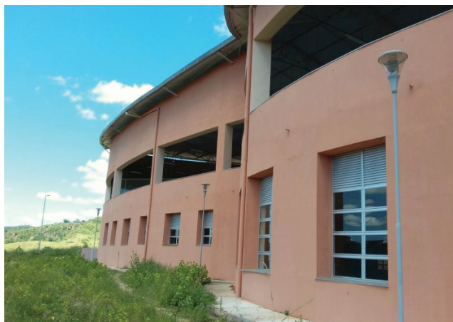
Figura 1 - Fachada noroeste do Restaurante Universitário

No programa Conforto MAIS, as fachadas são divididas em Fachada 01, 02, 03 e 04, sendo primordial a escolha da fachada real correspondente aquela para a simulação. Para o estudo, apenas uma fachada é considerada, sendo esta a Fachada 01 (Figura 1), correspondente à face nordeste (NO), pois apenas a mesma estará em contato com a envoltória externa da edificação.