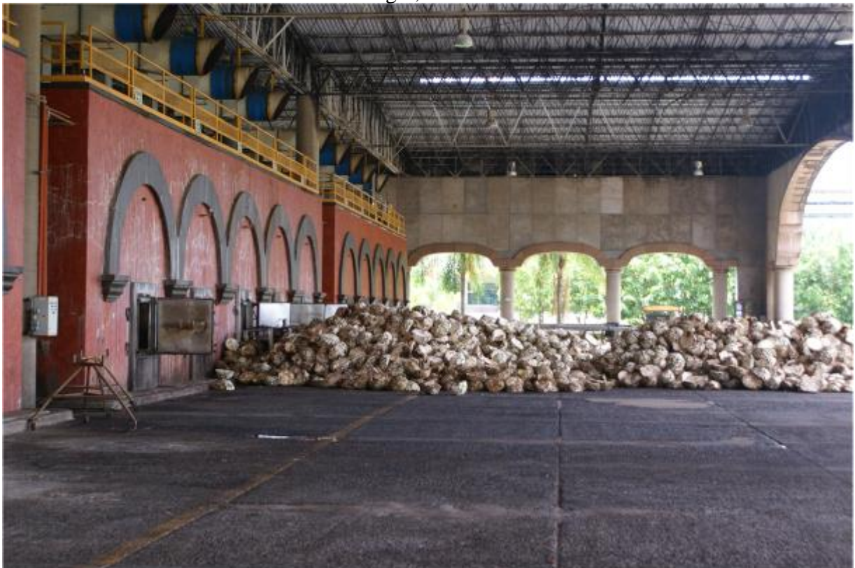
Figura 5 - Las ancestrales tabernas tequileras artesanales coexisten con las grandes destilerías industriales de alcance global. Destilería Casa Herradura en la hacienda de San José del Refugio, Amatitán