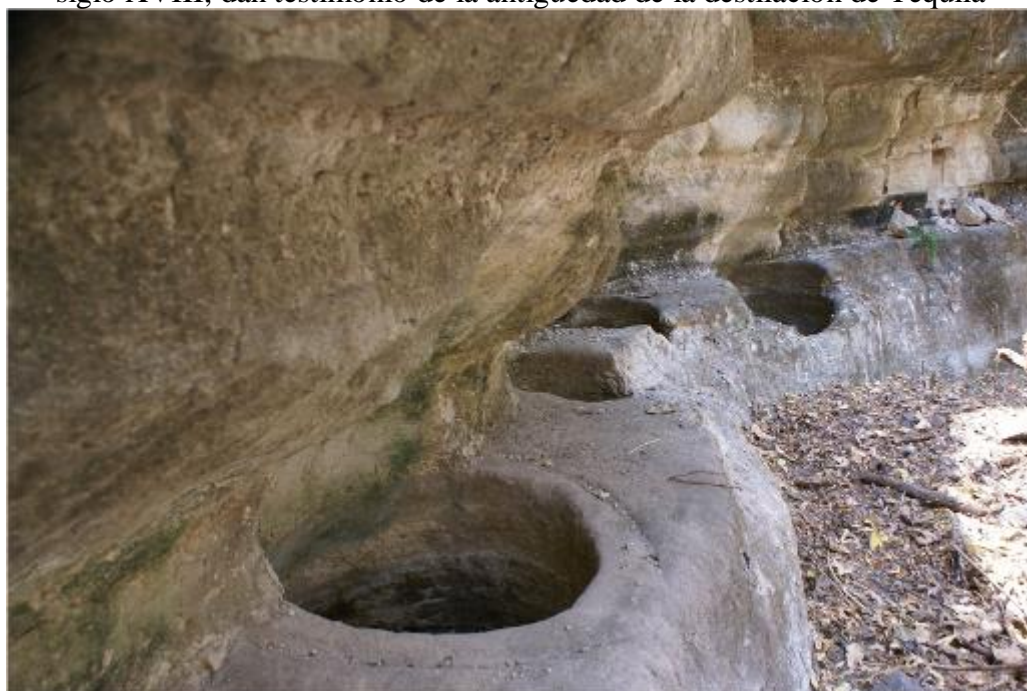
Figura 4 - Las pilas de fermento de mosto de mezcal localizadas en la taberna de El Calaboz en el municipio de Amatitán, posiblemente utilizadas durante el siglo XVIII, dan testimonio de la antigüedad de la destilación de Tequila