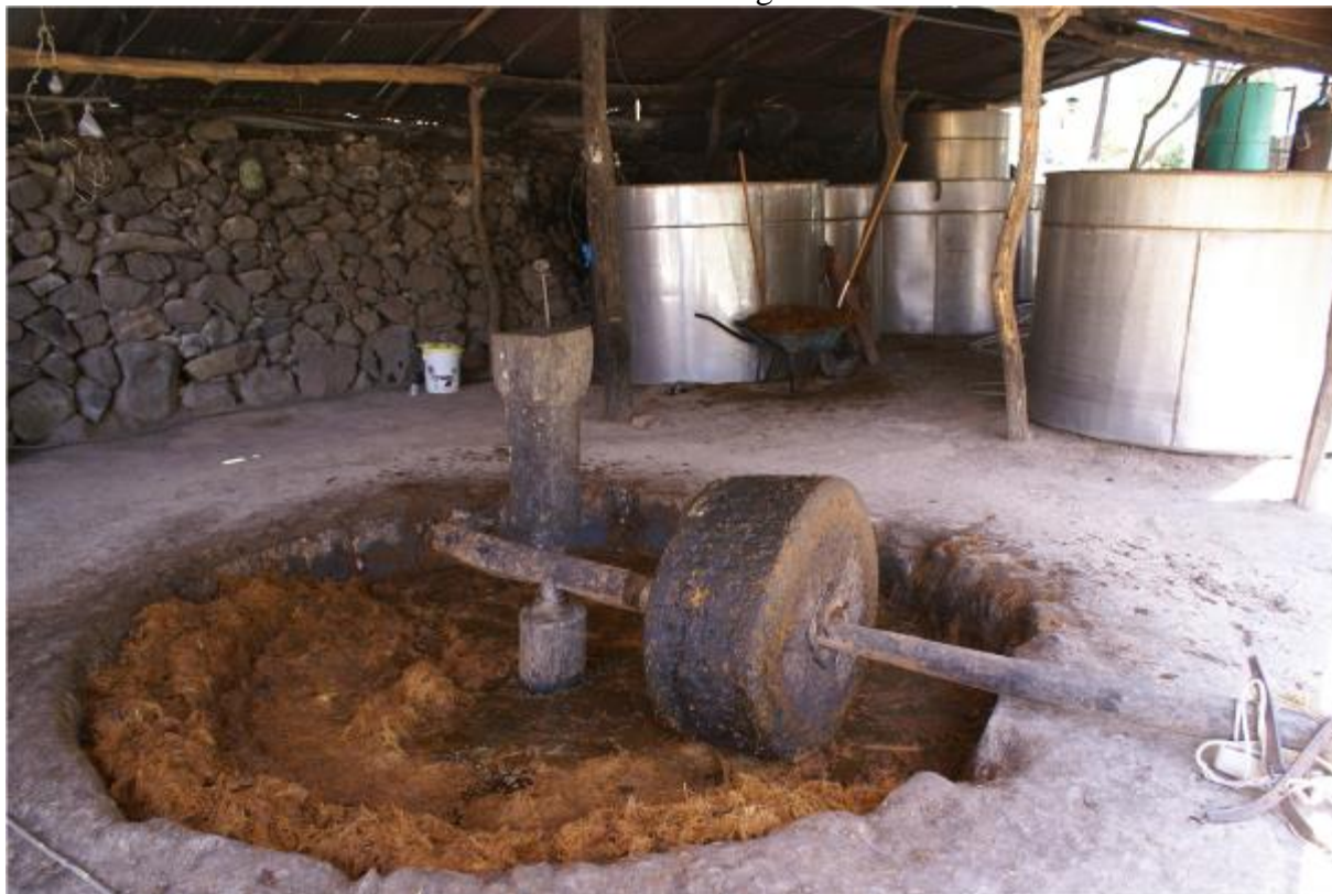
Figura 6 - La humilde taberna de Los Cardos, en la sierra de Tequila es un ejemplo de la pervivencia de las tradiciones ancestrales en la elaboración del vino de mezcal de Tequila. Patrimonio inmaterial de alta significación cultural