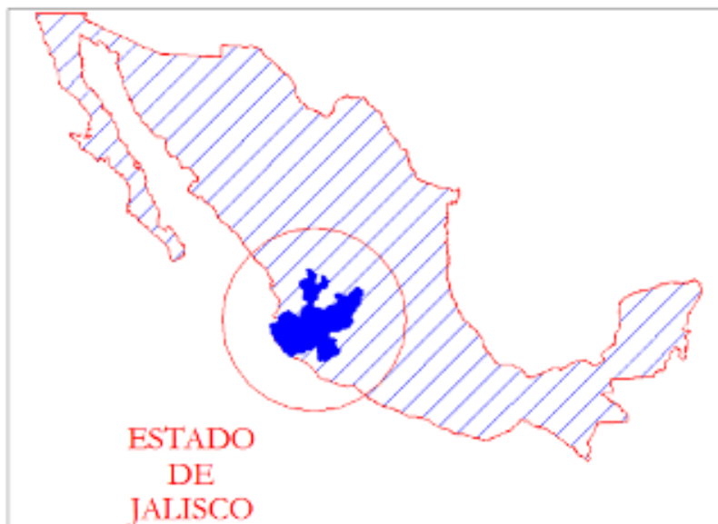
Figura 1- Localización del Estado de Jalisco en la República Mexicana