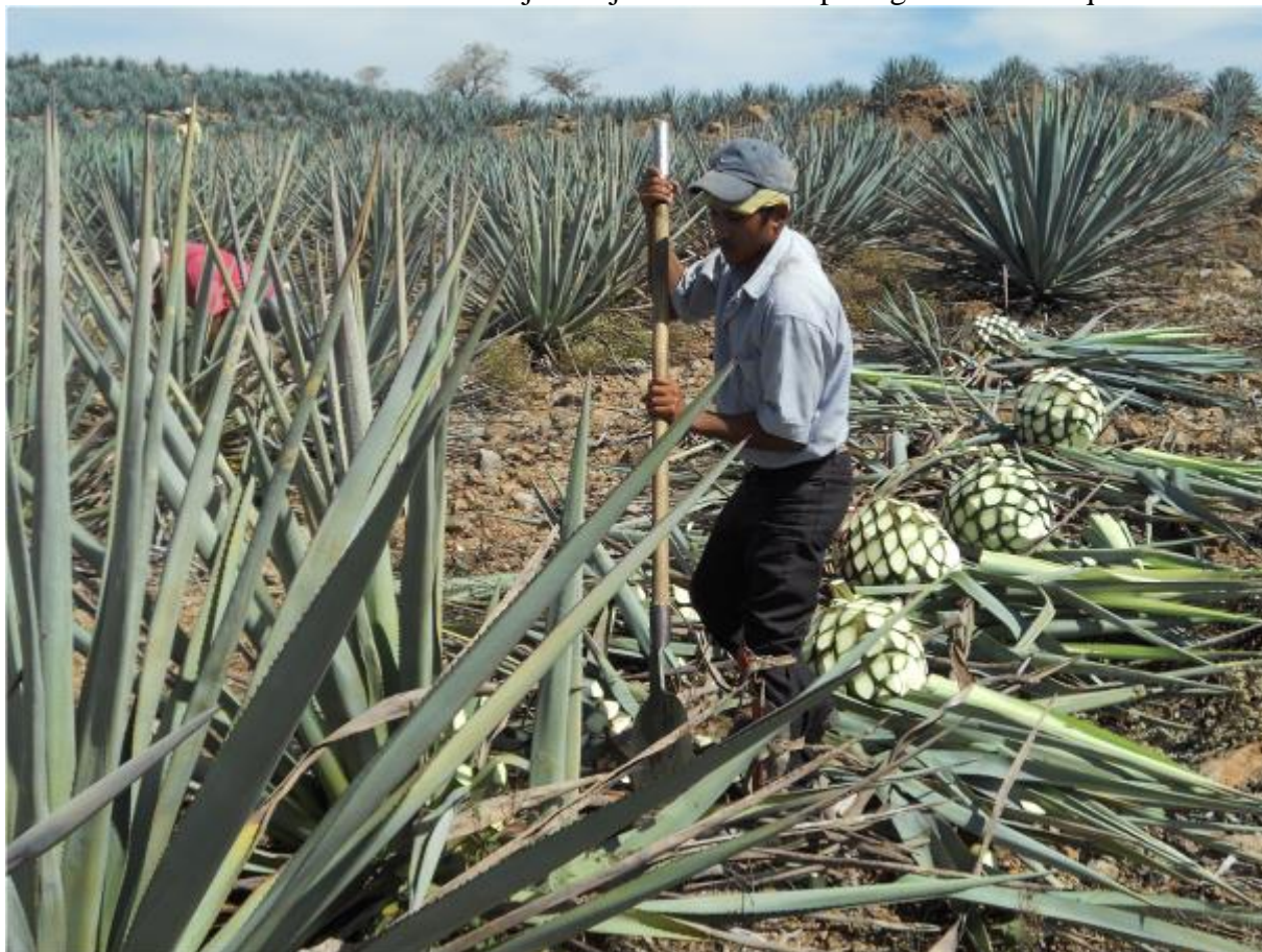
Figura 7 - El trabajo cotidiano por parte de los pobladores del territorio tequilero ha construido desde hace cuatro siglos este valioso paisaje cultural y es el que debe permitir su sostenibilidad a futuro. Trabajos de jima en los campos agaveros de Tequila