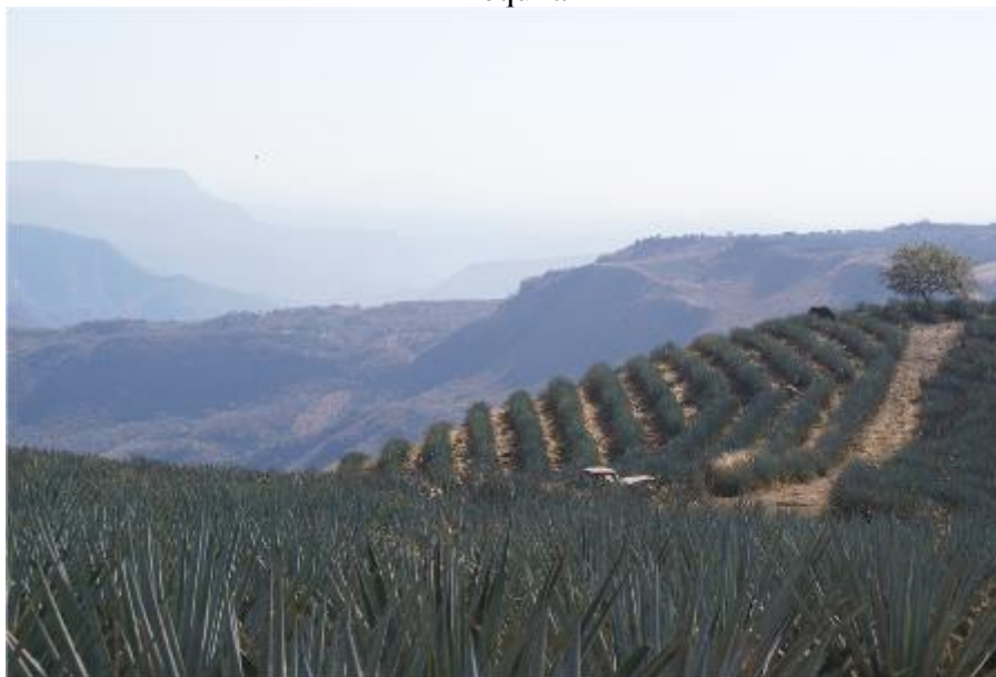
Figura 3 - Aspecto actual de las plantaciones de Agave Tequilana Weber, variedad Azul que definen la imagen del paisaje agavero de Tequila