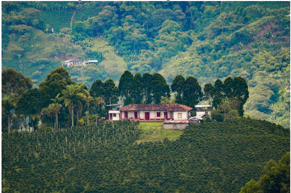
Figura 4: Finca cafetera en Aguadas, Caldas