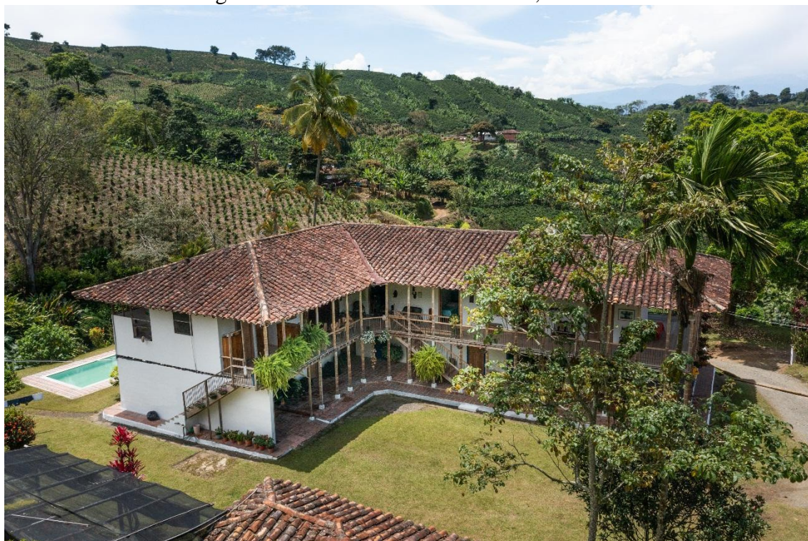
Figura 2: Finca Cafetera en Palestina, Caldas