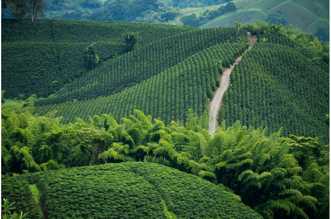
Figura 3: Paisaje cafetero en Chinchiná, Caldas