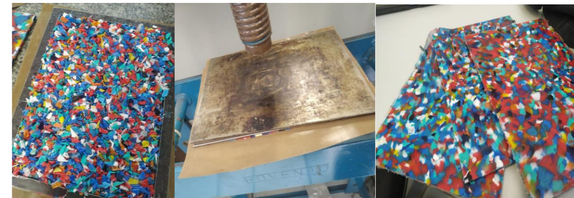
Figura 3, 4 e 5: composição de chapas, resíduos e manta; conjunto na prensa hidráulica e chapas de PEAD.

Tendo essas partes prontas os resíduos moídos foram colocados em um Becker e pesados para que todas as chapas tivessem o mesmo peso, a partir disso foi montada a primeira chapa inteira, por cima uma manta de Teflon, depois a chapa recortada e dentro os resíduos distribuídos, em cima outra manta de Teflon e outra chapa inteira (figura 3), essa composição foi levada à prensa hidráulica térmica pré aquecida a 180° e foi prensada a 4 mil toneladas por 10 minutos (figura 4), após isso foi retirado da prensa e colocado em um balcão para resfriar por mais 10 minutos, então a chapa estava pronta para ser retirada e o processo foi repetido mais 5 vezes, totalizando em 6 chapas de polímero (figura 5).