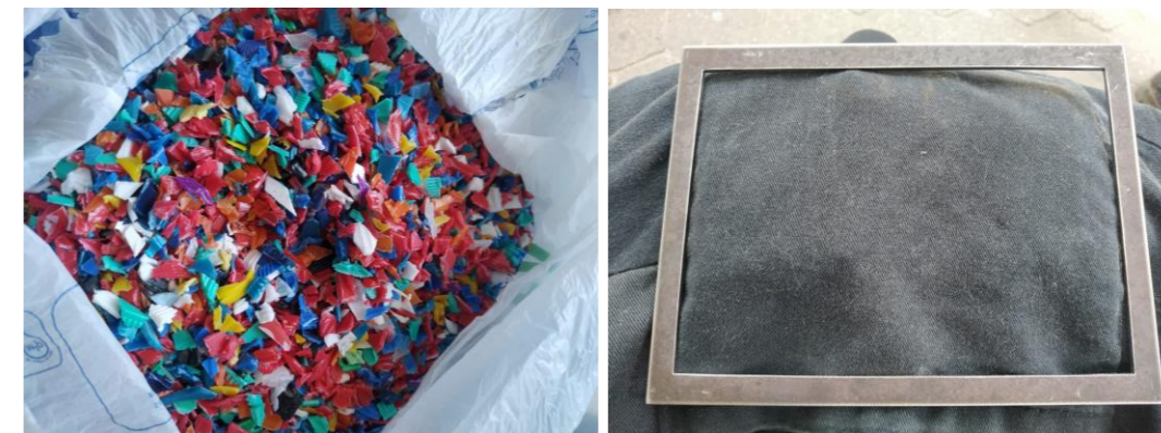
Figura 1 e 2: resíduos moídos e molde de metal.

O segundo passo foi construir duas chapas de metal inteiras de 200x180x3 mm e uma outra chapa de metal com as mesmas medidas, porém com um recorte retangular no meio de 160x140 mm (figura 2), sendo que nesse espaço seriam colocados os resíduos moídos para que se conformassem no mesmo formato e espessura do recorte.