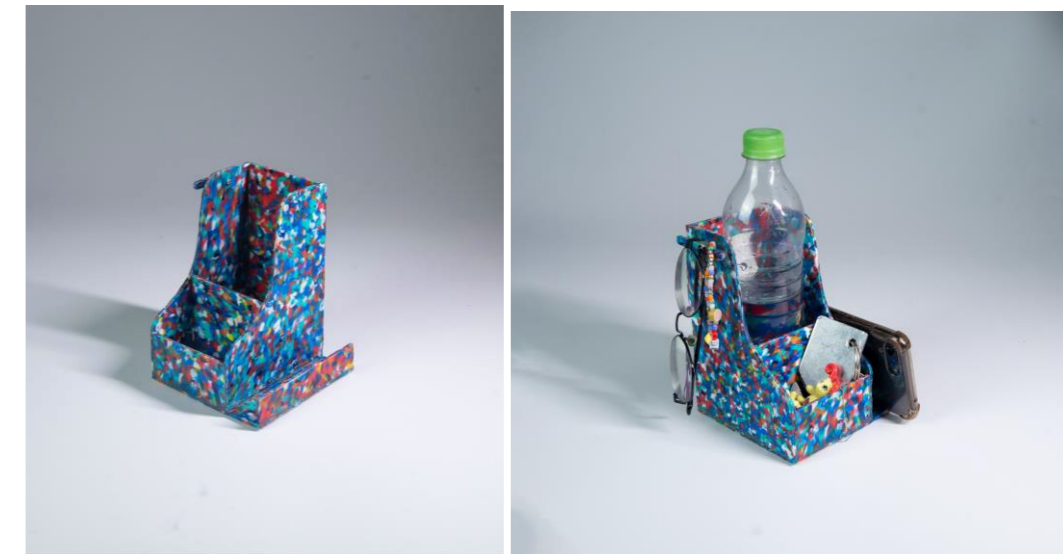
Figura 8 e 9: organizador finalizado e organizador com utensílios pessoais.

Por definição, os organizadores têm o objetivo exclusivo ou principal de manter a ordem de itens por meio de compartimentos de diferentes tamanhos e acelerar o seu processo de busca. Dado isso, o produto final mostrado na Figura 8 e 9 apresenta uma configuração e estética inédita, visto que o material não se encontra facilmente no mercado e por apresentar compartimentos ideais para o ambiente e as necessidades que foram identificadas pelos usuários.