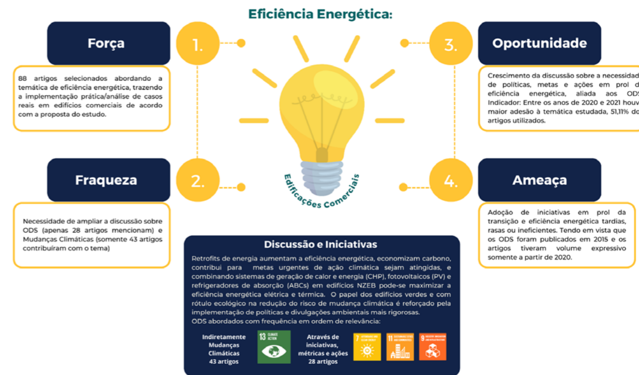
Figura 2. Análise SWOT dos Resultados do Levantamento

Nota-se que a maioria dos artigos com conexão com os ODS foram publicados a partir do ano 2017 e ao longo dos anos houve maior aprofundamento à temática e suas interrelações. Entre os anos de 2020 e 2021 houve maior adesão à temática estudada, 51,11% dos artigos utilizados neste estudo estão relacionados com a Agenda 2030 e/ou mudanças climáticas no intervalo de tempo de dois anos. Além disso, os resultados da análise dos artigos acima e suas conexões com a temática das mudanças climáticas, indicaram que apenas dois deles (4,44%) não abordaram o tema de mudanças climáticas e a contribuição do estudo para a ação climática) os outros quarenta e três (95,56%) mencionaram ou abordaram o termo de forma geral. Em relação ao ODS 7, 60% dos artigos mencionaram-no direta ou indiretamente em suas discussões e conclusões. Contudo, quanto aos ODS 9 e 11, apenas um artigo relaciona de forma mais direta as metas relacionadas a estes objetivos. Observa-se que apesar da temática “Eficiência Energética” estar atrelada a mais de um dos ODS, o sétimo objetivo ainda é o mais representativo nas análises e menções nos trabalhos.