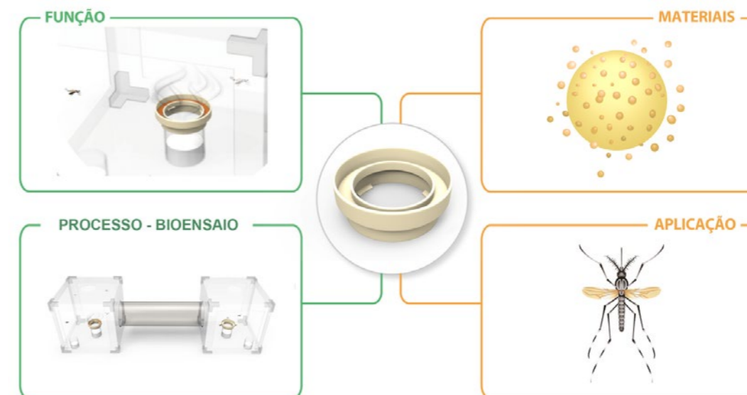
Figura 2: Resumo gráfico da utilização do dispositivo.

A Figura 2 retrata um resumo gráfico da utilização do dispositivo (Figura 1) em bioensaios com mosquitos.