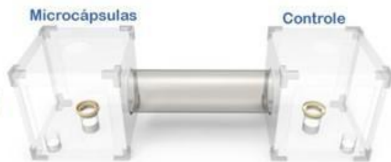
Figura 3 – Gaiolas, bioensaio com preferência de escolha.

Para os bioensaios de preferência de oviposição foram utilizadas duas gaiolas (20x20x20cm) conectadas por um duto em acetato transparente (desenvolvidos para este ensaio), com 0,70 mm de espessura, 30 cm de comprimento e 10 cm de diâmetro, denominado “CONFIGURAÇÃO APLICADA A/EM DISPOSITIVO DE CONEXÃO DE GAIOLAS PARA TESTES DE MATERIAIS EM BIOENSAIOS”, certificado de desenho industrial BR 30 2022 001454-0, Figura 3.