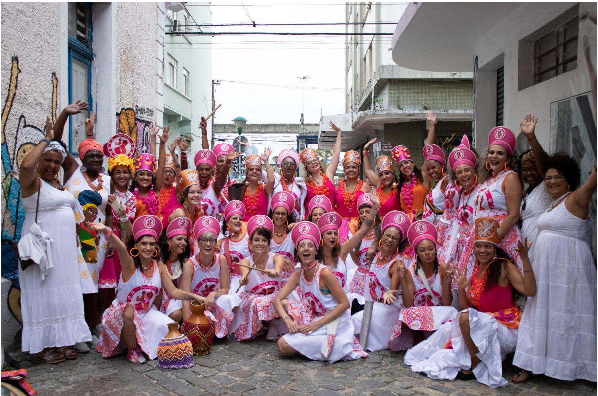
Figura 10. Fotografia do BMF antes da apresentação no dia 21/02/2020.