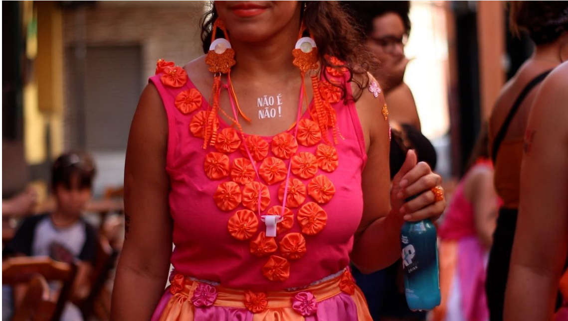
Figura 22. Integrante do coletivo na apresentação do dia 24/02/2020.

música - acompanhada de um discurso que valoriza o empoderamento feminino e a luta contra todos os tipos de opressão e racismo.