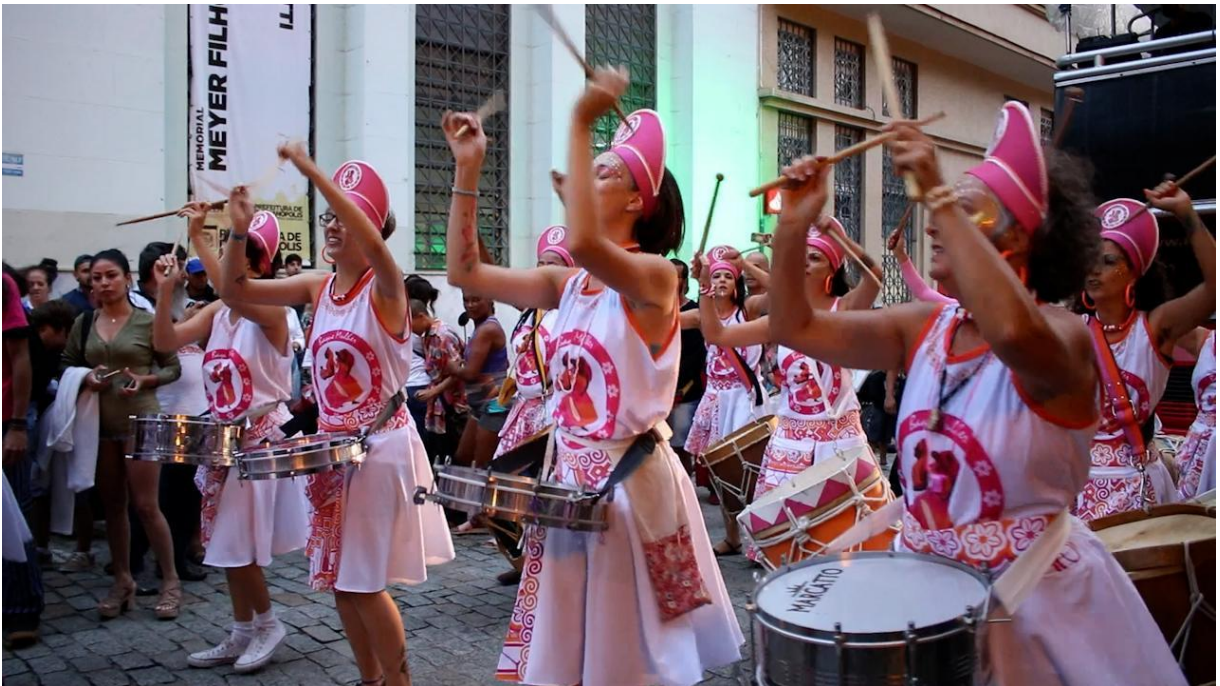
Figura 24. Integrantes do coletivo na apresentação do dia 21/02/2020.