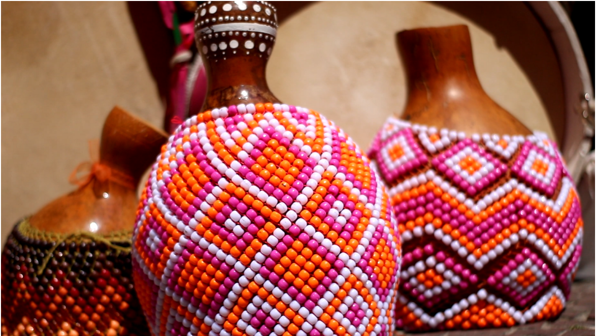
Figura 4. Agbês.