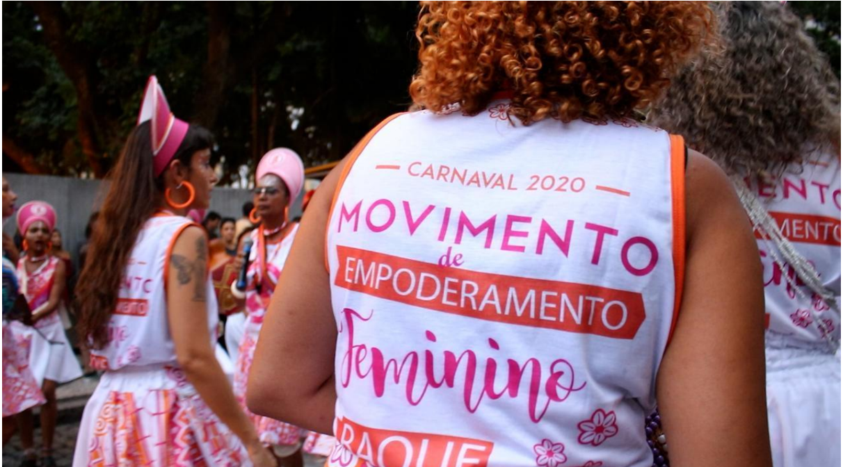
Figura 26. Integrantes do coletivo na apresentação do dia 21/02/2020.