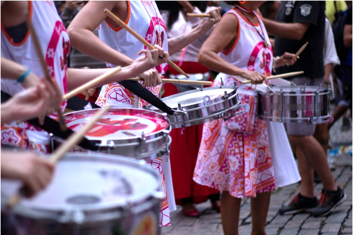
Figura 6. Caixas de guerra e taróis.