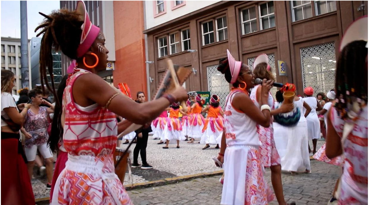
Figura 25. Integrantes do coletivo na apresentação do dia 21/02/2020.