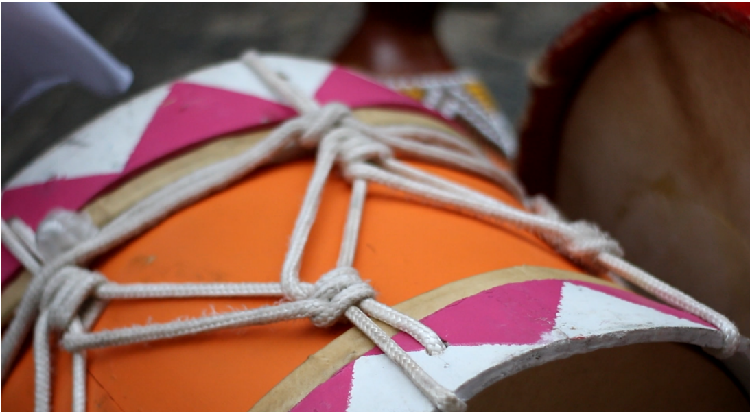
Figura 2. Alfaia.