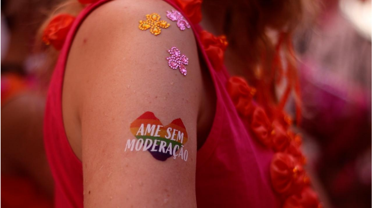
Figura 13. Detalhe de tatuagem temporária e brilhos.