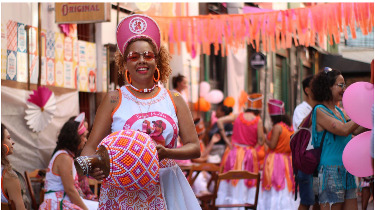
Figura 12. Tatiara em 24/02/2020.