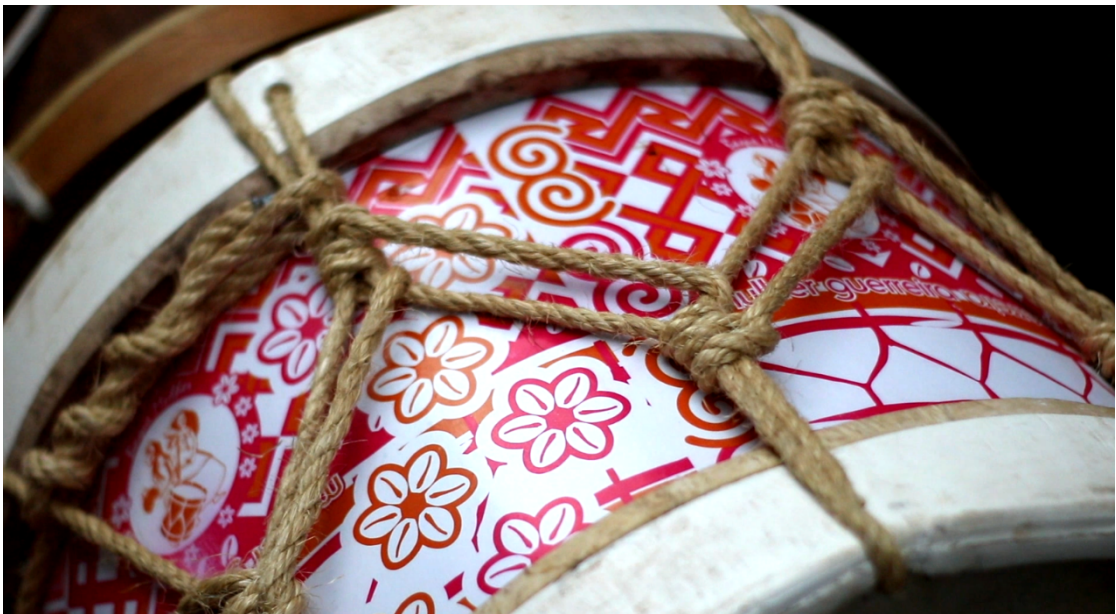
Figura 3. Alfaia.