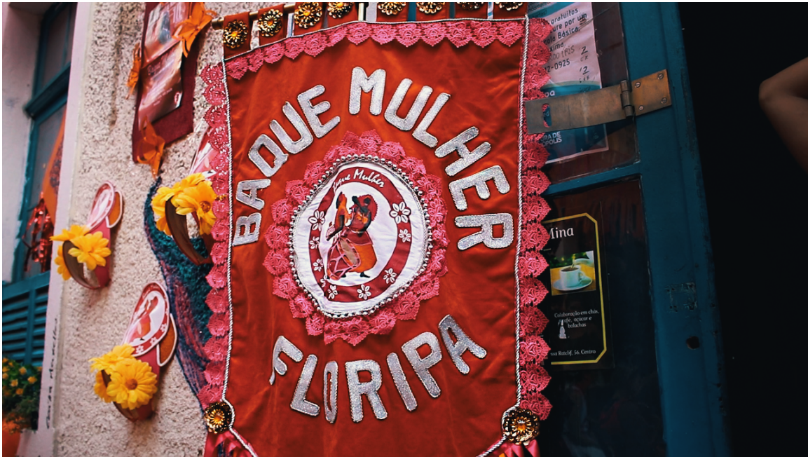
Figura 15. Estandarte.