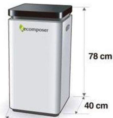
Figura 04: Composteira elétrica.