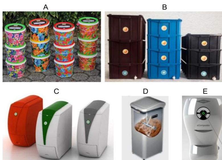
Figura 05: Composteiras domésticas.

Para as análises das alternativas já desenvolvidas dividiu-se em duas categorias; composteiras domésticas (Figura 05) e composteiras com hortas embutidas (Figura 06).