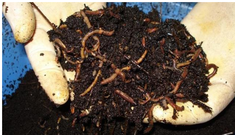
Figura 02: Vermicompostagem. Fonte: Futuramb, 2017.

A compostagem seca (Figura 03), diferente da vermicompostagem, não possui minhocas, sendo que o processo de transformação é realizado apenas pelos microorganismos presentes no solo. Nesse processo, também há a reciclagem da matéria orgânica, mas devido a não utilização de minhocas, o processo exige mais tempo para decompor a matéria.