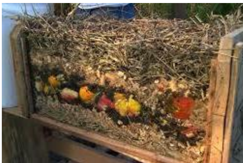
Figura 03: Compostagem seca.

A compostagem seca (Figura 03), diferente da vermicompostagem, não possui minhocas, sendo que o processo de transformação é realizado apenas pelos microorganismos presentes no solo. Nesse processo, também há a reciclagem da matéria orgânica, mas devido a não utilização de minhocas, o processo exige mais tempo para decompor a matéria.