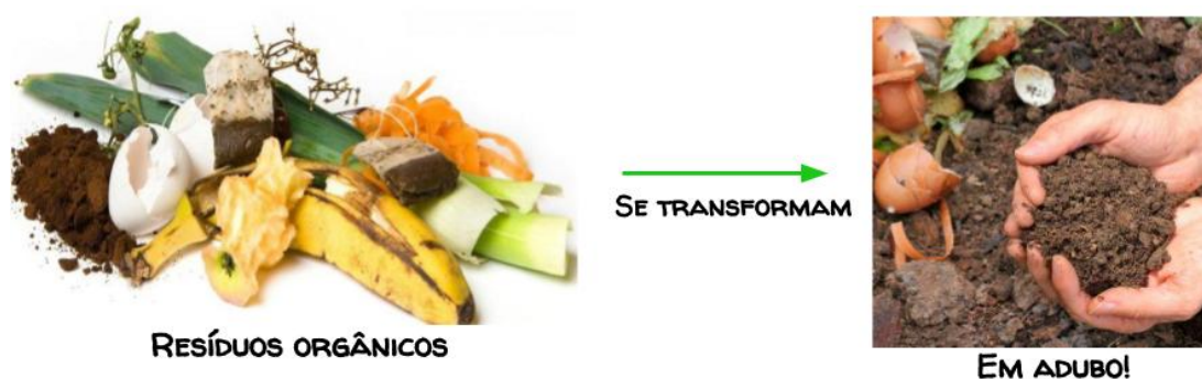
Figura 01: Resíduos e adubo.

Como resultado final da compostagem há um composto orgânico rico em nutrientes minerais (Figura 01), podendo ser utilizado como adubo em hortas e jardins e também na agricultura, o que substituiria a utilização de fertilizantes sintéticos.