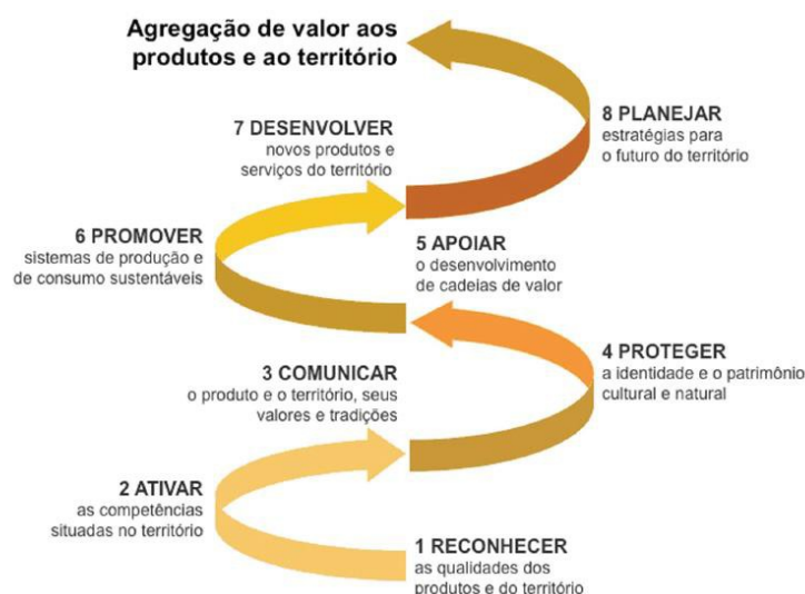
Figura 3: Possíveis contribuições do Design aos produtos locais e seus territórios.

No contexto do presente trabalho, entende-se que o produto de natureza regional, seja ele tangível ou intangível, é um importante fator na equação que considera as variáveis para a busca pelo desenvolvimento e, dessa forma, contribuir para a melhoria de modelos de negócio, direcionamentos gerenciais e a criação de ofertas que amplifiquem as qualidades de bem oriundo e/ou característico de uma região configura-se como uma alternativa interessante para geração de renda, visibilidade e desenvolvimento socioeconômico para o território. A Figura 3 mostra como o Design ser útil às regiões, sendo possível enxergar o papel potencial dos produtos locais nesse cenário.