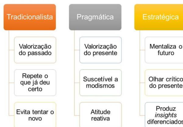
Figura 1: Atitudes Tradicionalista, Pragmática e Estratégica.

Esse modo de observar o contexto, costuma trazer insights diferenciados, que tornarão cada negócio distinto à sua maneira e dificultarão a destruição do seu valor, isso acontece pois mesmo que alguém resolva copiá-lo, ele será valorizado como “o original”. Além disso, copiar demanda tempo e investimento por parte do concorrente, o que também atrapalha o seu sucesso. A Figura 1 condensa as principais características de cada forma de agir.