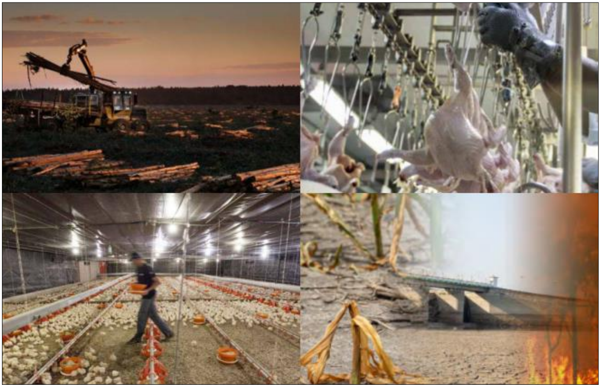
Figura 3 Características negativas retratadas nos relatos integrados das companhias