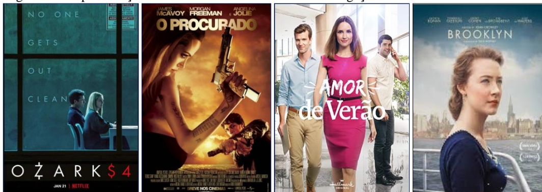
Figura 1: A representação dos contadores nos cartazes de divulgação midiática.