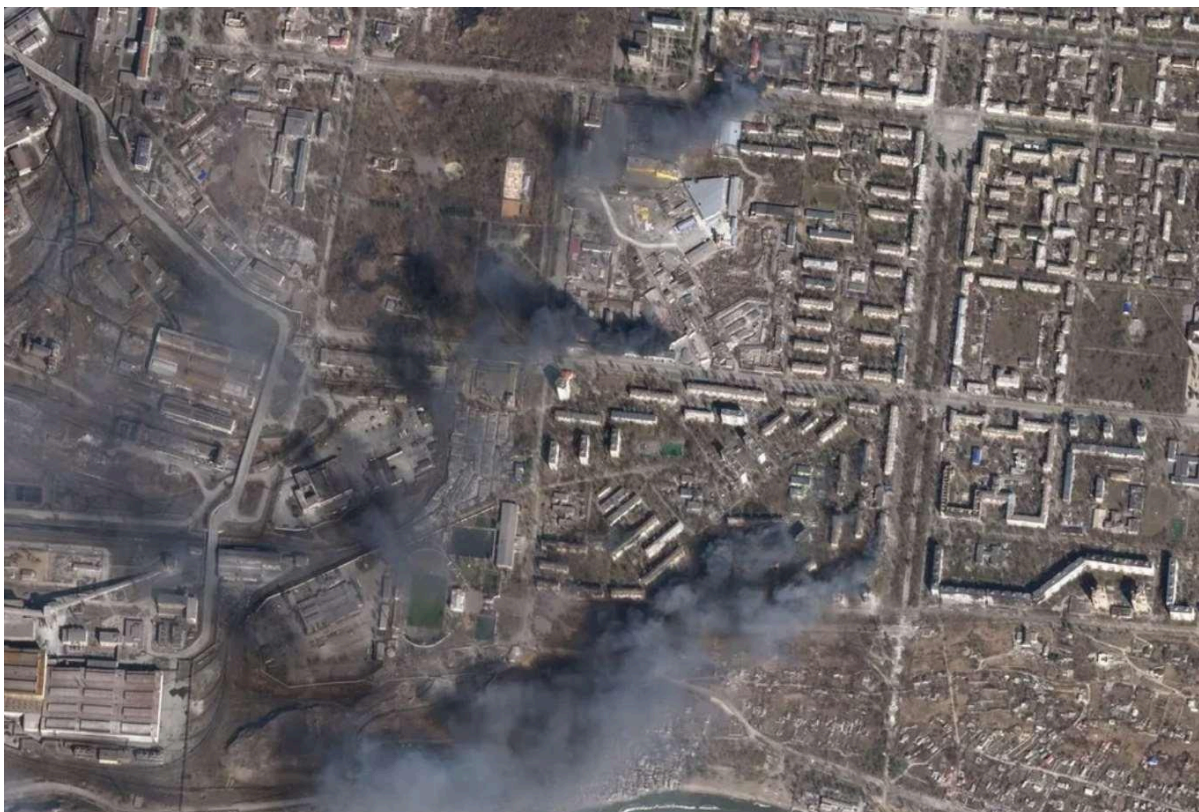
Figura 11: Imagem aérea da situação dos bombardeios em Mariupol no dia 20 de março de 2022.