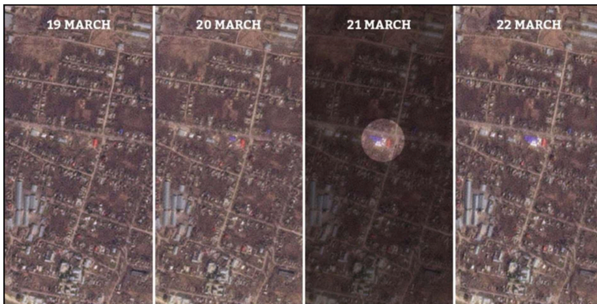
Figura 2: Imagens de Satélite mostrando a instalação do acampamento.

O campo de refugiados foi iniciado em 22 de março de 2022, mas as atividades já foram suspensas.