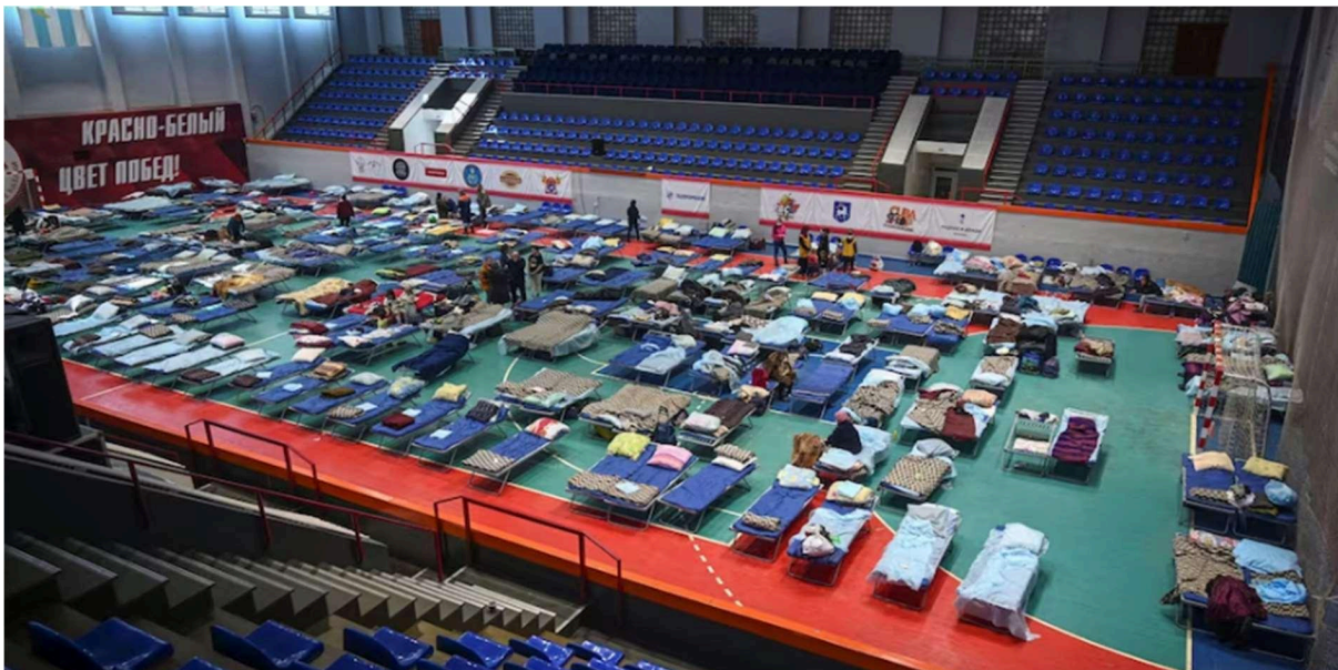
Figura 3: Abrigo temporário no ginásio de uma escola na vila de Bezimenne.

No início, as pessoas foram alocadas em uma escola do vilarejo, que está situada na costa do Mar de Azov. Segundo dados do Washington Post (2022), inicialmente não havia assistência médica disponível e os pertences pessoais eram confiscados.