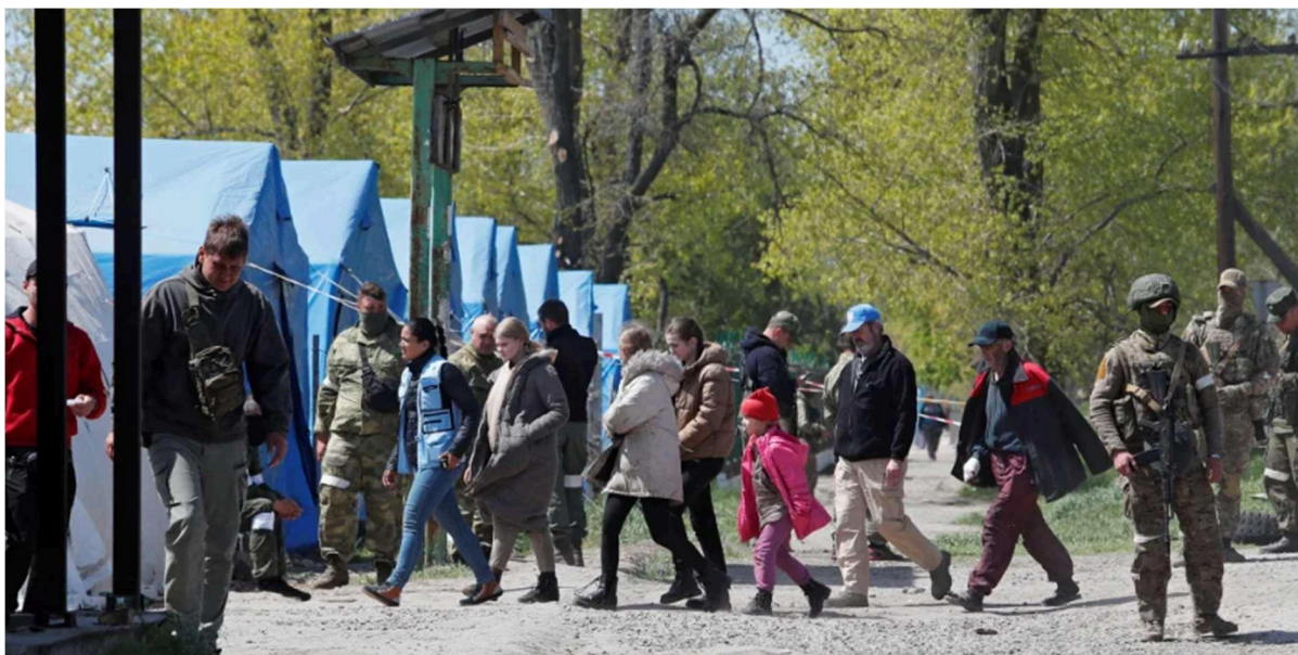
Figura 8: Imagem que mostra a entrada do acampamento.