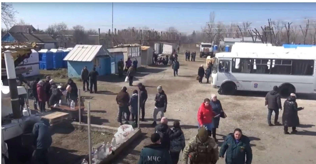
Figura 5: Estrutura do acampamento na vila de Benzimenne.

Em seguida, dados de 2022 indicam que o acampamento foi transferido para tendas verdes localizadas a oeste da escola, embora não tenham sido encontradas informações ou imagens sobre essa etapa. O local definitivo foi estabelecido ao redor de uma cozinha do vilarejo. De acordo com a figura 4, o acampamento consiste em tendas montadas sobre estruturas metálicas e cobertas por lonas, e inclui banheiros químicos.