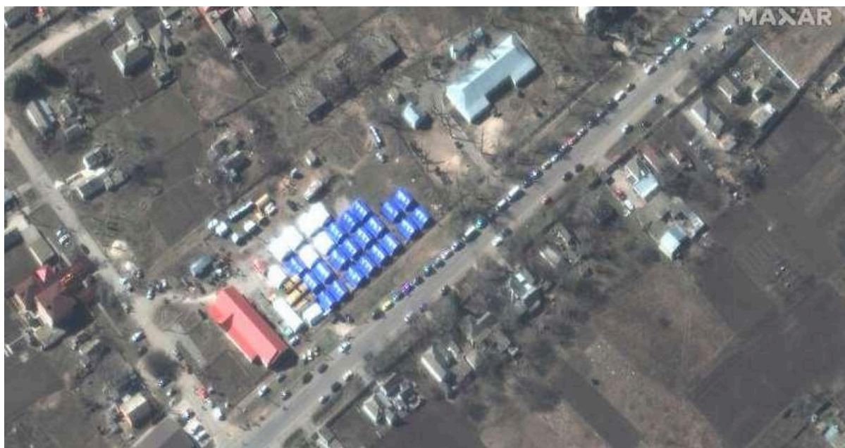
Figura 6: Vista de satélite do acampamento de Bezimenne, a leste de Mariupol (Ucrânia), em 22 de março de 2022.

Não foram obtidas informações detalhadas sobre o layout do acampamento, cuja sua implantação apenas pode ser visualizada em imagens de satélite. A partir da figura 6, observa-se um total de 19 tendas azuis, 6 tendas brancas e outras tendas anexas. Uma estrutura com telhado vermelho, possivelmente utilizada como cozinha, segundo as informações dos sites consultados, parece estar sendo empregada pelo acampamento.