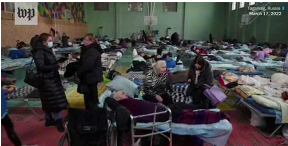
Figura 4: Situação do abrigo temporário no ginásio de uma escola na vila de Bezimenne.

Em seguida, dados de 2022 indicam que o acampamento foi transferido para tendas verdes localizadas a oeste da escola, embora não tenham sido encontradas informações ou imagens sobre essa etapa. O local definitivo foi estabelecido ao redor de uma cozinha do vilarejo. De acordo com a figura 4, o acampamento consiste em tendas montadas sobre estruturas metálicas e cobertas por lonas, e inclui banheiros químicos.