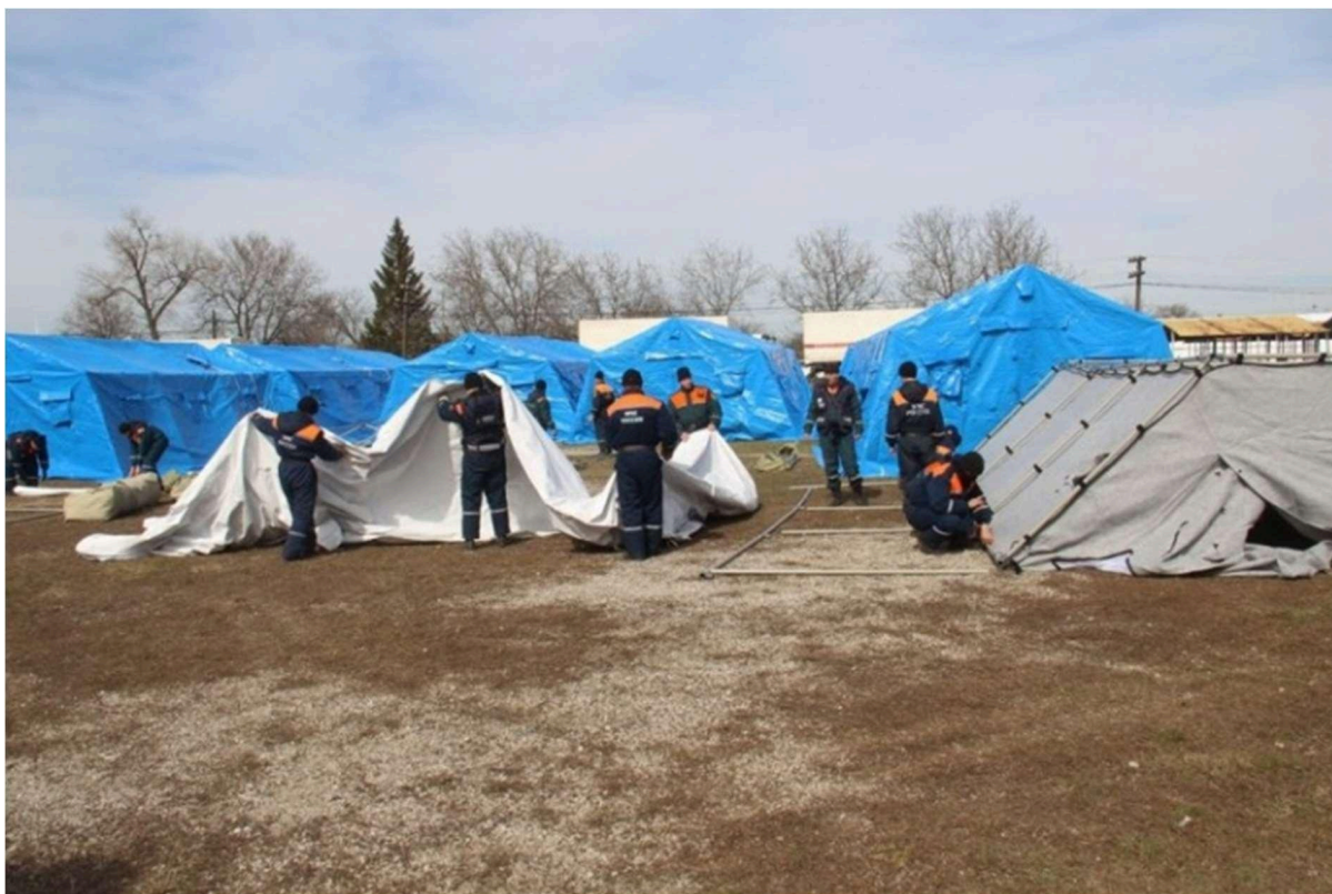
Figura 10: Imagem que mostra a instalação das tendas no acampamento.