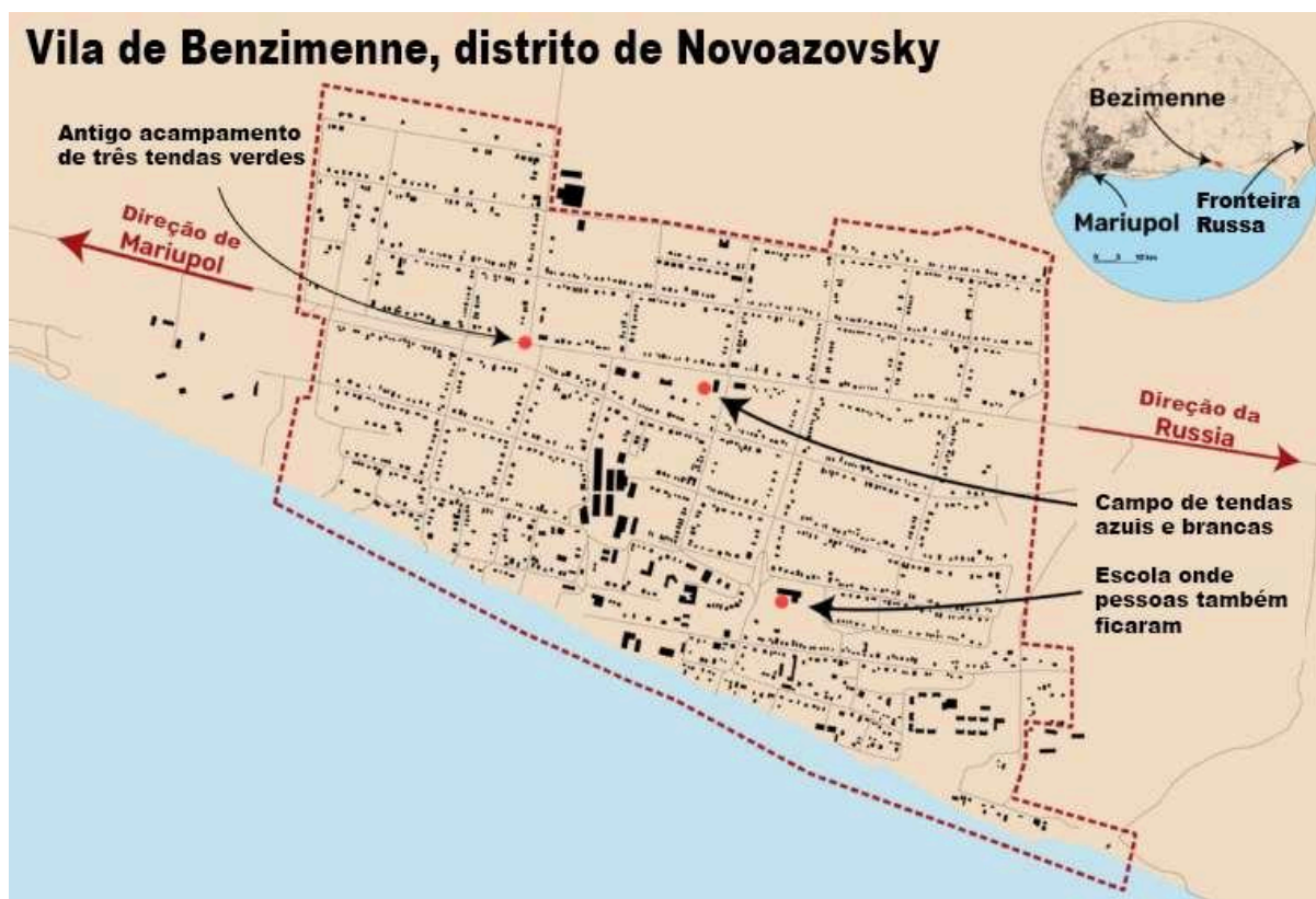
Figura 1: Localização do acampamento na vila de Benzimenne.

O acampamento está localizado em Bezimenne, na principal estrada oeste-leste, a E58, entre Mariupol e a Rússia. A localização é a aproximadamente 11 milhas (17,7 km) a leste dos arredores de Mariupol e cerca de 20 minutos de carro da fronteira com a Rússia (World Said, 2022). O acampamento possuiu um total de 3 locais de implantação: inicialmente, em uma escola do vilarejo; posteriormente, em um conjunto de 3 tendas, e, por fim, o campo de tendas implantado na estrada principal.