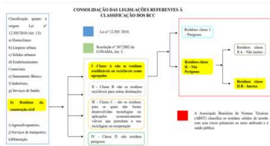
Figura 2: Consolidação.

De acordo com (Júnior, 2017) [5], a referida Resolução define que os resíduos da construção civil são aqueles provenientes de construções, reformas, reparos e demolições de obras de construção civil, assim como, daqueles resultantes do preparo e da escavação de terrenos. São exemplos de resíduos: tijolos, blocos cerâmicos, concreto em geral, solos, rochas, metais, resinas, colas, tintas, madeiras e compensados, forros, argamassa, gesso, telhas, pavimento asfáltico, vidros, plásticos, tubulações, fiação elétrica etc. Pela (CONAMA,2002) [1], são classificados de acordo com as classes de A – D, descritas a seguir na figura 1: