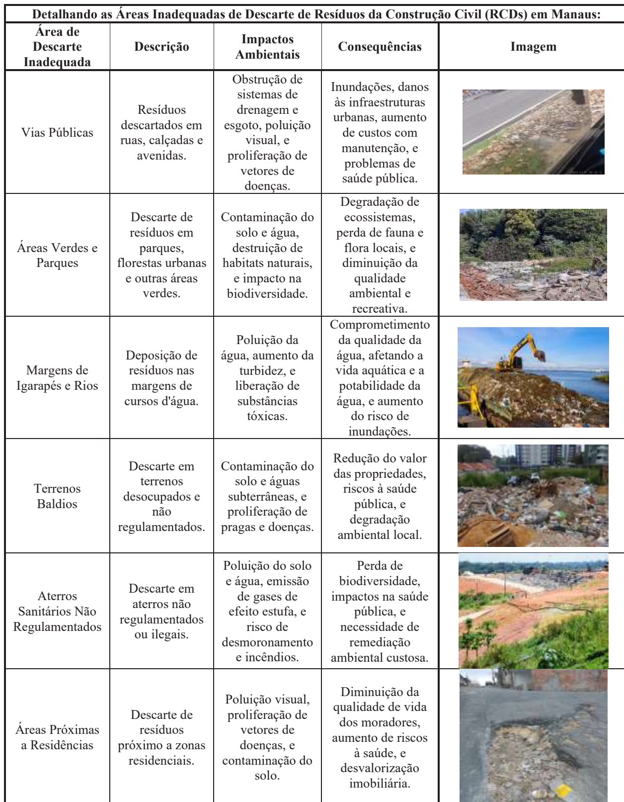
Quadro 2: Áreas Inadequadas de Descarte de Resíduos da Construção Civil (RCDs).