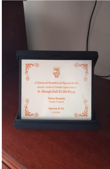
Figura 6 – Homenagem da prefeitura de Sapucaia do Sul ao Seu Mustafa