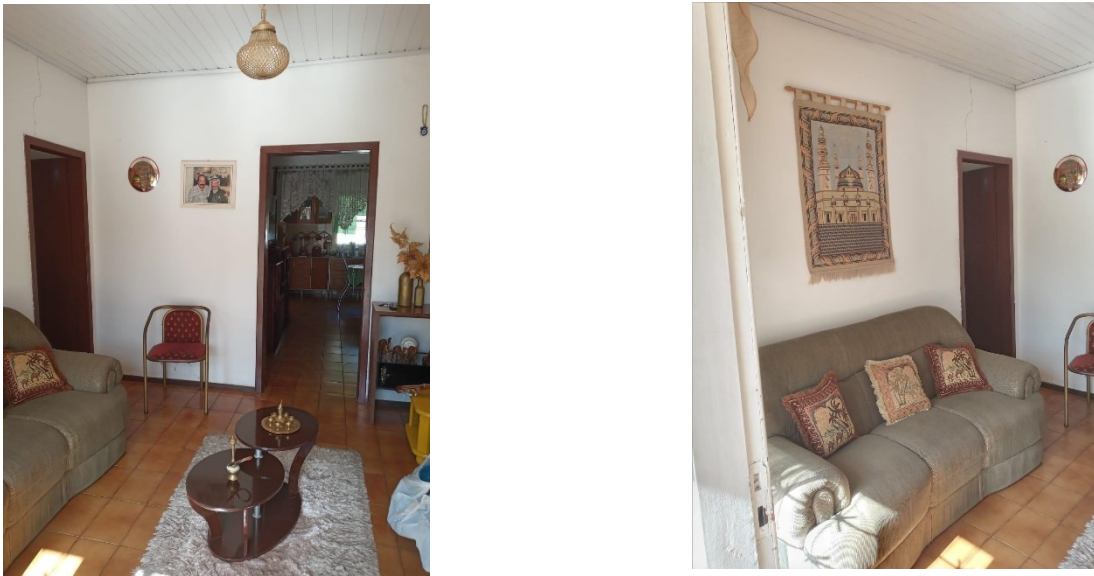
Figura 2 – Sala de entrada da casa da família Rizeq