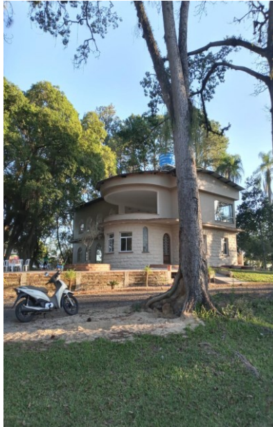
Figura 5 – Fotografia do prédio principal da Sociedade Árabe Palestina de Sapucaia do Sul