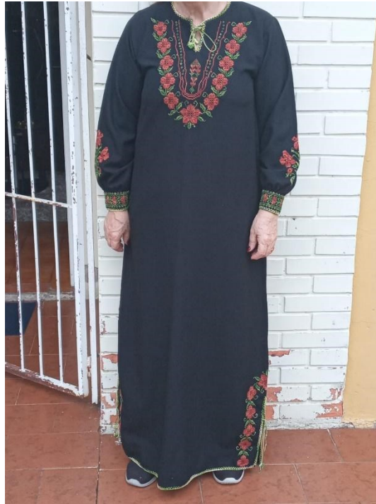
Figura 3 – O presente da sogra