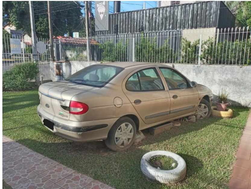
Figura 4 – O velho carro do pai