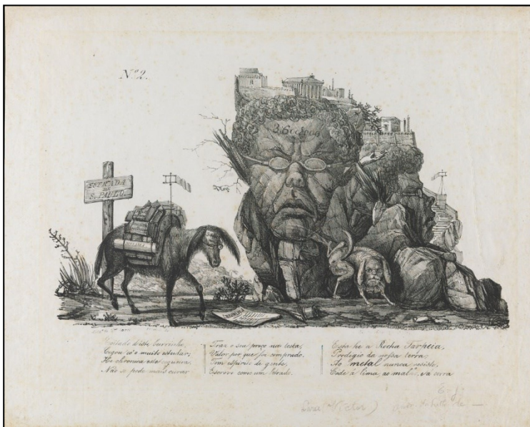
Figura 2 – A Rocha Tarpeia