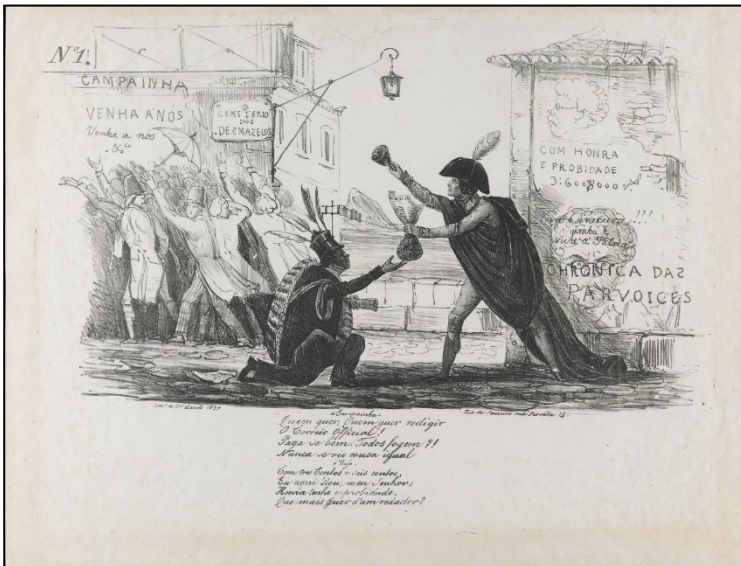
Figura 1 – A campanha e o cujo

tinteiro por chapéu, um rolo de papel sob o braço), recebendo um punhado de moedas para administrar o Correio Official – ou, dito claramente, vendendo sua independência jornalística ao governo. Segundo O Parlamentar , a caricatura foi procurada com “ânsia” e “assustou espantosamente os devoristas ministeriais”, pois “nela se vê o quadro mais deplorável em que se acham os homens de 19 de setembro”, quer dizer, do gabinete de Araújo Lima: “por maior vergonha não passou ainda governo algum!!!” (VARIEDADES, 1837, p. 124).