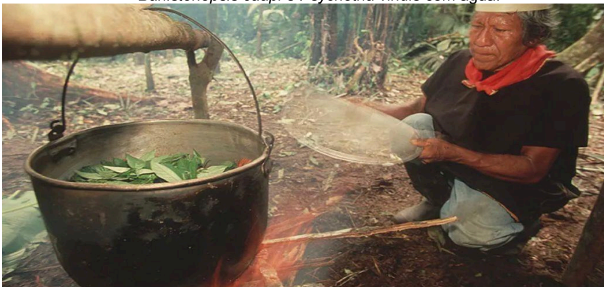
Imagem 3 - Feitio Ancestral de Ayahuasca, cozimento das duas espécies Banisteriopsis caapi e Psychotria viridis com água.