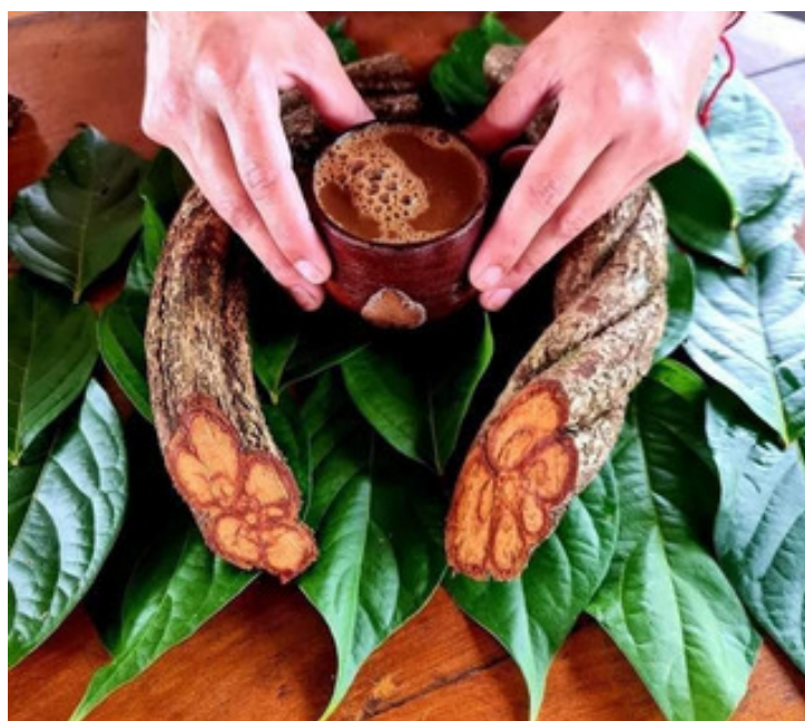
Imagem 1 – Jagube

Esses estudos destacam como a Ayahuasca além de proporcionar uma experiência espiritual, promove também mudanças cerebrais relevantes e potencialmente benéficas, levantando questões importantes sobre o papel dessas substâncias na saúde mental e no desenvolvimento da consciência humana.