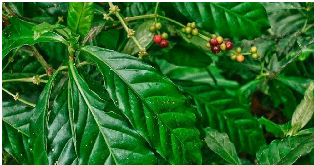
Imagem 2 – Chacrona