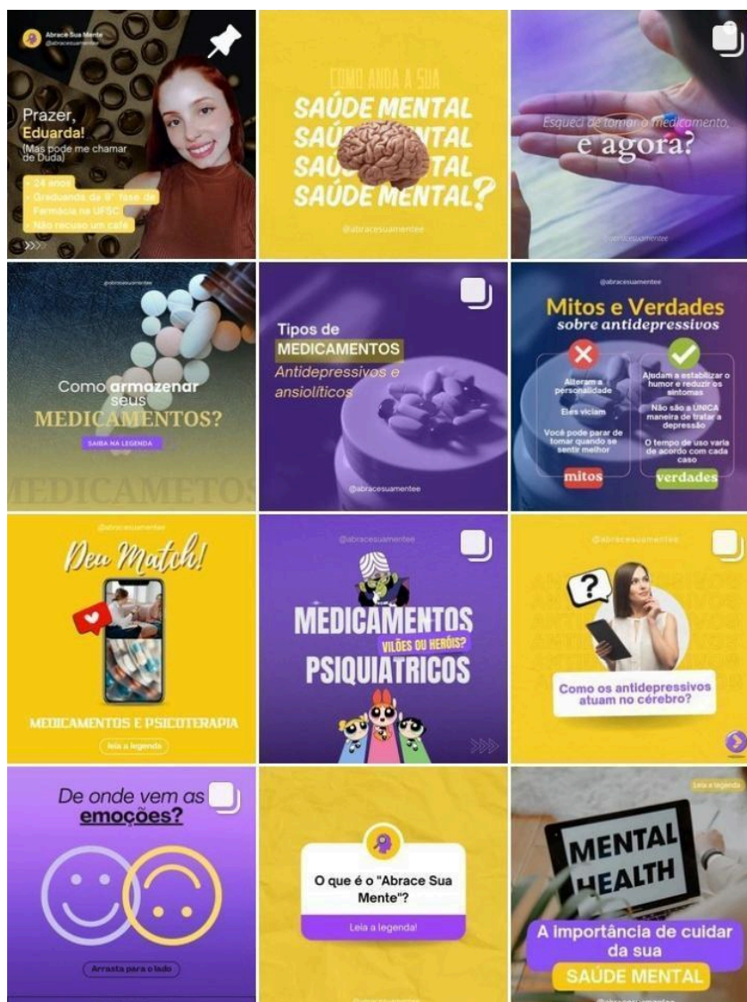
Figura 3 - Feed da página