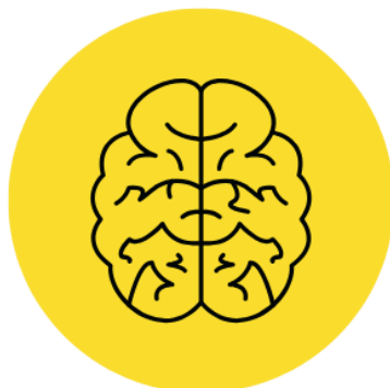
Figura 1 - Logotipo da página