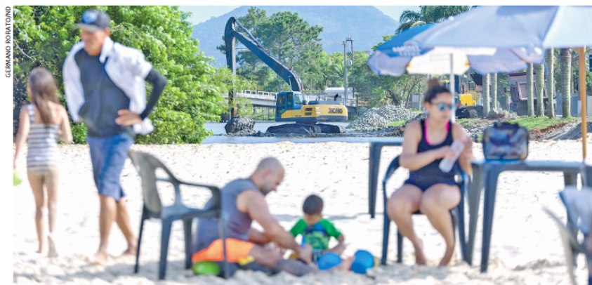
Equipamentos retiram resíduos do fundo e das margens do rio desde a última segunda-feira