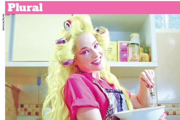
“Adorável Evolução” é um dos filmes que serão exibidos no próximo dia 19, durante o circuito

Florianópolis recebe o Circuito FAM de Cinema / Festival Internacional de Cinema Florianópolis Audiovisual Mercosul / Cineclube Rogério Sganzerla / CCE / Centro de Comunicação e Expressão / UFSC