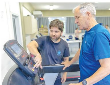
Para Getulio, prática de musculação e esteira deu injeção de ânimo e disposição para o dia a dia