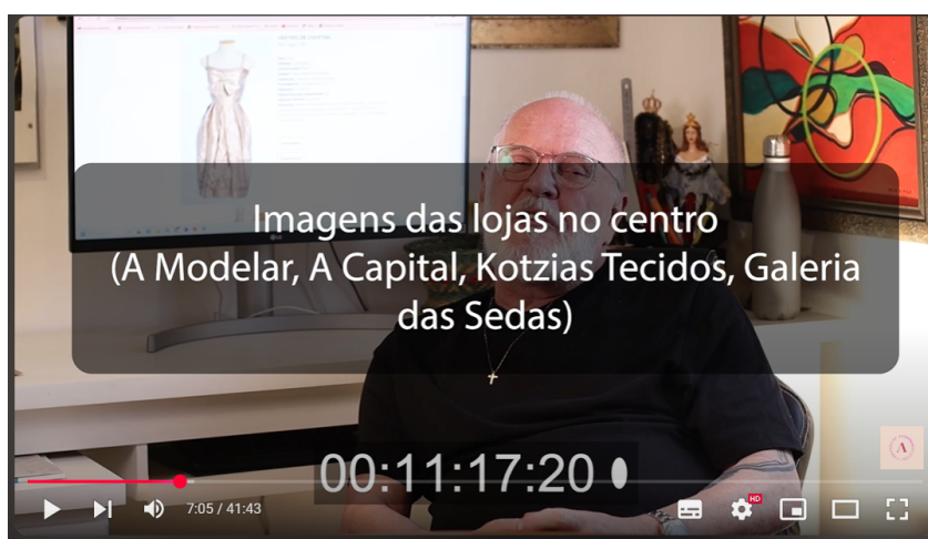
Figura 3: Print do vídeo-esqueleto utilizado como guia para o processo de edição da versão final do documentário.

Com os detalhes definidos e um roteiro praticamente finalizado, fiz os últimos ajustes no vídeo-esqueleto antes de enviá-lo ao editor. Além disso, criei um roteiro detalhado no Excel , especificando ao máximo os elementos necessários: trilha sonora, imagens de cobertura, arquivo de vídeo, minutagem, trecho, lettering/naming e frases ou palavras de destaque para o lettering .