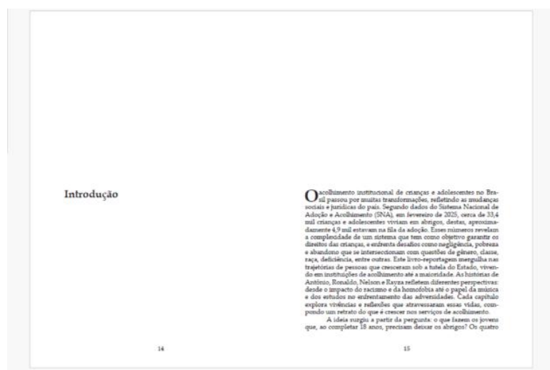
Figura 1 – Projeto gráfico

No total, o livro conta com 114.120 caracteres distribuídos em 82 páginas. Após a finalização da diagramação, o material foi enviado para a gráfica Centro Cópias. O conjunto foi revisado e ajustado antes da finalização, garantindo um acabamento gráfico que respeitasse a identidade visual definida para o projeto.