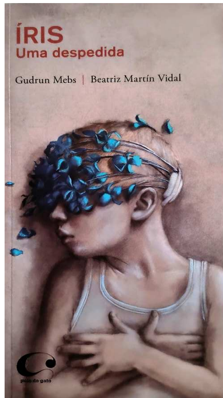
Figura 8 – Íris - uma despedida (Mebs, 2012)