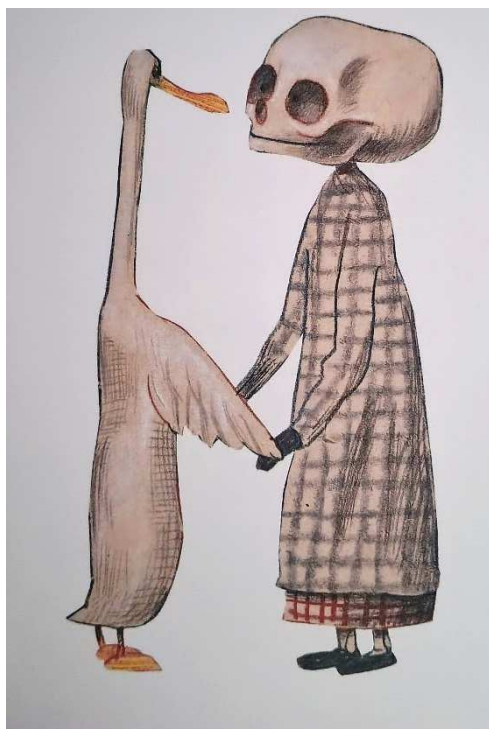
Figura 4 – O pato, a morte e a tulipa (Erlbruch, 2023)

A narrativa é construída a partir da história de que um dia, o pato percebe a presença física e visível da morte junto dele e diante disso, tem a certeza de que irá morrer. No entanto, uma relação amigável vai sendo construída entre o pato e a morte, passando um bom tempo juntos, conversando, passeando e refletindo. Aproveitando o tempo, a vida. Eles nadam no lago, dormem juntos e até sobem em uma árvore e refletem sobre o tempo, a vida, a morte, as mudanças e as permanências que tudo isso implica. Essa improvável amizade entre aquele que leva e aquele que será levado instiga que o leitor reflita sobre a passagem da vida, a chegada da morte e os tantos momentos entre esse período. A tulipa aparece de forma sutil e delicada na história, sempre nas mãos da morte, como quem espera para se despedir, ou melhor, se encontrar com aquele que levará no futuro, no caso, o pato. Enquanto a morte e o pato convivem e passam tempo juntos, a tulipa desaparece, como se tivesse sido guardada no bolso, como se o momento fúnebre do fim da vida não fosse o mais importante, mas sim tudo aquilo que está acontecendo antes disso, durante a vida.