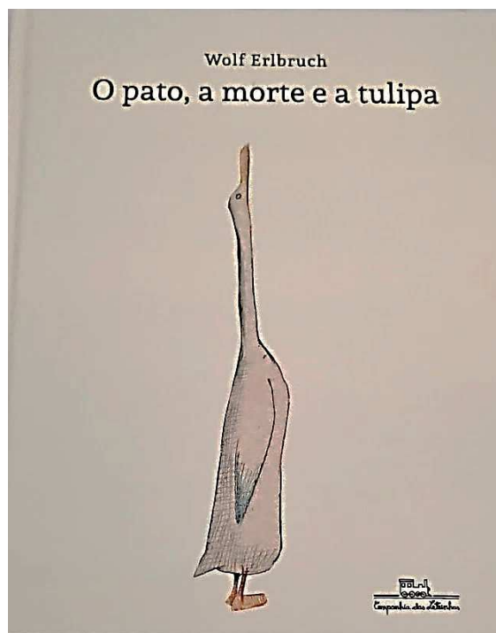
Figura 3 – O pato, a morte e a tulipa (Erlbruch, 2023)

entendimento natural da morte, mesmo que ela envolva tantos mistérios ainda não desvendados, levando em consideração que podemos entender o que ocorre após seu desfecho factual de diferentes maneiras.