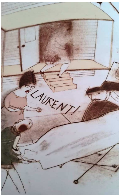
Figura 11 – Harvey, como me tornei invisível (Bouchard, 2012, p. 70)

sensibilidade e com uma riqueza de detalhes que instiga o envolvimento do leitor com a história, estabelecendo forte conexão com a realidade.