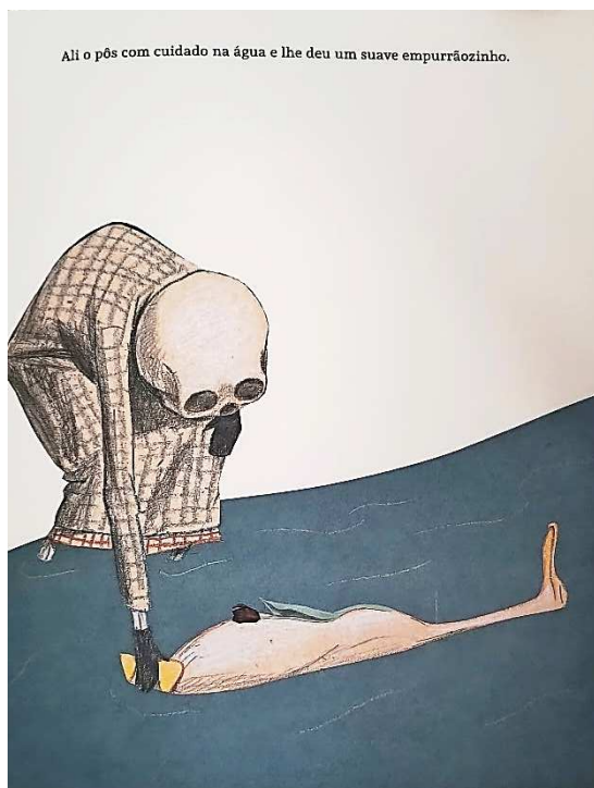
Figura 5 – O pato, a morte e a tulipa (Erlbruch, 2023)