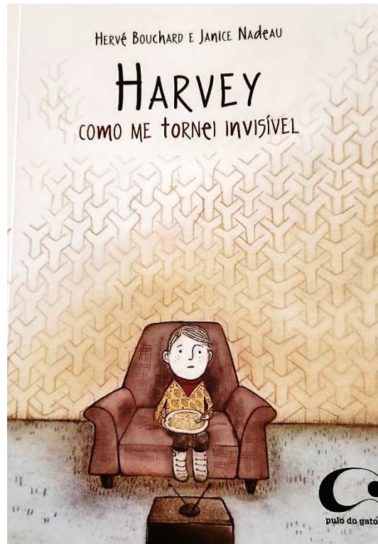
Figura 10 – Harvey, como me tornei invisível (Bouchard, 2012)