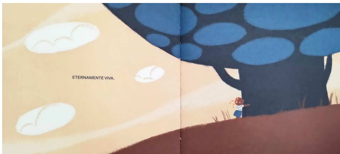
Figura 7 – Vovó virou semente (Ciríaco, 2023)

Dessa maneira, compreendo que a obra Vovó virou semente (Ciríaco, 2023) pode ser utilizada na construção de um percurso questionador e reflexivo. É uma narrativa potente, repleta de diálogos, críticas e desvendamentos, chamando o leitor a participar ativamente da busca por considerações em relação ao que está sendo contado. Sendo assim, é possível inferir a possibilidade de utilizar essa obra enquanto uma forma de abordar a morte e o luto.