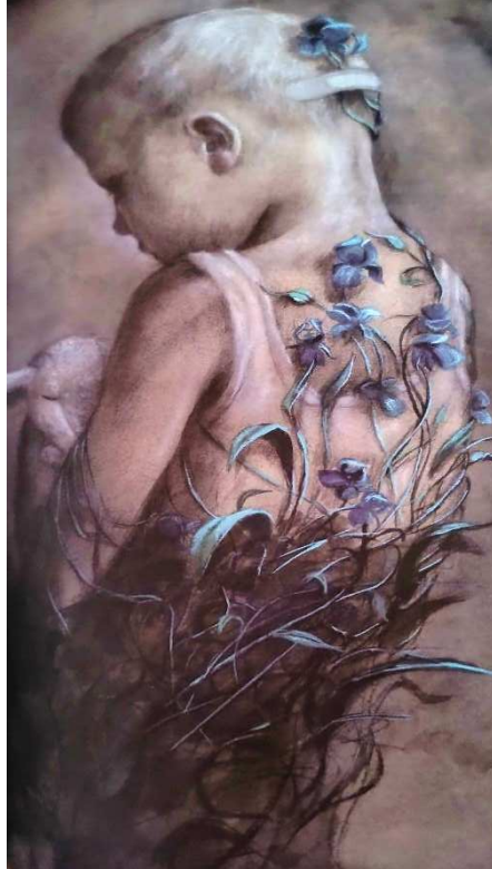
Figura 9 – Íris - uma despedida (Mebs, 2012, p. 45)