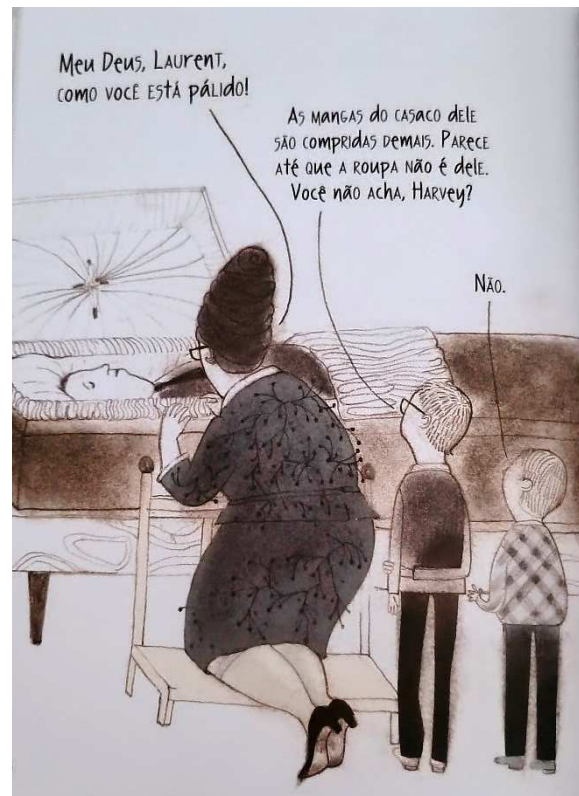
Figura 12 – Harvey, como me tornei invisível (Bouchard, 2012, p. 136)

homem. O tio Régis disse que ele estava magro demais. Vovó Bouillon disse que a testa dele estava abaulada. A tia Fiolineia achou suas faces encovadas. O tio Marcel disse que seus poros estavam fechados. A tia Ionaleia achou que o queixo dele estava caído. A tia Madelineia o achou abatido. Durante todo o velório (Bouchard, 2012, p. 140).