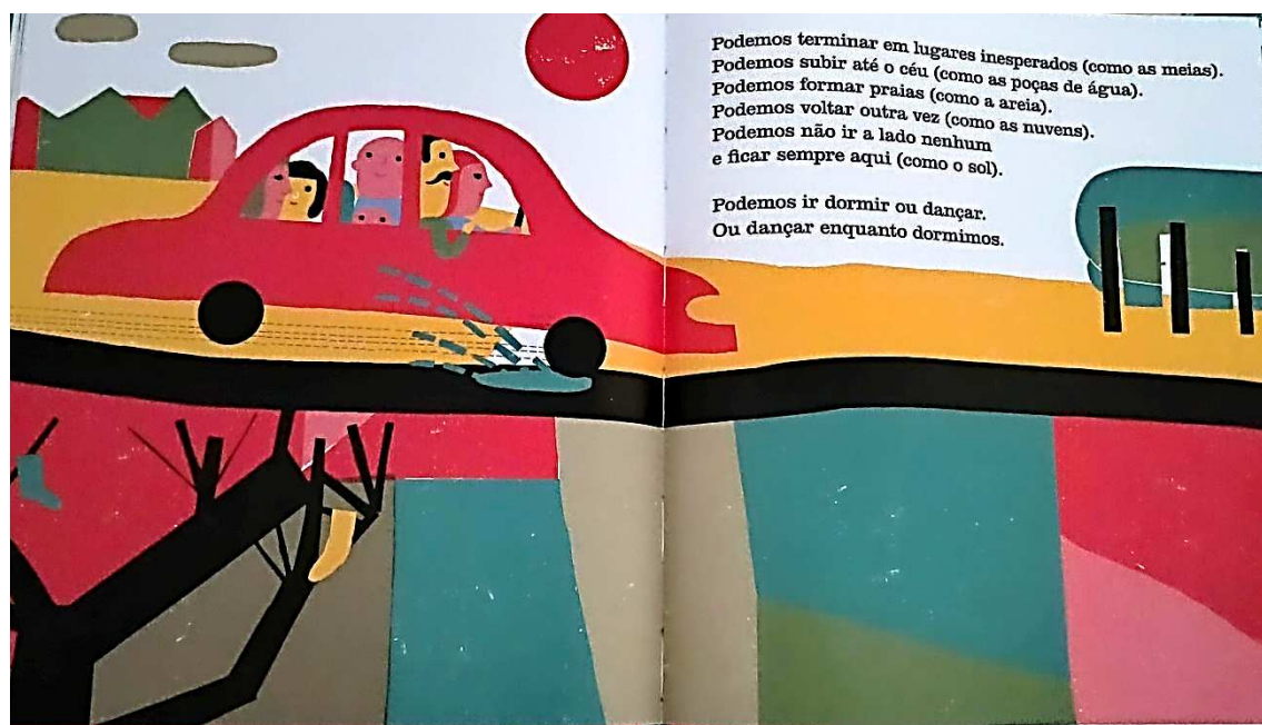
Figura 2 – Para onde vamos quando desaparecemos? (Martins, 2015)

Podemos terminar em lugares inesperados (como as meias). Podemos subir até o céu (como as poças de água). Podemos formar praias (como a areia). Podemos voltar outra vez (como as nuvens). Podemos não ir a lado nenhum e ficar sempre aqui (como o sol) (Martins, 2015, s.p.).