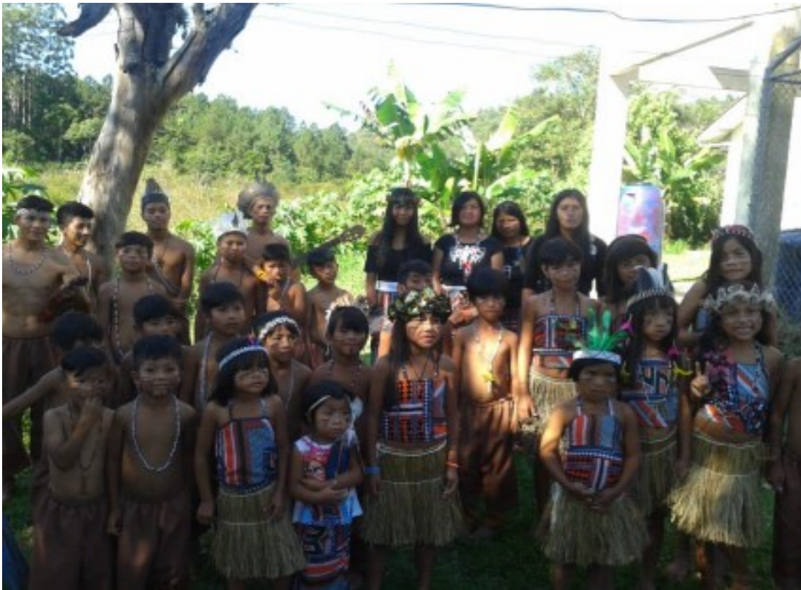
Figura 1. Aldeia da Harmonia, 2025.