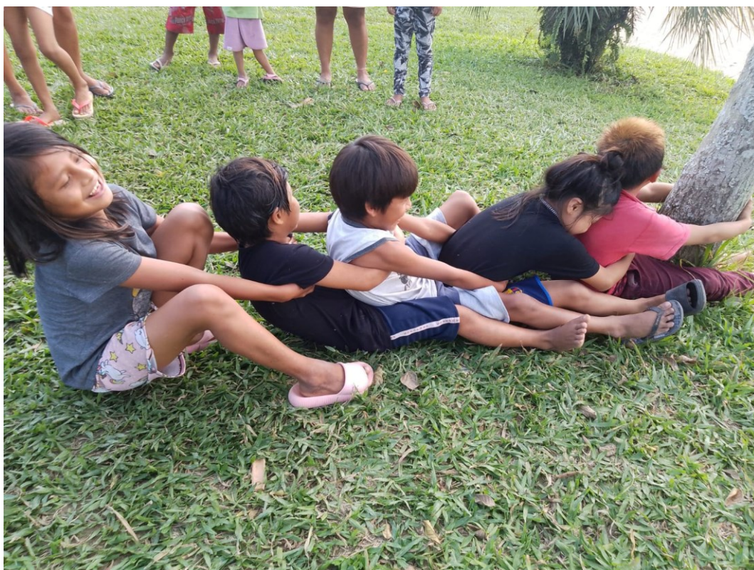
Figura 20. Brincadeira Mandió.