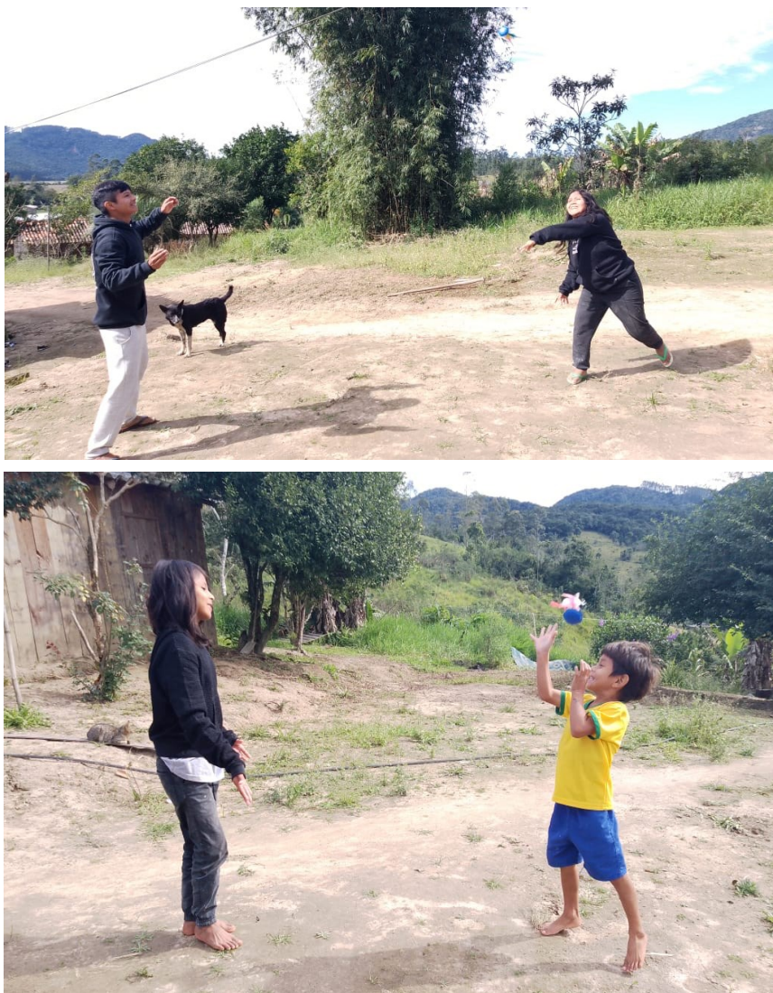
Figura 13. Brincadeira de Peteca