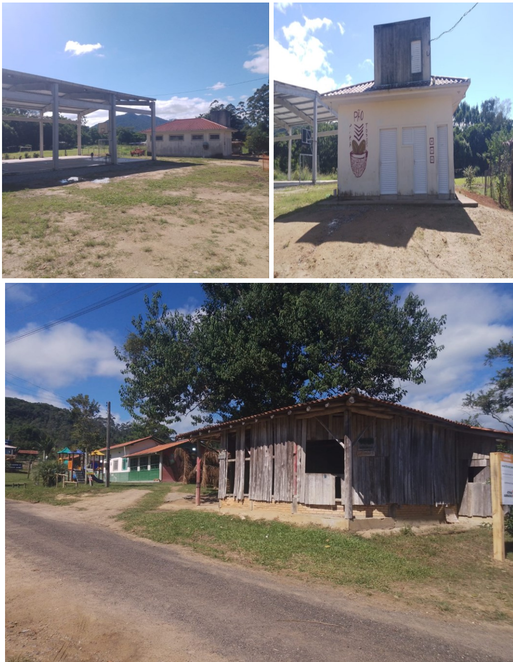
Figura 7. Entrada aldeia Casarão e Padaria e quadra coberta.