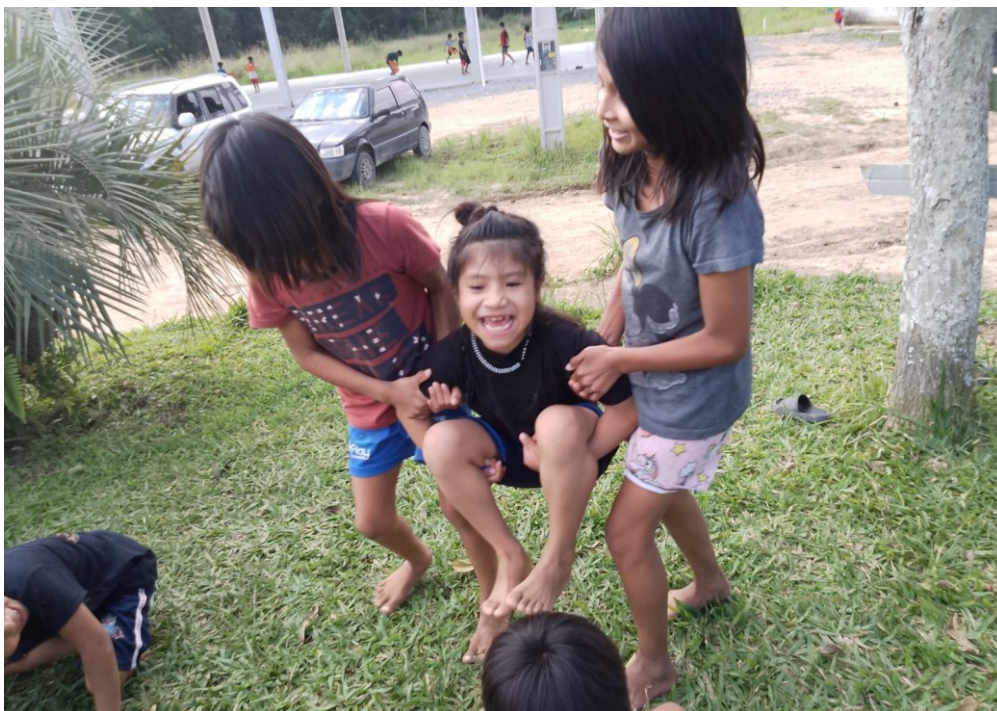
Figura 17. Brincadeira Oja