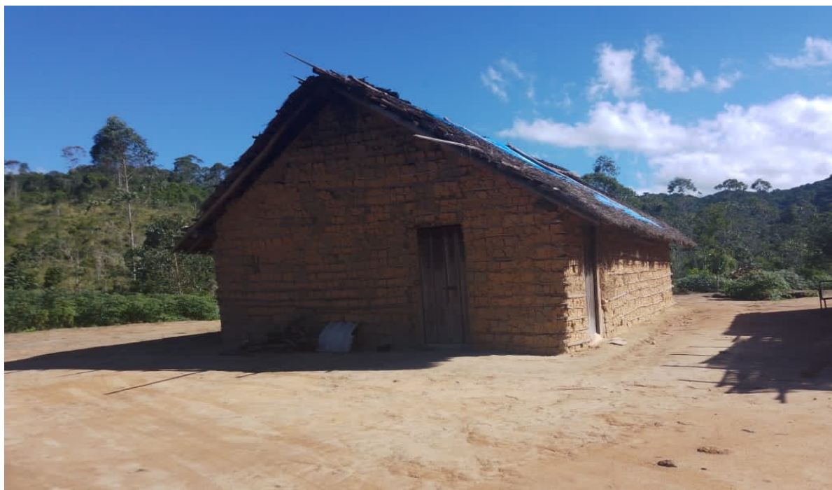
Figura 11. Casa de Reza.

Passando por essa parte, chegamos à parte final da aldeia, onde há mais 10 casas, junto da casa de reza.