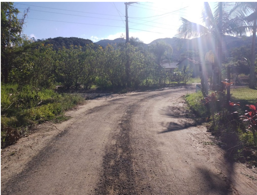
Figura 6. Entrada da Aldeia.

Essas observações vêm de um acompanhamento que faço constantemente, através de mapeamentos e levantamentos sobre a realidade da aldeia. Ao entrar na Tekoa Marangatu, a primeira casa que se vê é de um vizinho não indígena, que mora perto da entrada da reserva. Logo na entrada, há duas casas, e à direita da estrada, outras duas famílias vivem ali.