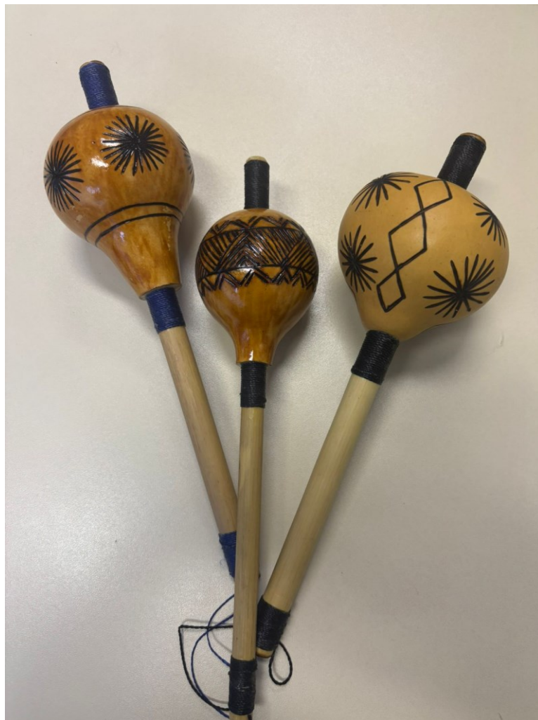
Figura 15. Brincadeira Mbaraka.