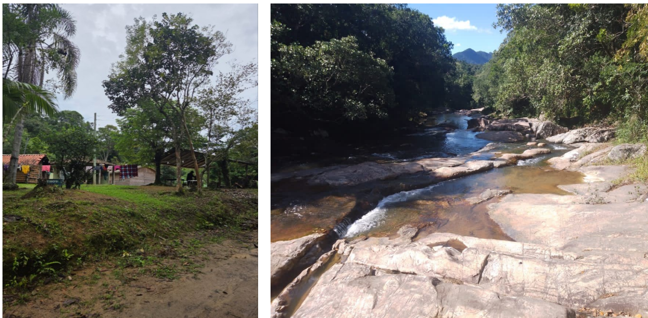
Figura 10. Foto das casas e da cachoeira.