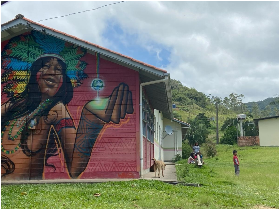
Figura 9. Escola.