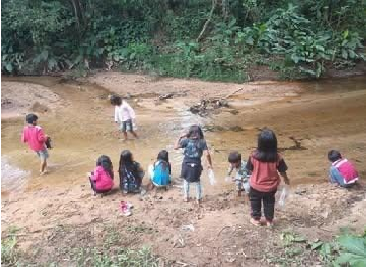
Figura 19. Brincadeira ROVO.