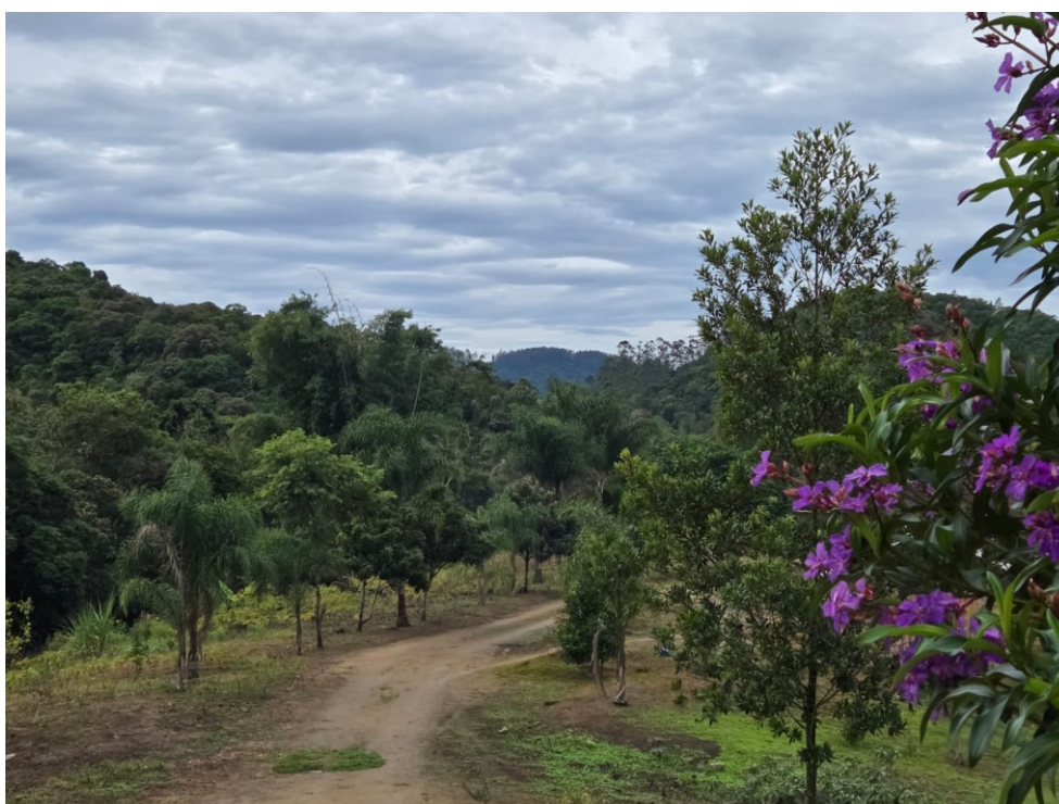
Figura 5. Foto da parte interna da Aldeia Tekoa Marangatu.

A aldeia é afastada da cidade, rodeada por montanhas, cachoeiras e sons da natureza. Esse ambiente de paz e equilíbrio inspirou o nome Marangatu, que em português significa "Lugar de Harmonia".