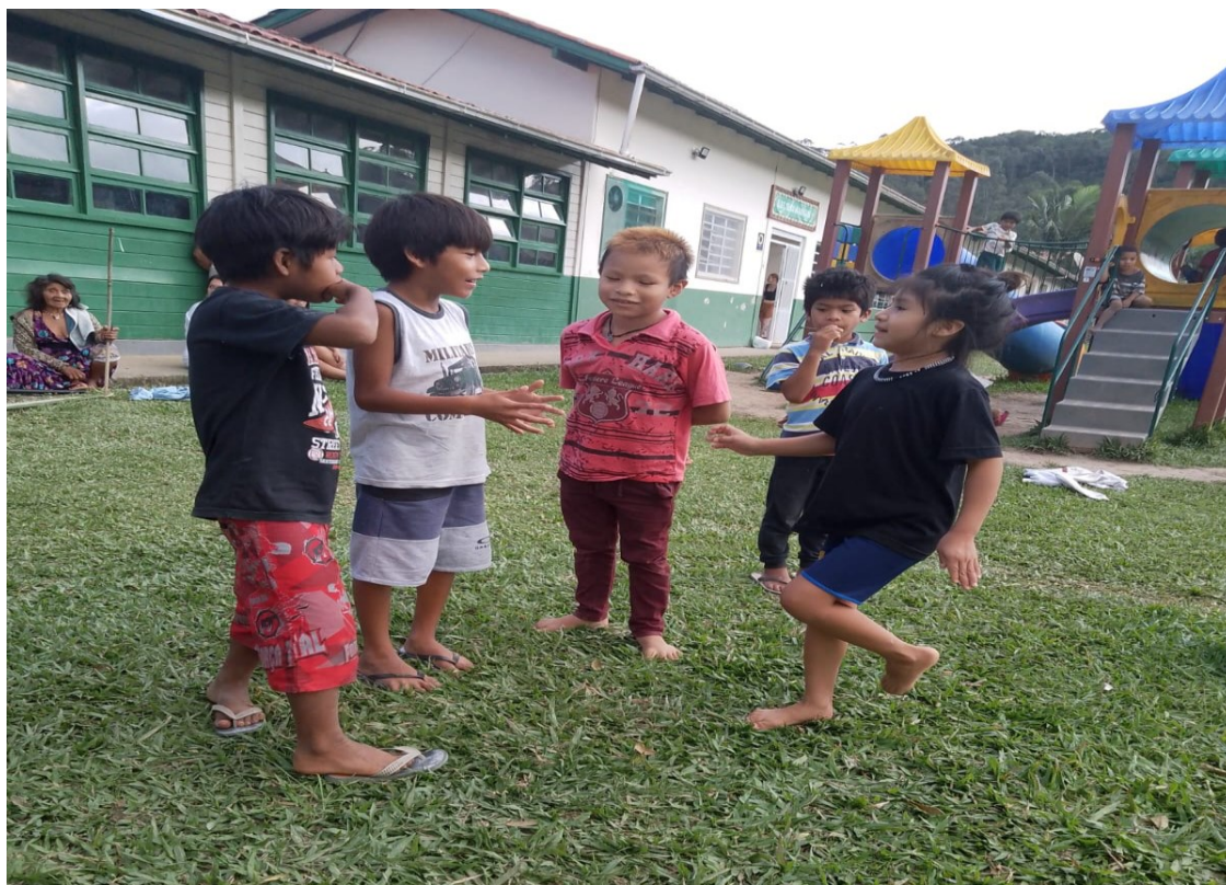
Figura 18. Jogo de Mímica.