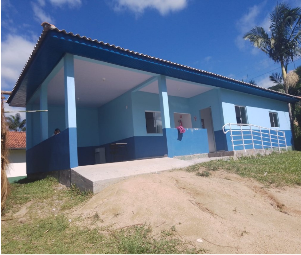
Figura 8. Posto de Saúde e Campo de futebol.