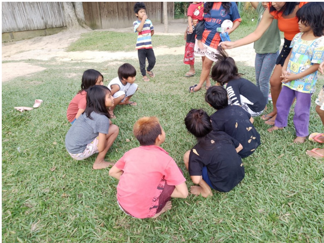
Figura 14. Brincadeira da Melancia.