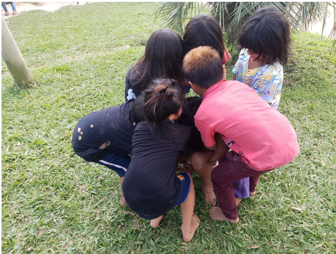
Figura 3. Crianças da Aldeia Tekoa Marangatu.