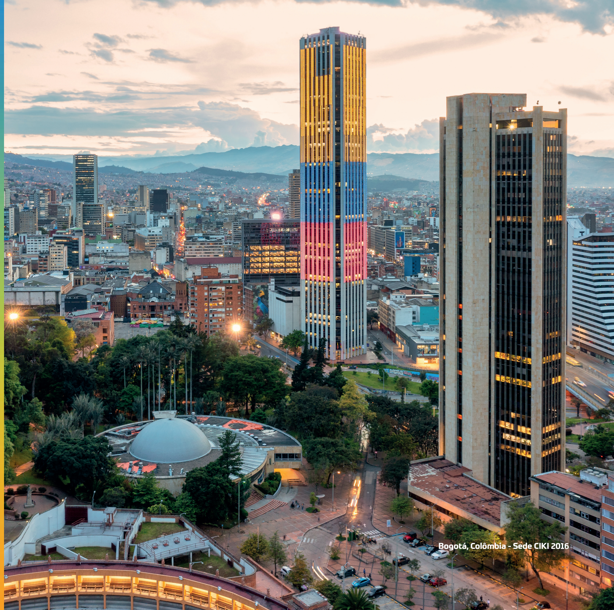
Bogotá, Colômbia - Sede CIKI 2016