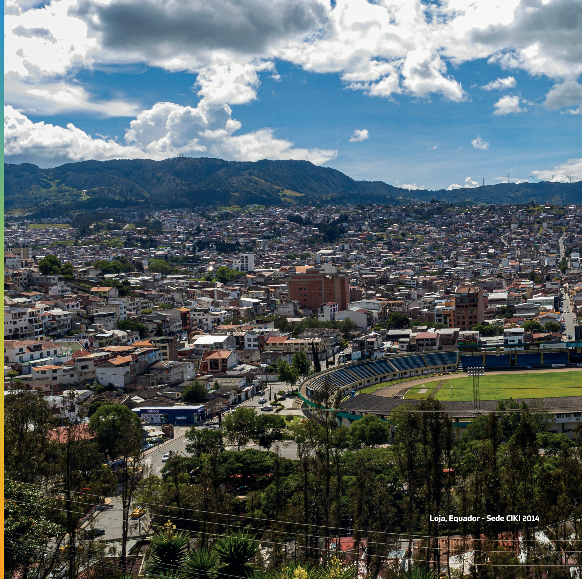
Loja, Equador - Sede CIKI 2014