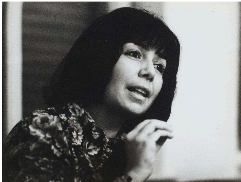
Bild 4 und 5 - Irmtraud Morgner. Porträts von 1975.